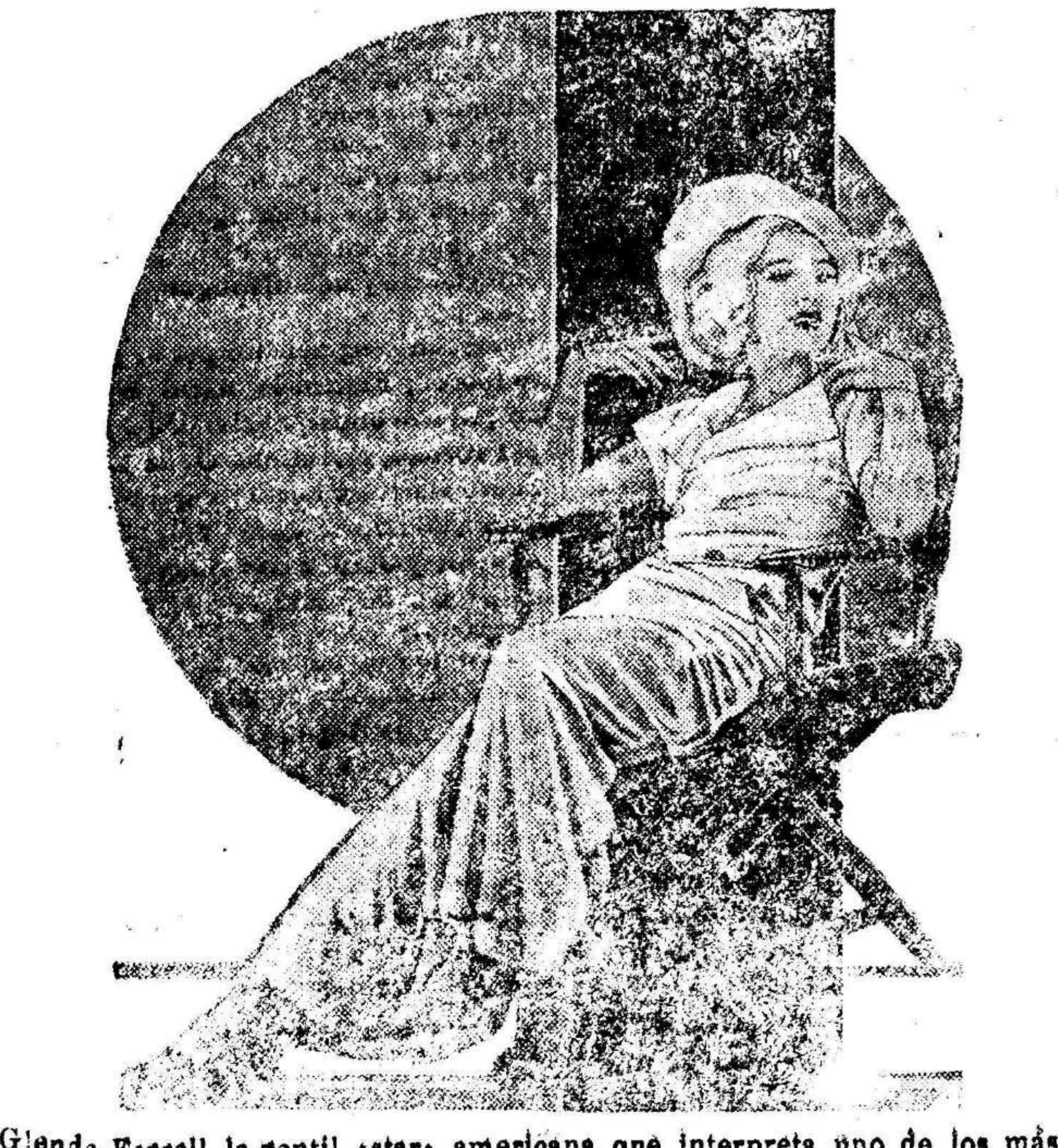
Glenda Farrell, la gentil «star» americana que interpreta uno de los más importantes roles de la película Columbia Cifesa DAMA POR UN DIA