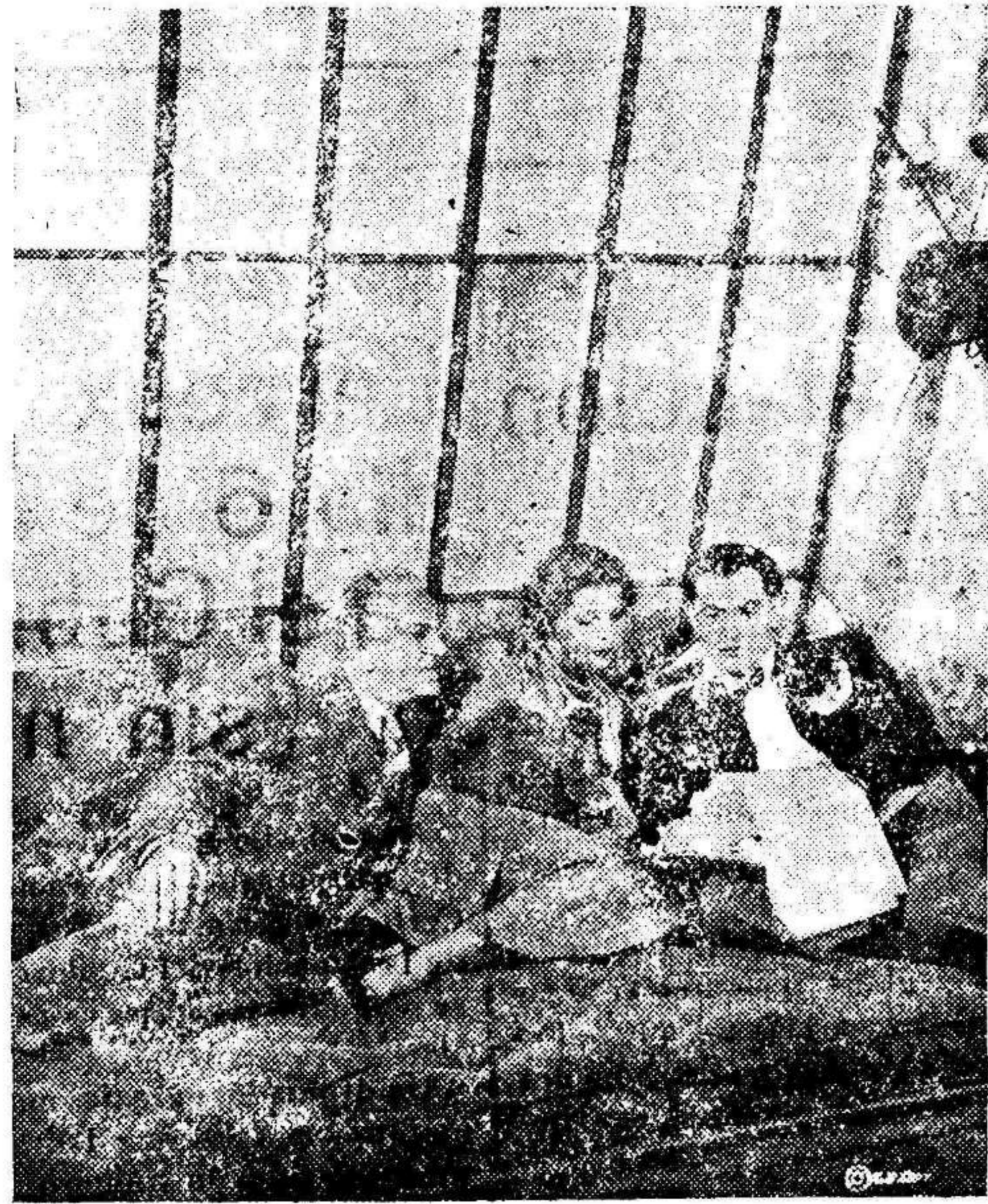
Frank Morgan, Elissa Landi y Joseph Schildkraut en una escena de la producción Columbia-Cifesa LA MUJER DE MI MARIDO

De este film Columbia que distribuye Cifesa, la entidad valenciana consagrada a los éxitos, hace una insuperable creación Carole Lombard. De un asunto trivial, sin trascendencia, hace ella una película sugestiva, interesante, muy agradable.