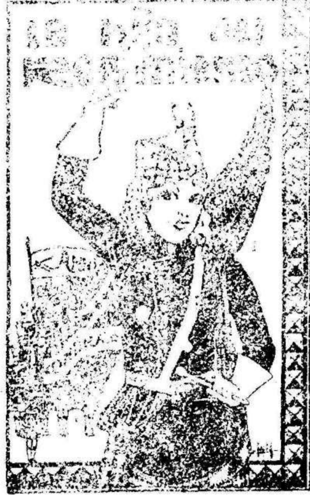
La magnífica película que será estrenada en el CIRCO VILLAR el Sábado de Gloria día 20

Una película de tema sencillo, fácil, pero muy moderno, muy actual es «Vaya niña». Y en su naturalidad temática está la clave de su acierto para el mayor lucimiento del ánimo.