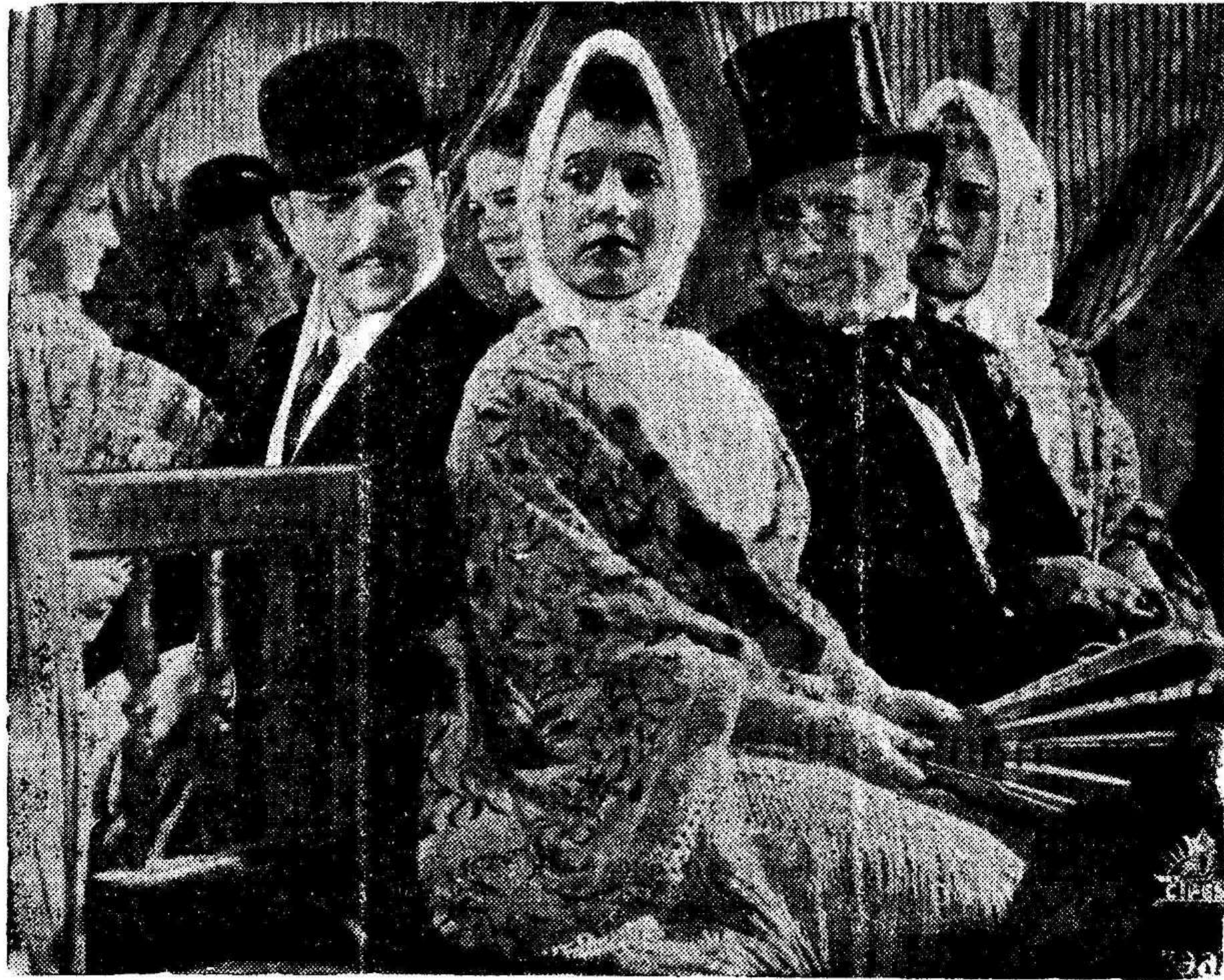
Una escena de la madrileñísima producción Cifesa «LA VERBENA DE LA PALOMA», estrenada con extraordinario éxito en diferentes poblaciones españolas

La tragedia de la vida del bandolero emociona a los que iban a matarlo, y conmovidos se retiran de la cueva. Pero en este momento se escucha la voz imperiosa de la Guardia Civil que acude a prender a Juanillo. Este, que no está dispuesto a entregarse, se vuelve hacia un lado de la roca en donde advertido de antemano aguarda escondido el Pesuño, y le ofrece el pecho para que dispare sobre él. Y una bala más piadosa que la acción legal de la justicia pone fin, junto al cadáver de la mujer que turbó su vida, a la azarosa existencia de «El Gato Montés».