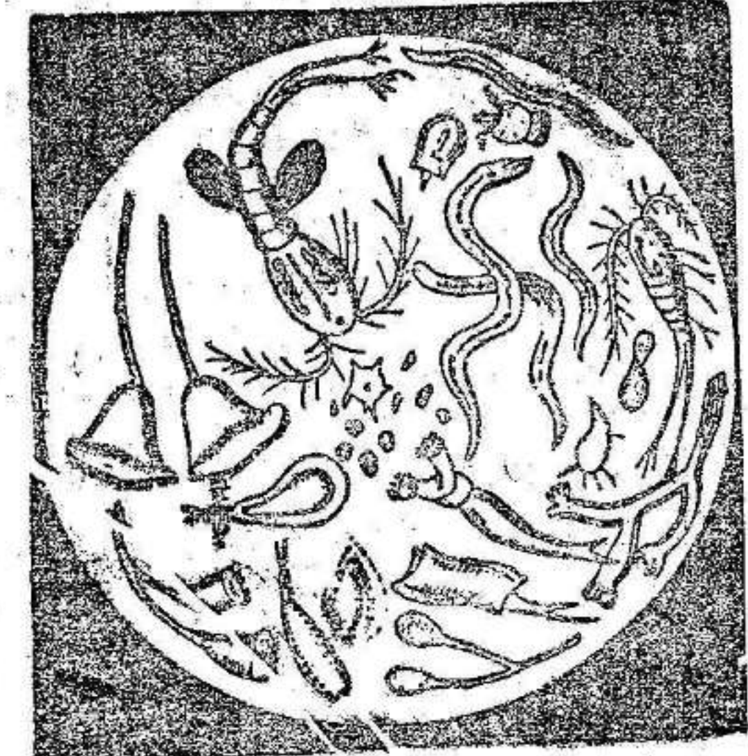
MICROBIOS destruidos por el Alquitran-Guyot