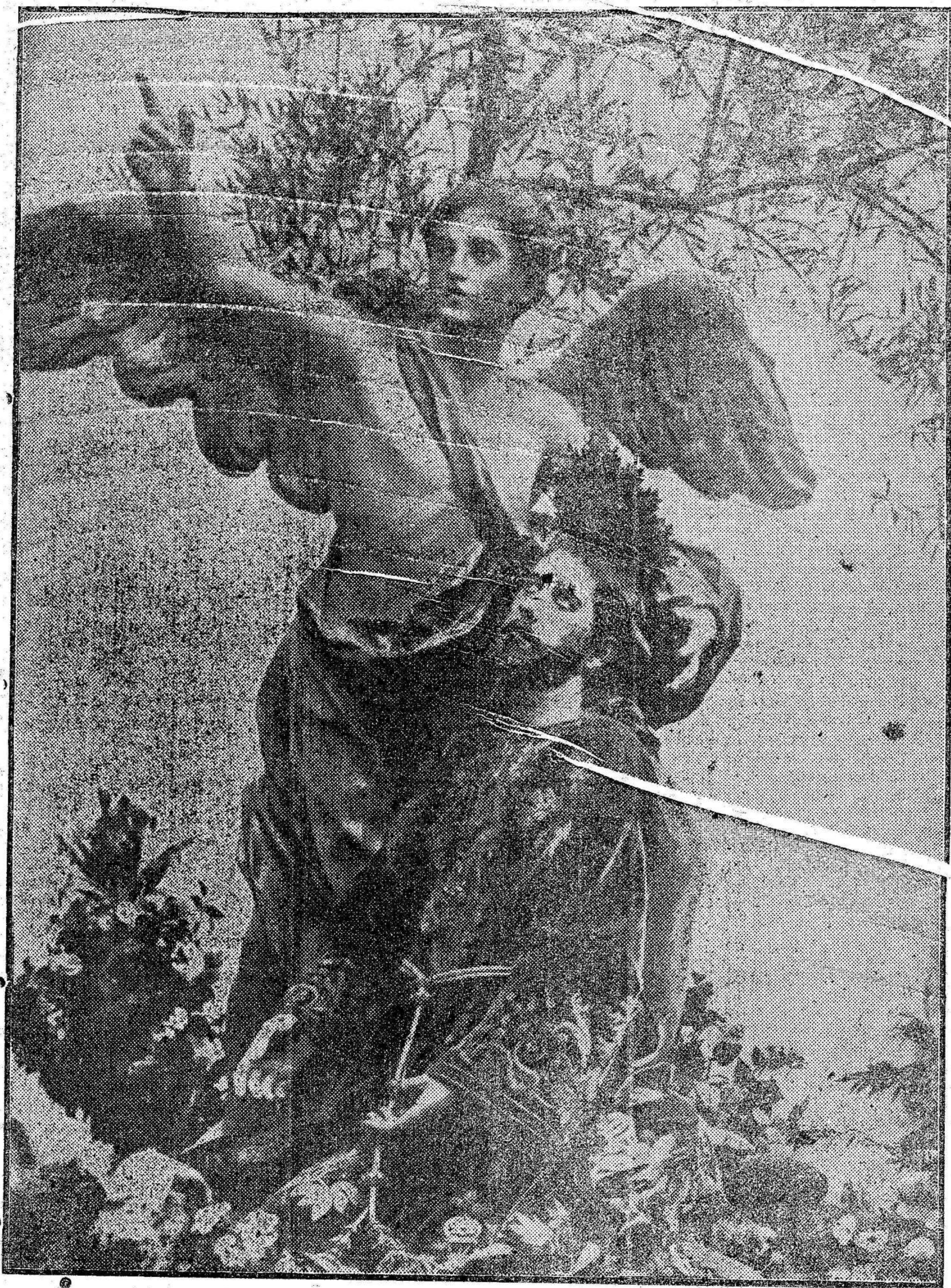
EL ÁNGEL DE LA ORACIÓN DEL HUERTO, DE SALZILLO