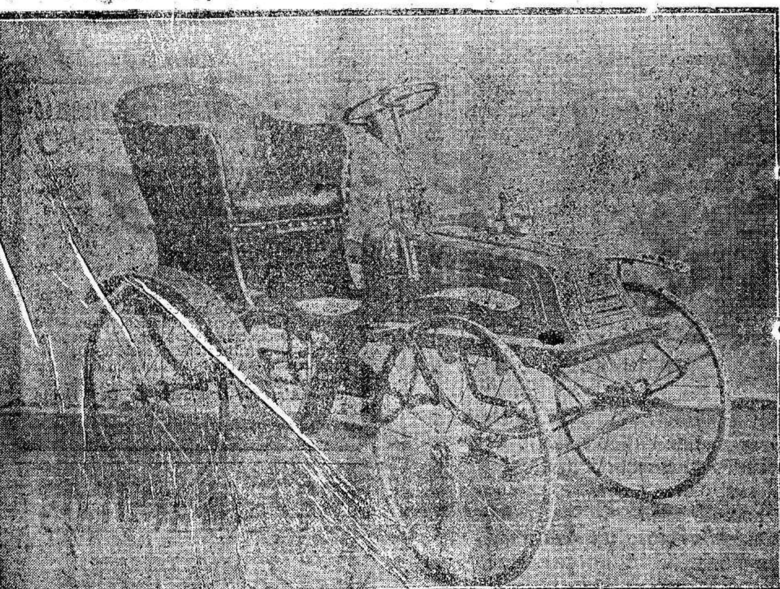
Primer premio.—EL AUTOMOVIL

—Los anunciantes tienen derecho a percibir tantos bonos de opción como fracciones de 2 pesetas satisfagan en la Administración de El Liberal. —Los suscriptores percibirán, desde Enero, tantos bonos como meses adelantados abonen, sin perjuicio de los que les correspondan por los meses corrientes.