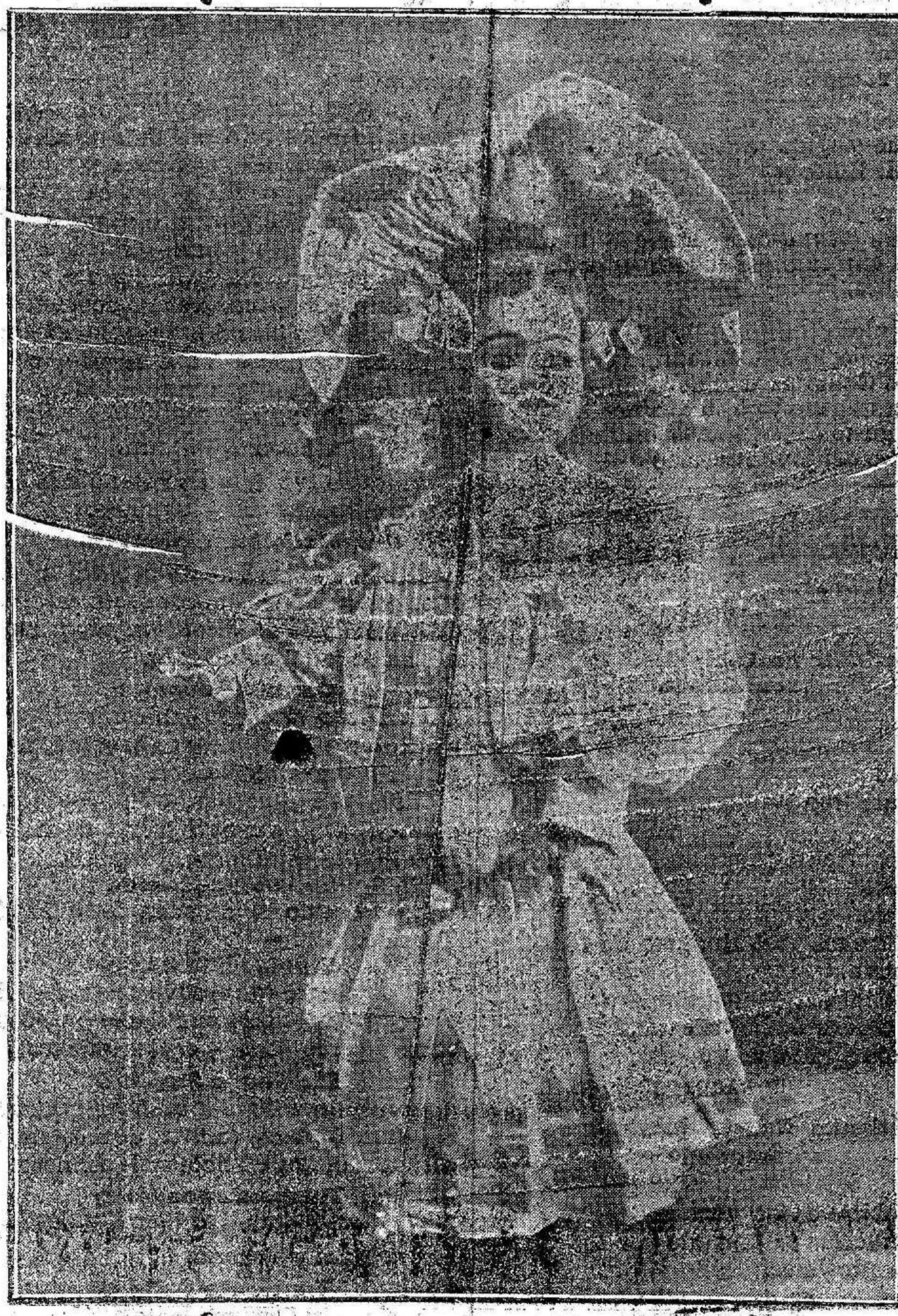
Segundo premio.—LA MUÑECA