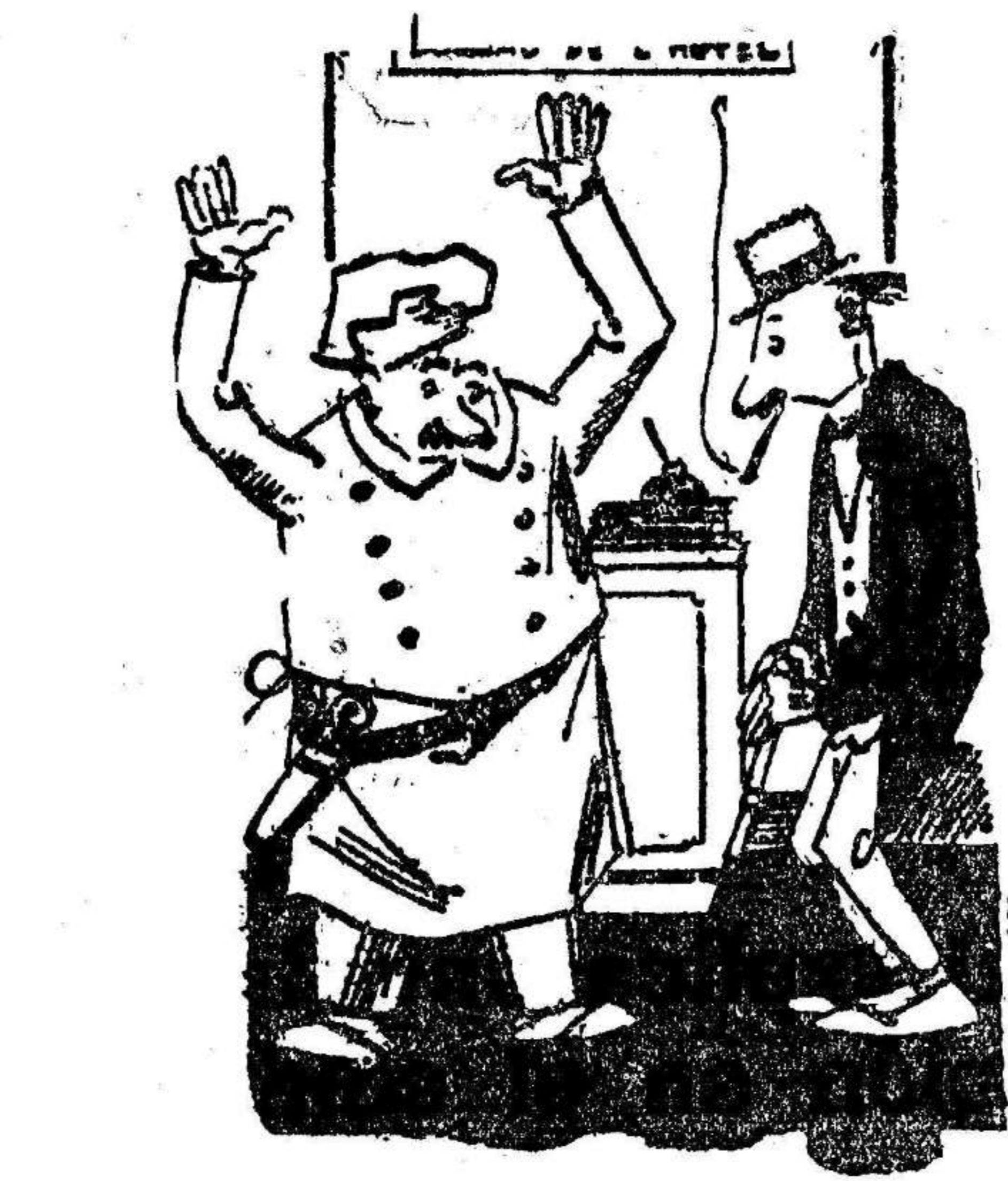
Otro de los huéspedes ha sido robado. Va a dar conocimiento a la policía. Sí, porque esta vez no tiene con qué pagar la cuenta del hotel.

Se precisa libertad al trabajo y gravar la renta y perseguir la riqueza oculta, y esto no tímidamente, como a veces se ha querido hacer, sino con empuje, y si es necesario, con audacia.