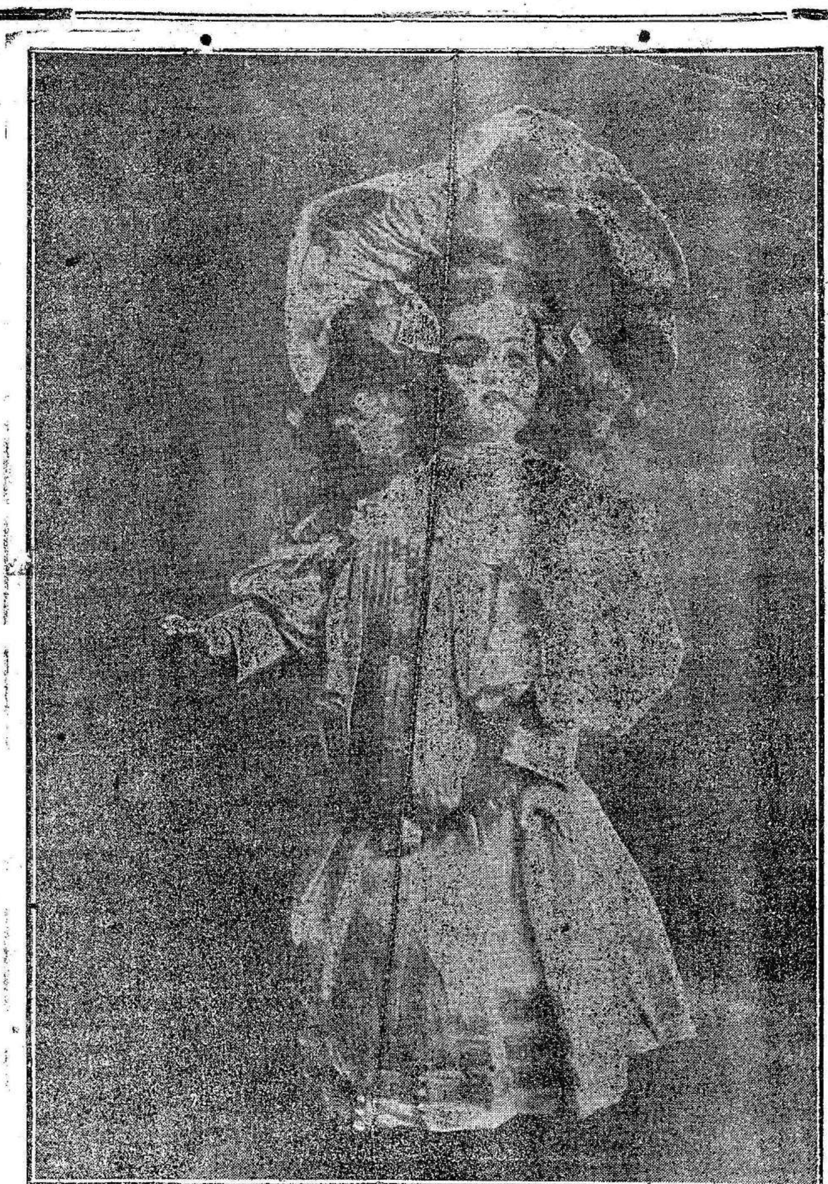
Segundo premio.—LA MUÑECA

—Los anunciantes tienen derecho a percibir tantos bonos de opción como fracciones de 2 pesetas satisfagan en la Administración de El Liberal. —Los suscriptores percibirán, desde Enero, tantos dos bonos como meses adelantados abonen, sin perjuicio de los que les correspondan por los meses corrientes. Las fotografías de los regalos se exhiben en Cartagena, en el Bazar Cartago, plaza San Francisco, 24. —Se concederá un bono de opción a los regalos de El Liberal a los niños, presentando ó remitiendo a la Administración de este periódico, 15 vales antes del día 8 de Enero de 1907. Los vales que nos remitan de fuera, pueden efectuarlo como «impresos», franqueándolos con 5 céntimos, ó con 30 cts., caso de certificarlos. La Administración de este periódico, no responde de los vales que no vengán en condiciones.