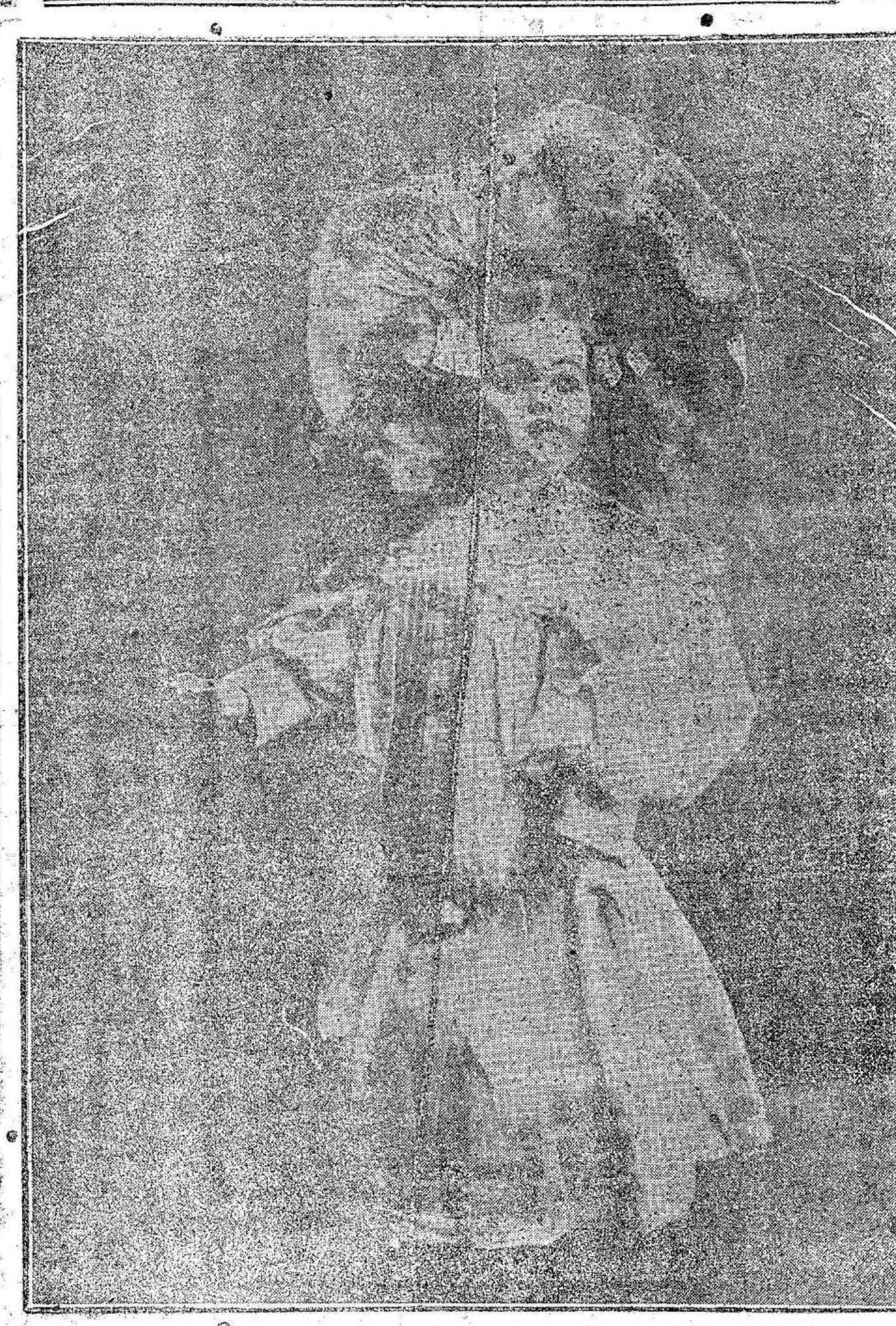
Segundo premio.—LA MUÑECA

—Los anunciantes tienen derecho a percibir tantos bonos de opción como fracciones de 2 pesetas satisfagan en la Administración de El Liberal . —Los suscriptores percibirán, desde Enero, tantos bonos como meses adelantados abonen, sin perjuicio de los que les correspondan por los meses corrientes. Las fotografías de los regalos se exhiben en Cartagena, en el Bazar Cartago, plaza San Francisco, 24. —Se concederá un bono de opción a los regalos de El Liberal a los niños, presentando ó remitiendo a la Administración de este periódico, 15 vales antes del día 8 de Enero de 1907. Tercer premio.—EL CLOWN Los vales que nos remitan de fuera, pueden efectuarse como «impresos», franquándolos con 5 céntimos, ó con 30 cts., caso de certificarlos. La Administración de este periódico, no responde de los vales que no vengan en condiciones.