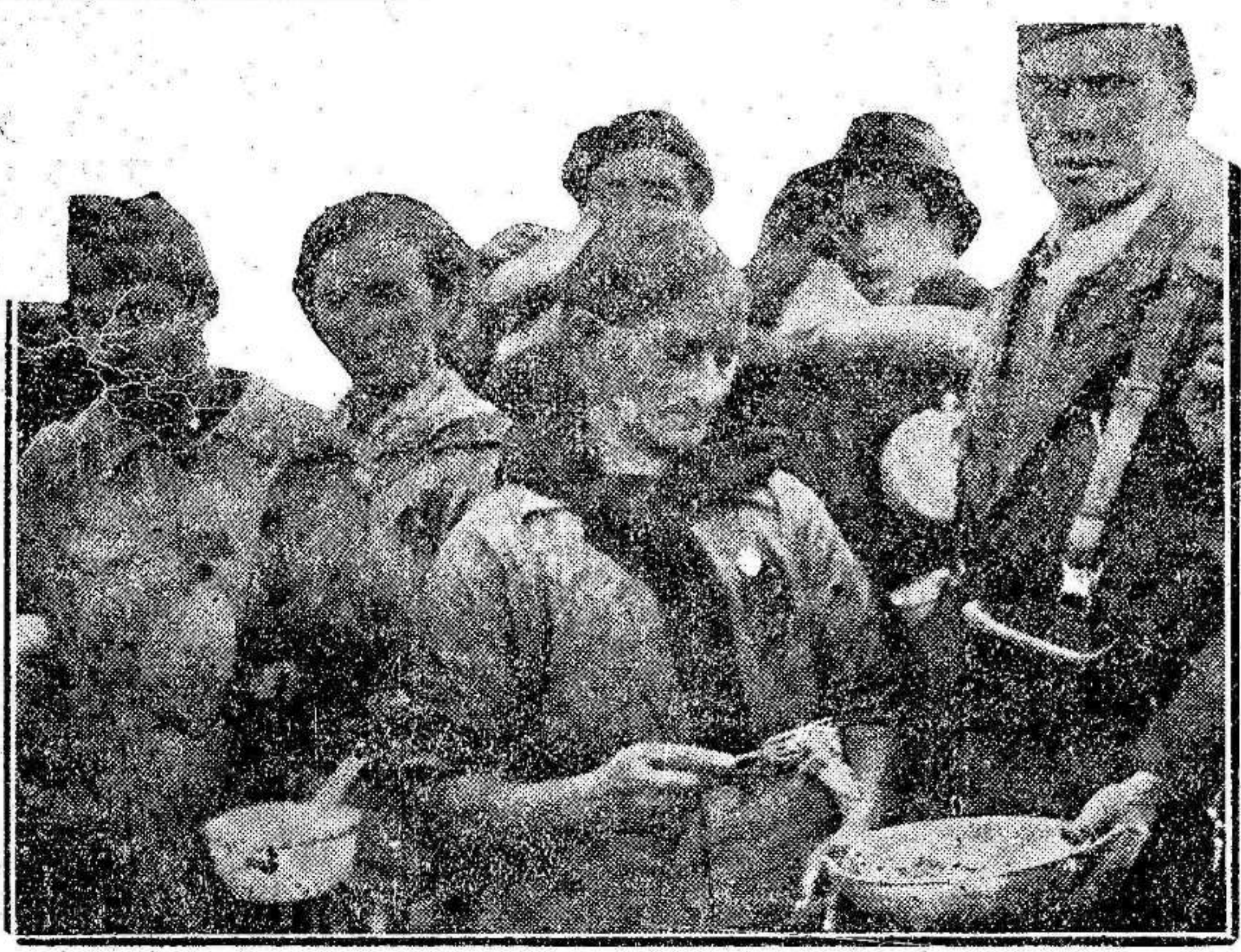
Las mujeres campesinas también defienden la causa de la libertad. He aquí a dos ciudadanas que en uno de los sectores de la Sierra se han encargado de condimentar el alimento de los bravos defensores de la República democrática. (Foto Díaz Casariego).

Hoy, a las seis de la mañana, ha sido cumplida la sentencia dictada por el Tribunal Popular, contra siete de los procesados por los sucesos de San Javier.