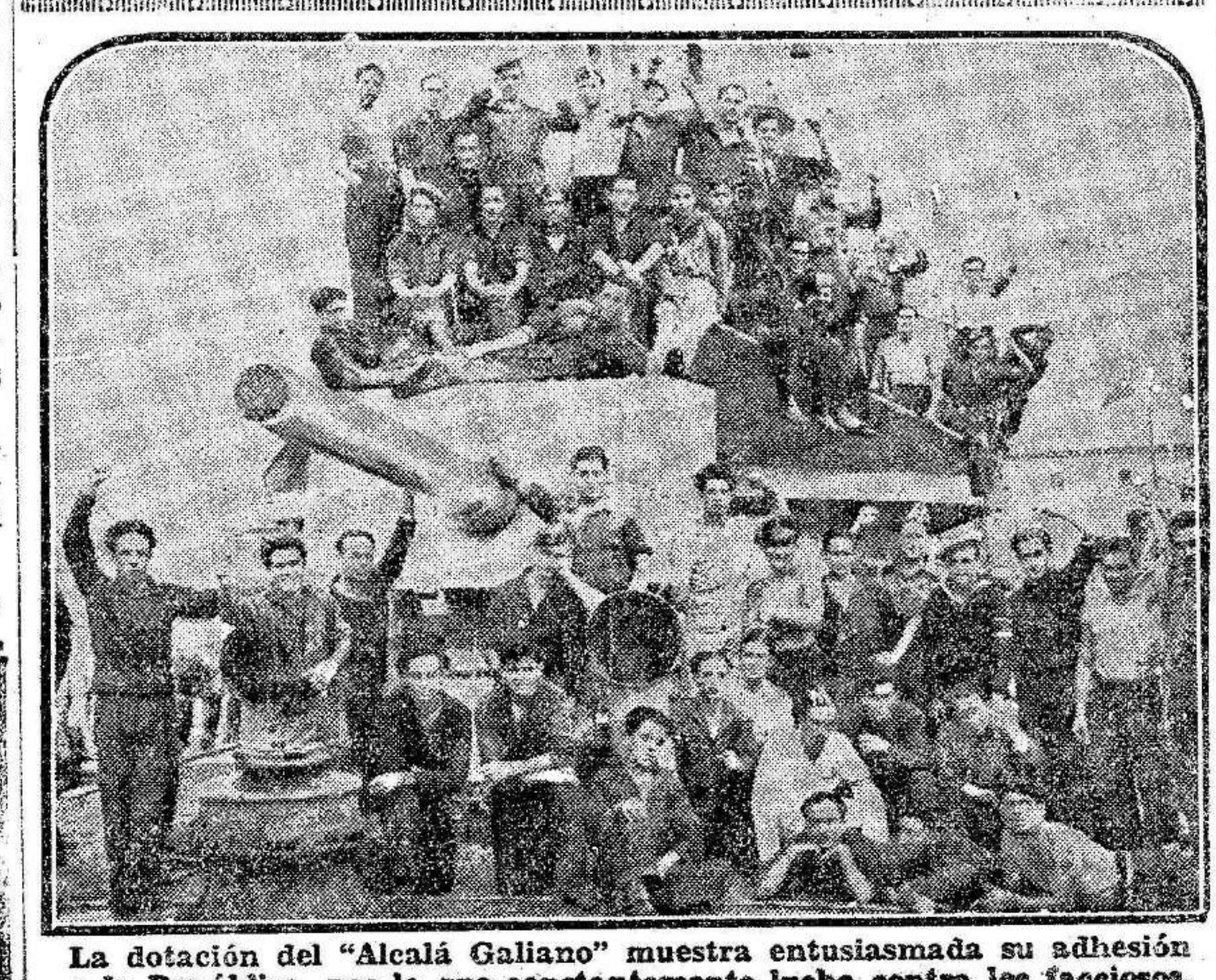
La dotación del "Alcalá Gallano" muestra entusiasmada su adhesión a la República, por la que constantemente lucha contra los facciosos.

EN CUMPLIMIENTO DE LO PRECEPTUADO EN RECIENTE DECRETO DEL GOBIERNO DE LA REPUBLICA, SOBRE SUPRESION DEL DESCANSO DOMINICAL DE PRENSA, EN ATENCION A LA IMPORTANCIA QUE SUPONE EN LOS ACTUALES MOMENTOS LA ININTERRUMPIDA INFORMACION A LA OPINION PUBLICA, TODOS LOS LUNES SE PUBLICARA EL LIBERAL