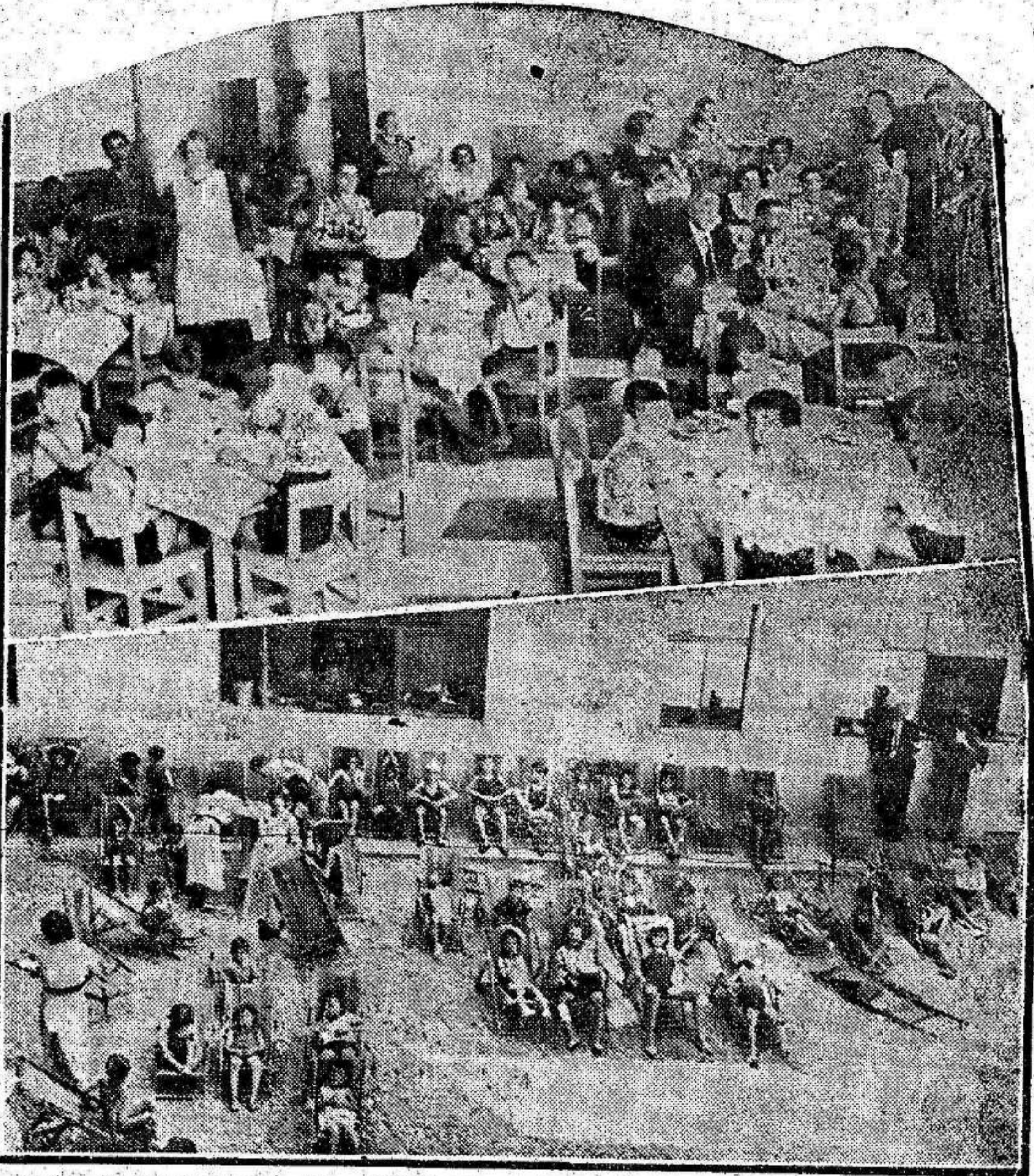
Hijos y huérfanos de milicianos que reciben custodia e instrucción en el grupo escolar municipal López Rumayor, de Madrid.