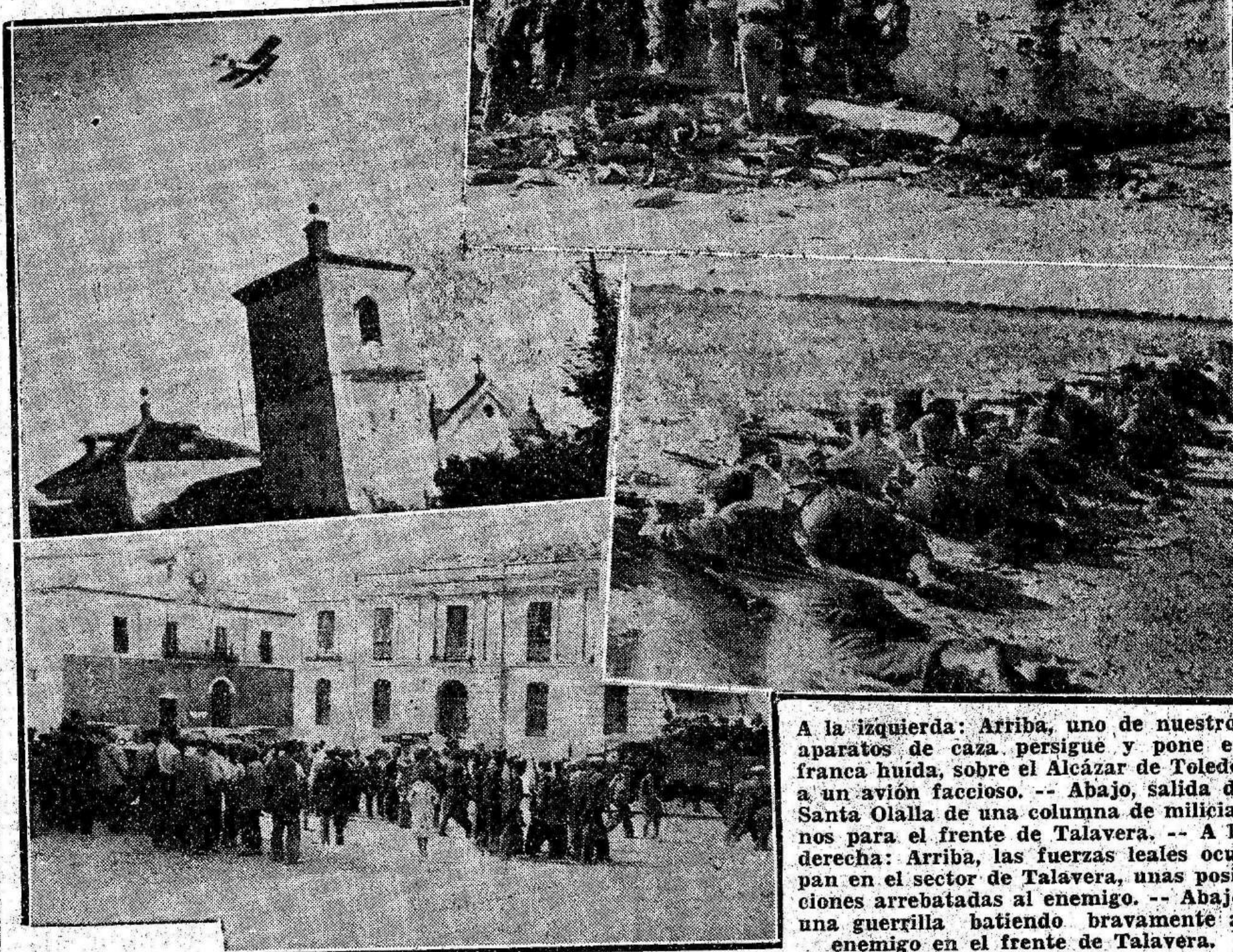
A la izquierda: Arriba, uno de nuestros aparatos de caza, persigue y pone en franca huida, sobre el Alcazar de Toledo, a un avión faccioso. -- Abajo, salida de Santa Olalla de una columna de milicianos para el frente de Talavera. -- A la derecha: Arriba, las fuerzas leales ocupan el sector de Talavera, unas posiciones arrebatadas al enemigo. -- Abajo, una guerrilla batiendo bravamente al enemigo en el frente de Talavera.