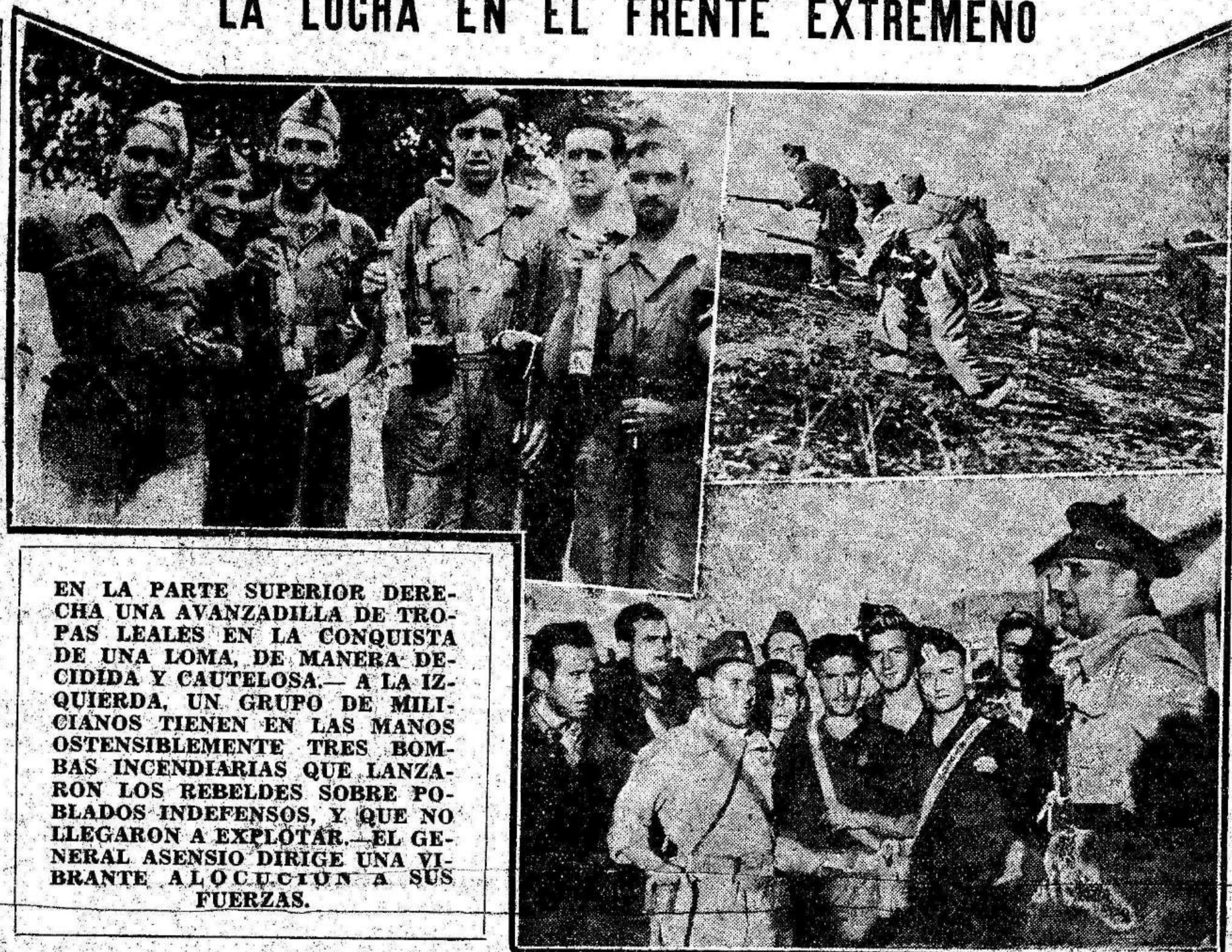
EN LA PARTE SUPERIOR DERECHA UNA AVANZADILLA DE TROPAS LEALES EN LA CONQUISTA DE UNA LOMA, DE MANERA DECIDIDA Y CAUTELOSA.—A LA IZQUIERDA, UN GRUPO DE MILICIANOS TIENEN EN LAS MANOS OSTENSIBLEMENTE TRES BOMBAS INCENDIARIAS QUE LANZARON LOS REBELDES SOBRE POBLADOS INDEFENSOS, Y QUE NO LLEGARON A EXPLOTAR.—EL GENERAL ASENSI DIRIGE UNA VIBRANTE ALOCUCION A SUS FUERZAS.