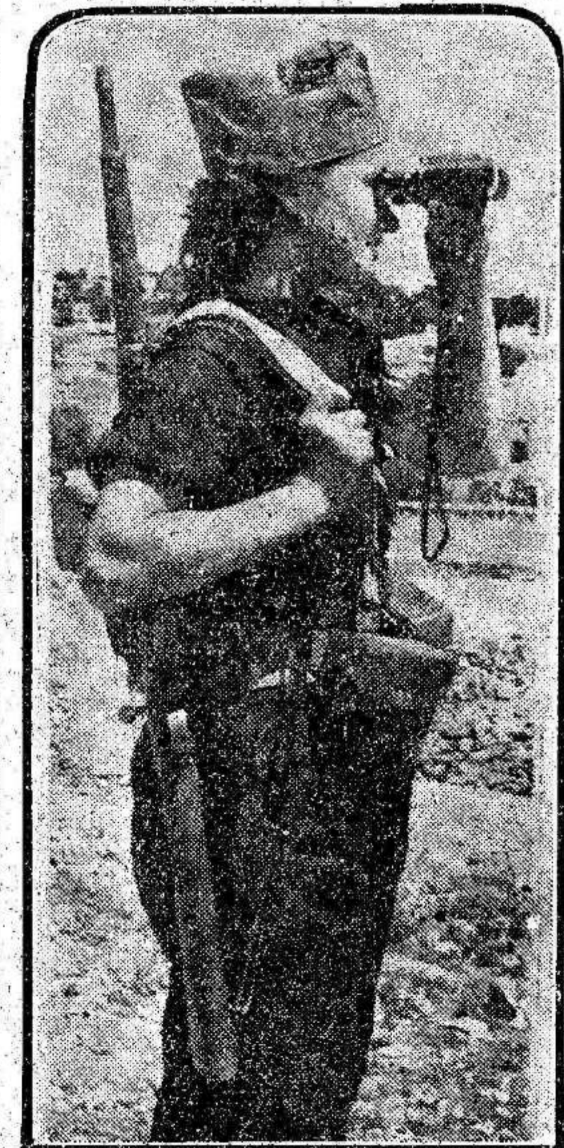
Una miliciana, en el puesto avanzado de la Sierra, vigila con los prismáticos los movimientos de los rebeldes.

PALMA DE MALLORCA VA A RENDIRSE Una avioneta enemiga destrozada por nuestros hidroaviones Nuestras fuerzas van a desembarcar en la isla de Mallorca