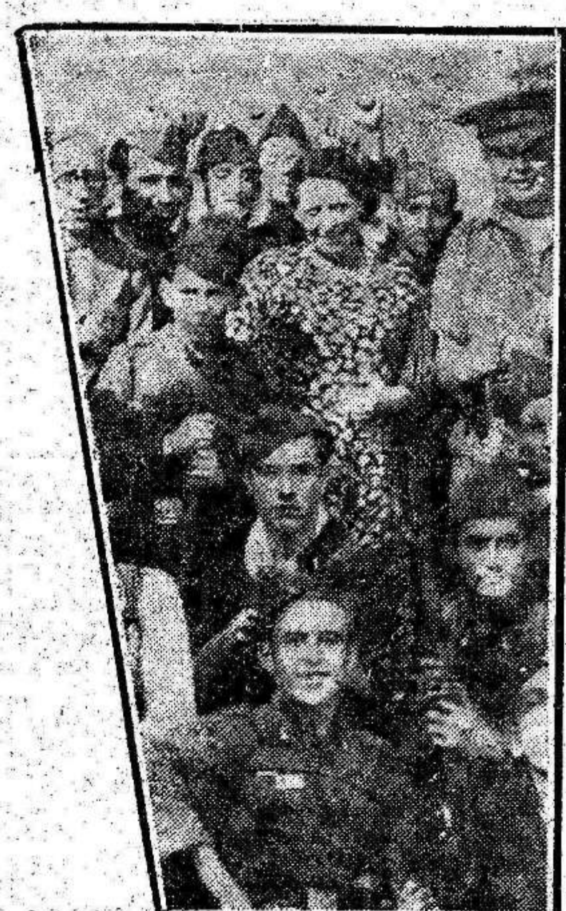
La diputada socialista Margarita Nelken fraternizando con los soldados y milicianos que luchan por la República en la Sierra.

so que todos aquellos que tengan que entonar el "mea culpa" sepan que no se les puede consentir, porque llevamos a la lucha a nuestros hijos, y nuestros hijos tendrán derecho el día de mañana a pedirnos cuentas sobre esta leñidad. Uno de los casos que menos habremos de perdonar al fascismo que ensangrienta España, es su cobardía al atrincherarse en nuestras reliquias de arte. No les hemos de perdonar tampoco el que las mujeres, las madres, que no hemos querido nunca ver en las manos de nuestros hijos ni aun por