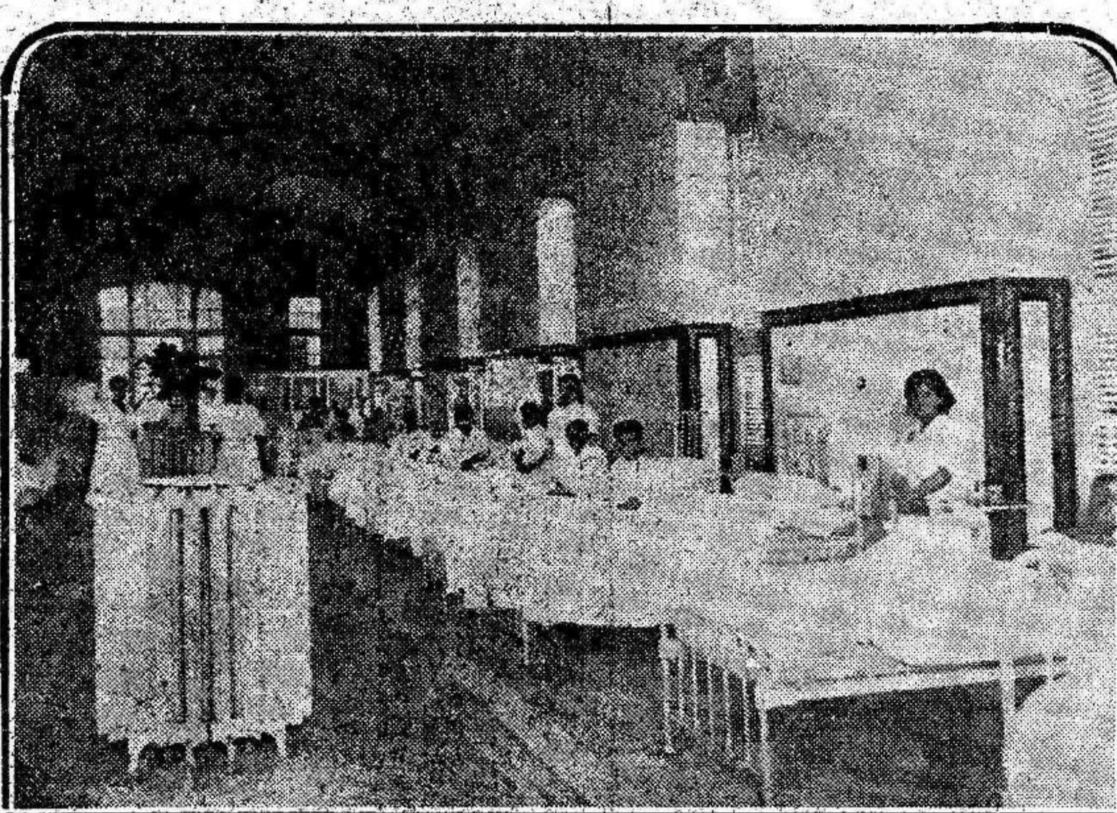
Una de las salas del hospital de sangre que en Madrid tienen las milicias del S. R. I.