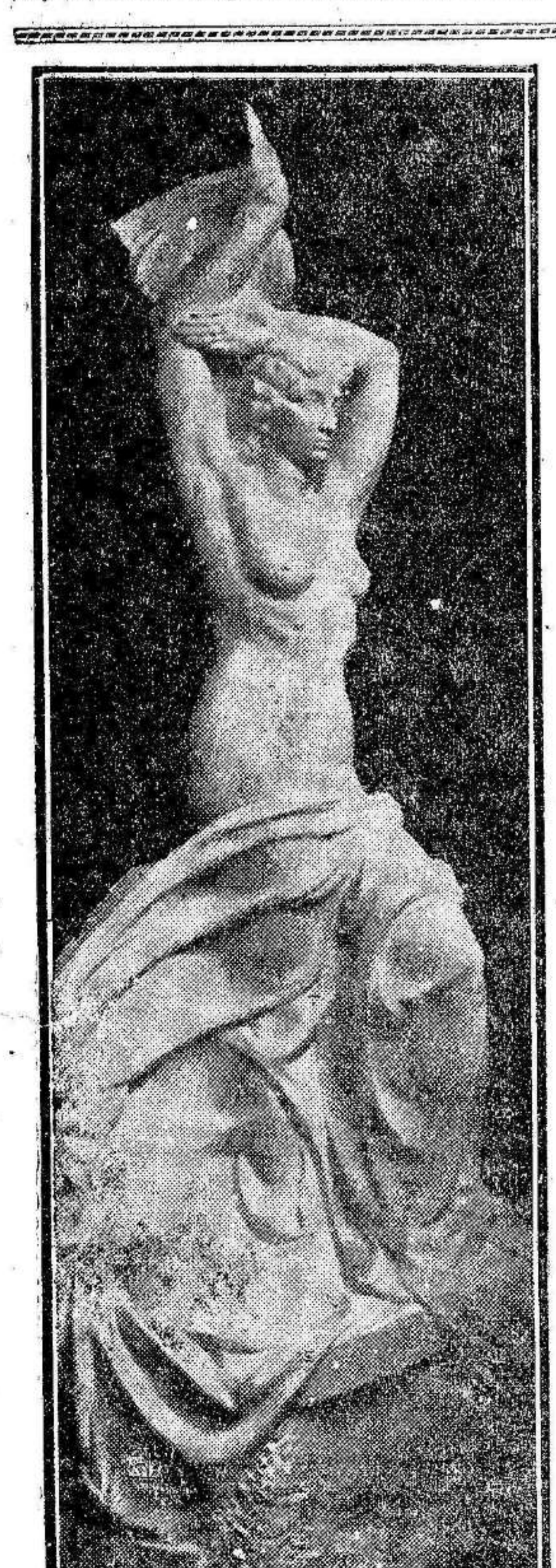
EXPOSICION NACIONAL.—"Me-terraneo", por Ignacio Pinazo.

XAUEN Como una gamuza, la brujía el clima. Sobre su desnudez—repta la va casi desnuda—repta el sol como un lagarto. Su carne tiene elasticidad: le anca de yegua y hay en ella la misma energía en potencia. El peso de relincha y piafa al estirar sobre su torso la planta de la moquita. Los nopales alucinados ven pasar y los ojos se les saltan; se les erizan de espaldas. La moquita es la samaritana del aduar. El cae lejos; a una legua de Xauen. Hay que atravesar un erial, diminuto por una niebla de mosquitos. Hay algunos charcos de aguas purísimas, doradas y verdes, donde zumbaban las joyas vivas de fulgidos insectos. La tierra arde y late, como carne seca y negra. Un moro tejedor, mordido de rojos deseos, sigue a la moquita aguadora. La moquita porta el cántaro graciosamente apoyado sobre el hombro; se derrama el líquido por las espaldas desnudas, que beben salaces el rocío africano. La monda llanura se estaca, como un felino. Xauen crepita... Tienen categoría de héroes de novela—quizás los símbolos de un poema del África—la moquita aguadora y el moro tejedor. Quizás arderían ser el eje de una historia bravia y roja, acuchillada de sol sobre un fondo de nopales en fiebre. Su valor de insinuación y su esencia de poesía quedarían anulados o empobrecidos si es rehelamos la historia—hasta el fin—de los teos sobre que... M. Angel COLMAN