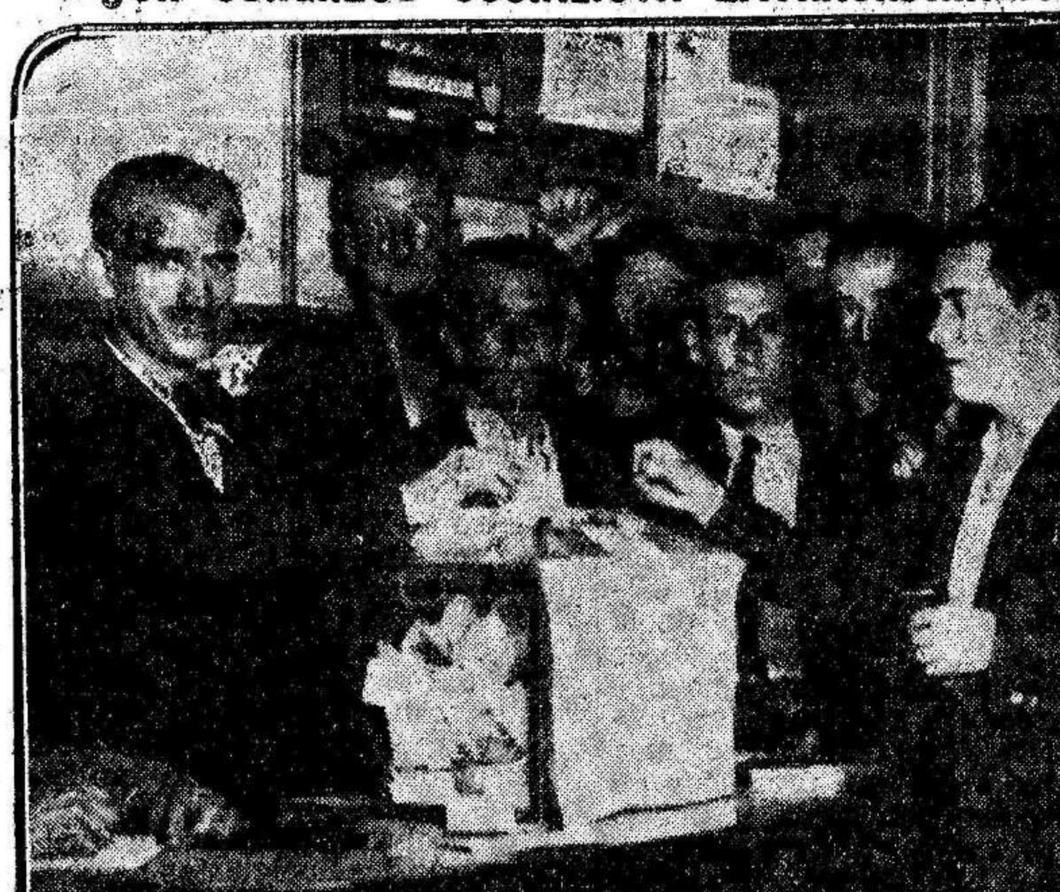
Los afiliados a la Agrupación Socialista Madrileña, votando en la Casa del Pueblo, si debe celebrarse o no un Congreso extraordinario del partido.