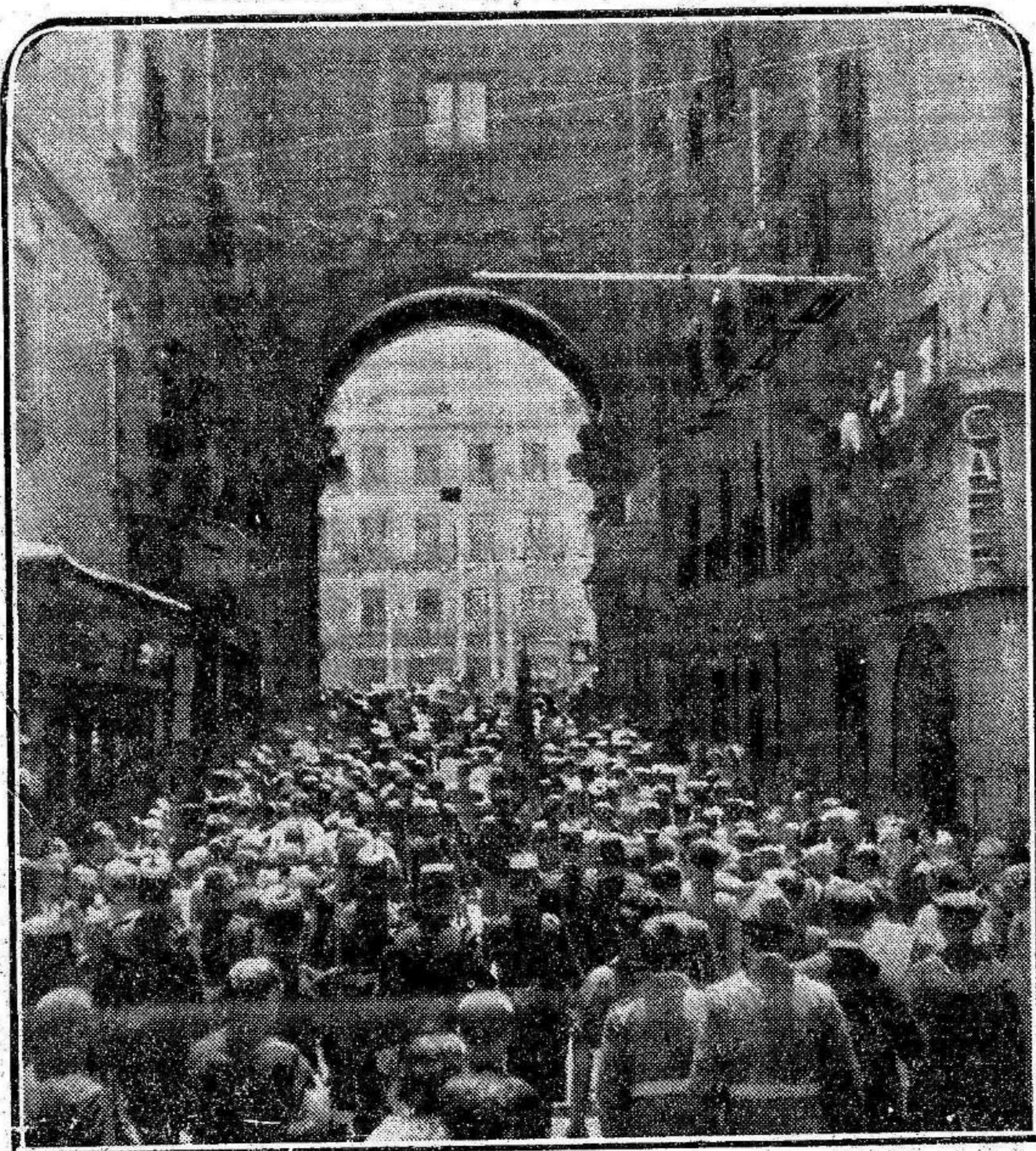
Desfile de los milicianos nacionales bajo el Arco del Triunfo en la Plaza Mayor de Madrid, con motivo del aniversario de esta fecha histórica.