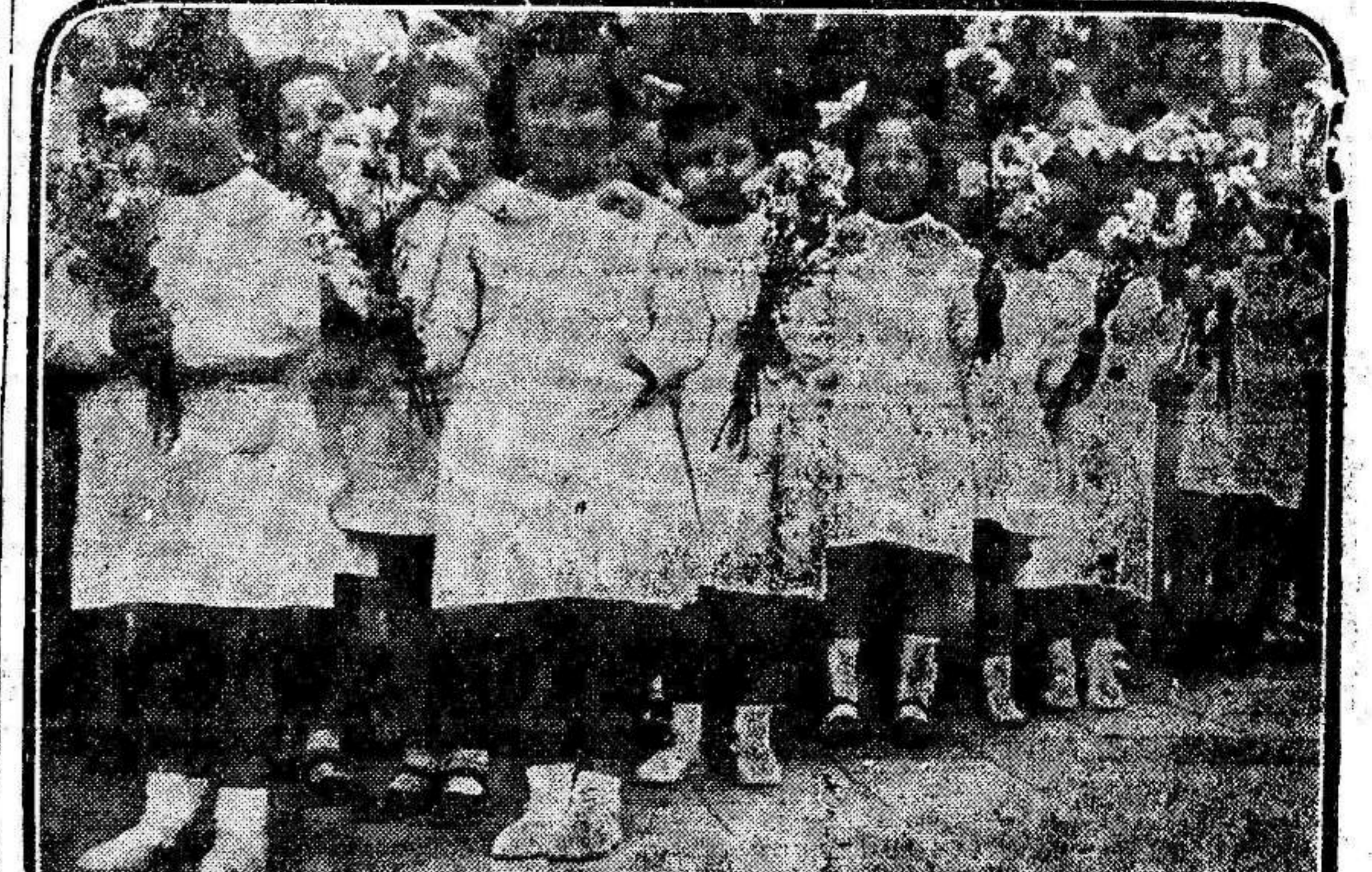
En compañía de los profesores, los niños de las escuelas nacionales visitan las Ferias del Libro y de las Flores, en el paseo madrileño de Recoletos.

Reciban nuestra enhorabuena los noveles bachilleres.