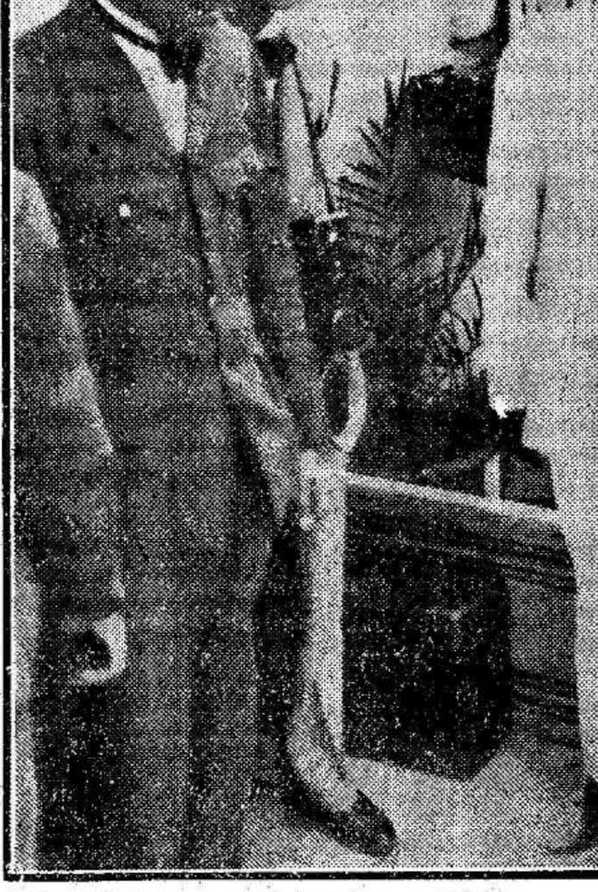
El príncipe heredero de Etiopía, conversando con los periodistas durante su estancia en Gibraltar.