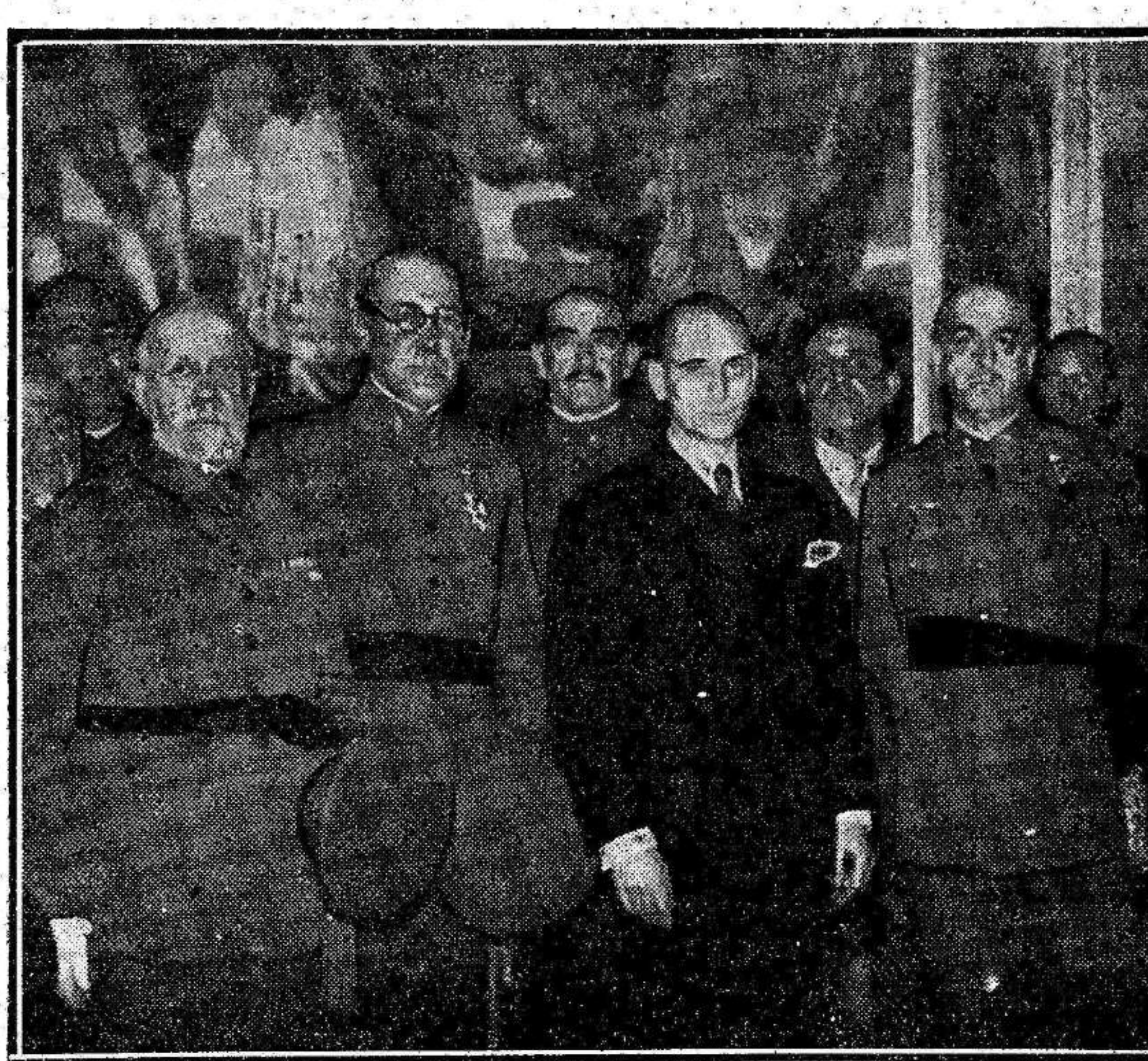
Don Santiago Casares Quiroga, en el momento de presentarse ante él, como ministro de la Guerra, los jefes y oficiales de la guarnición de Madrid.

El acto terminó en medio del mayor entusiasmo, cantándose "La Internacional".