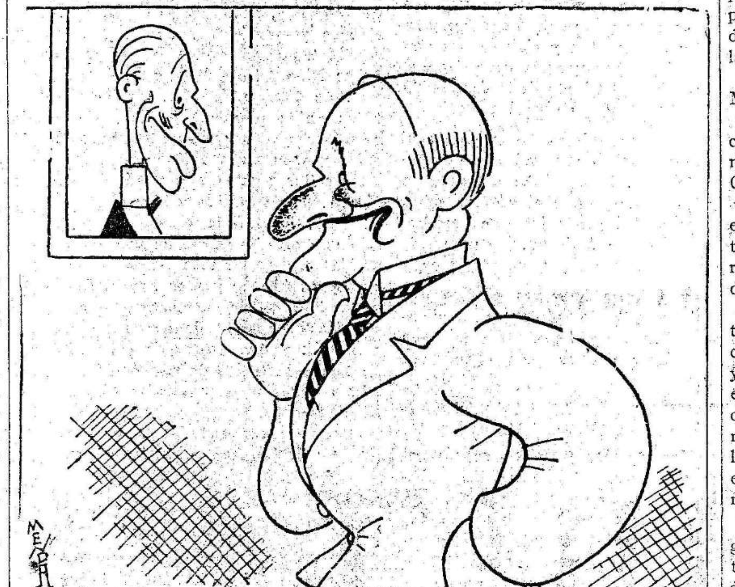
—Si se me llega a ocurrir a mí esto del centro, no hay 12 de abril!