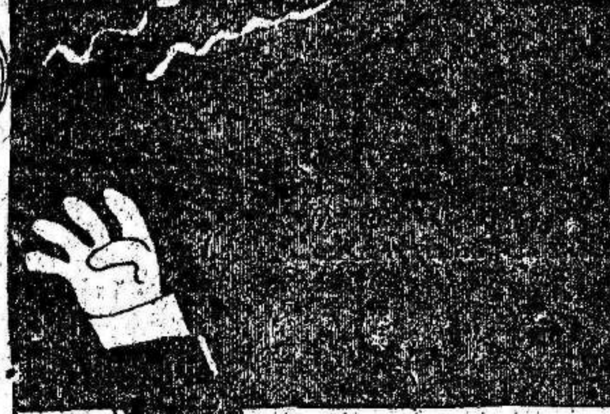
Si consiguiera asirme a ese clavito... aunque sea masón!