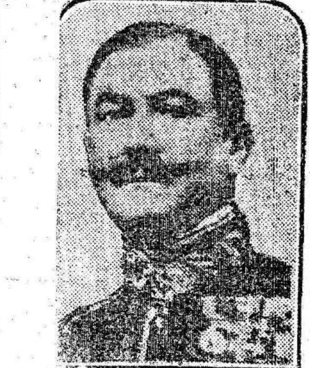
El general Berenguer, el entonces ministro de la Guerra, que parece haber declarado en pleno Consejo de Ministros que no contaba con el Ejército