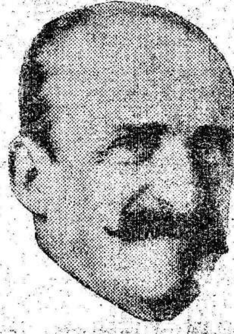
Don Alvaro de Figueroa, el conde travieso que encontró la fórmula para la transmisión de poderes

Termina diciendo que una vez pasadas las elecciones explicará cumplidamente lo ocurrido.