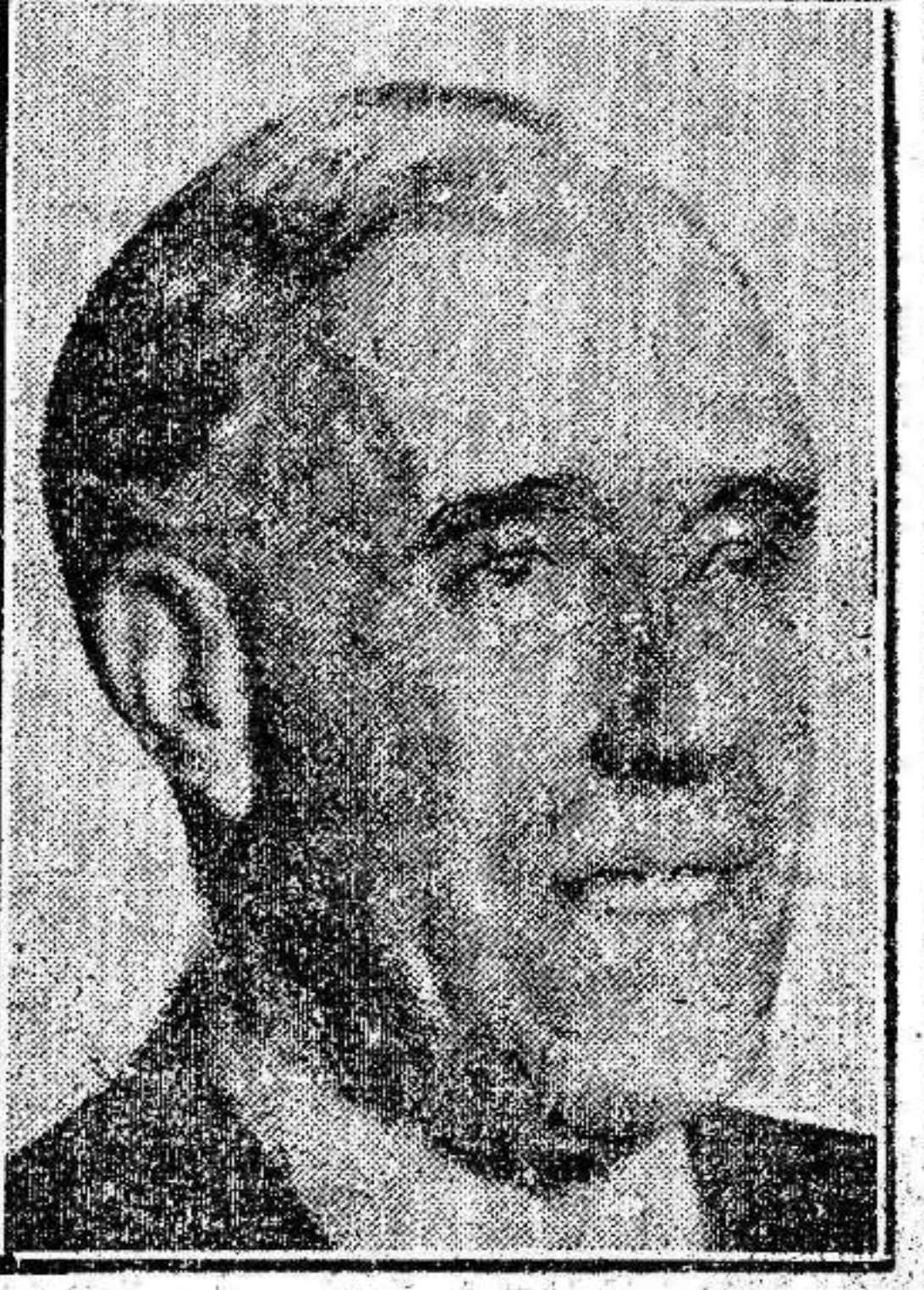
Don Julián Besteiro, ex presidente de las Cortes Constituyentes, designado como representante socialista en el Bloque Popular de Izquierdas que ha de luchar por Madrid