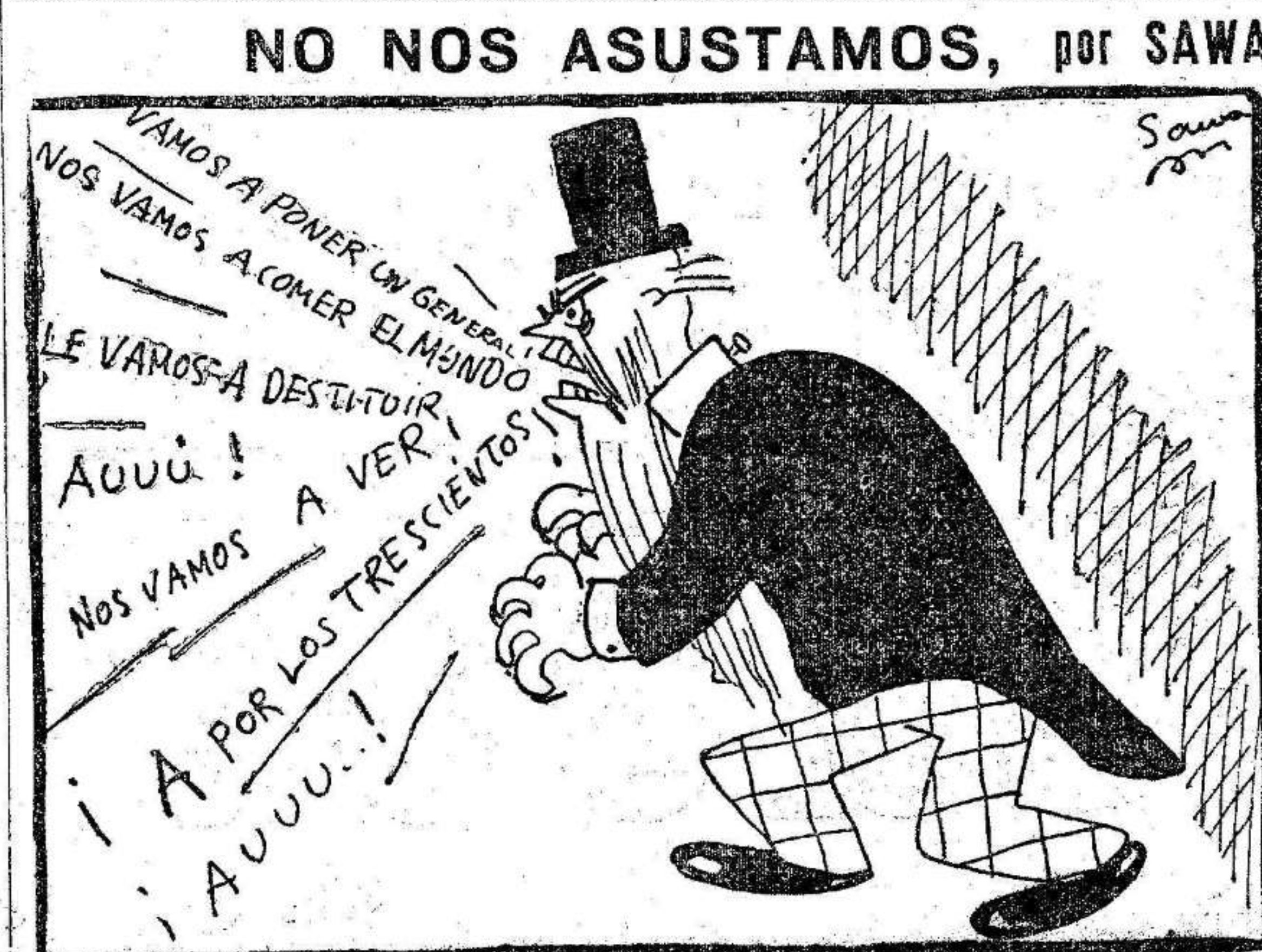
REFRANERO ESPAÑOL:—"Perro que aulla no muere."

NUESTRA INFORMACION TELEGRÁFICA ESTA RECIBIDA POR TELETIPOS INSTALADOS EN NUESTRA REDACCION