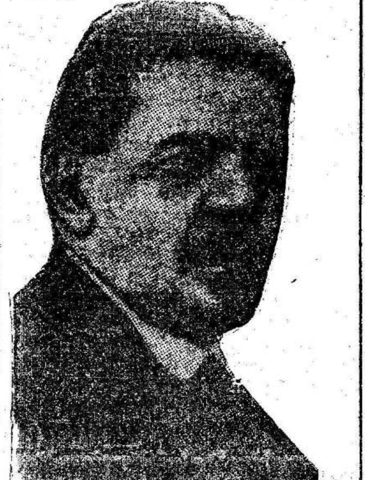
Mr. Herriot, el jefe radical-socialista francés, cuya política internacionalista de franca adhesión a la Sociedad de Naciones, ha sido al fin acogida por el Gobierno.

mental y dice: "Se habla de humanizar los decretos leyes. Sé los esfuerzos que se han hecho en este sentido y los que se han de hacer. Estaré de acuerdo con el ministro de Hacienda para hacer todo lo posible."