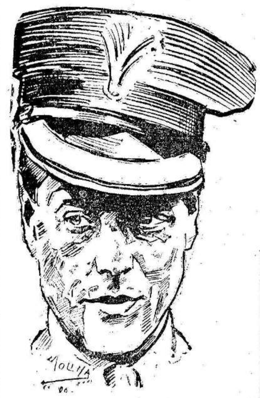
EDUARDO VIII

LONDRES.—Un oficial del Cuerpo de Ambulancia de San Juan ha declarado a la United Press que los miembros de este Cuerpo habían asistido a 7.000 personas accidentadas a lo largo de la ruta seguida por el fúnebre cortejo.