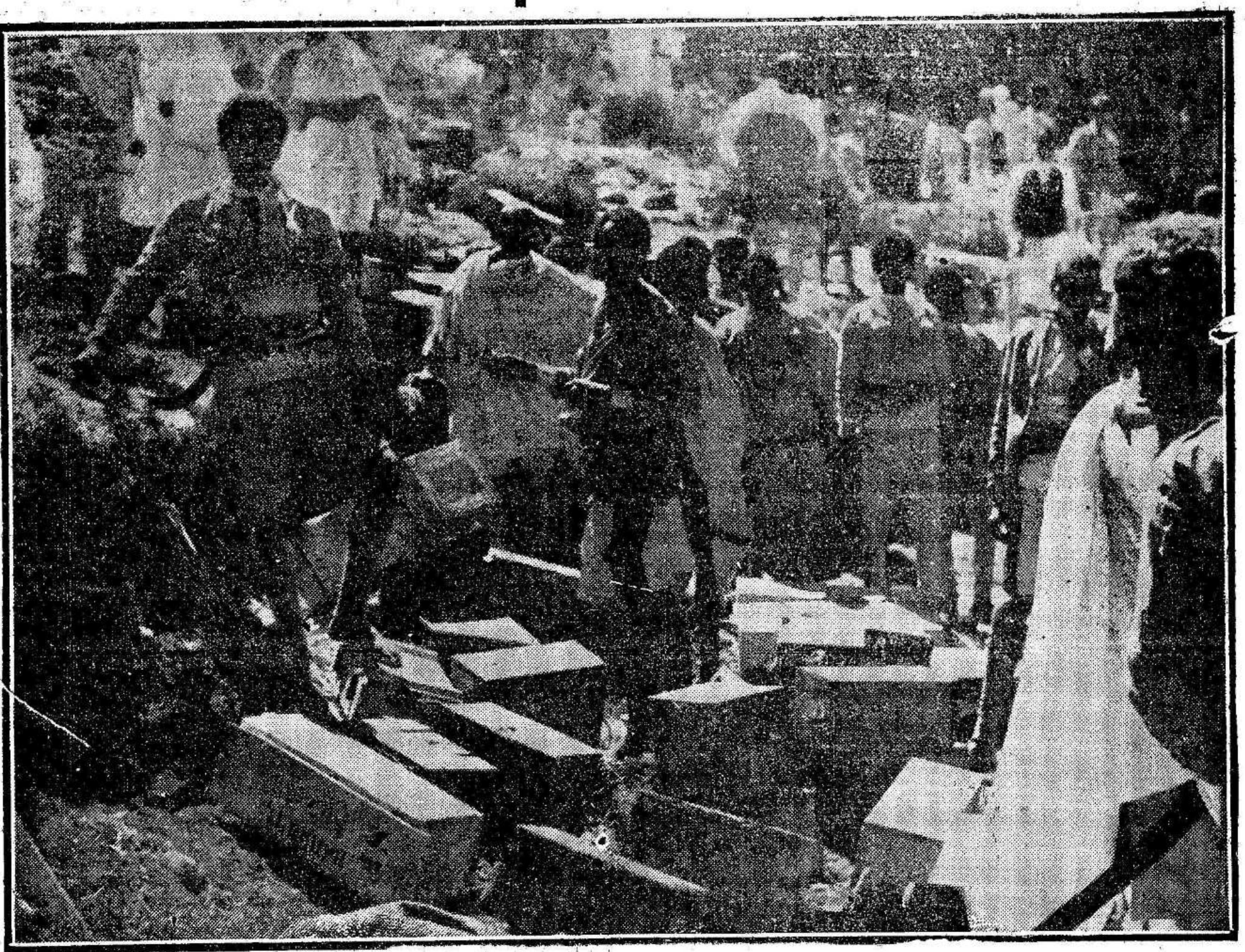
Transporte de municiones en Dessie