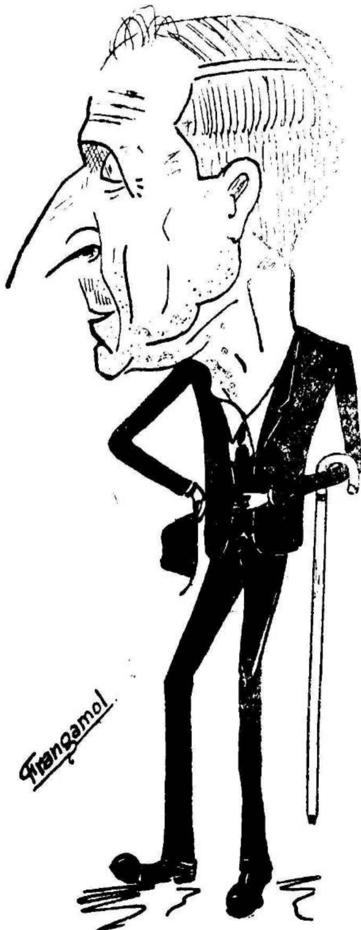
UN SEÑOR JUEZ DE CARTÓN, QUE NO LO TUERCE UN CICLÓN