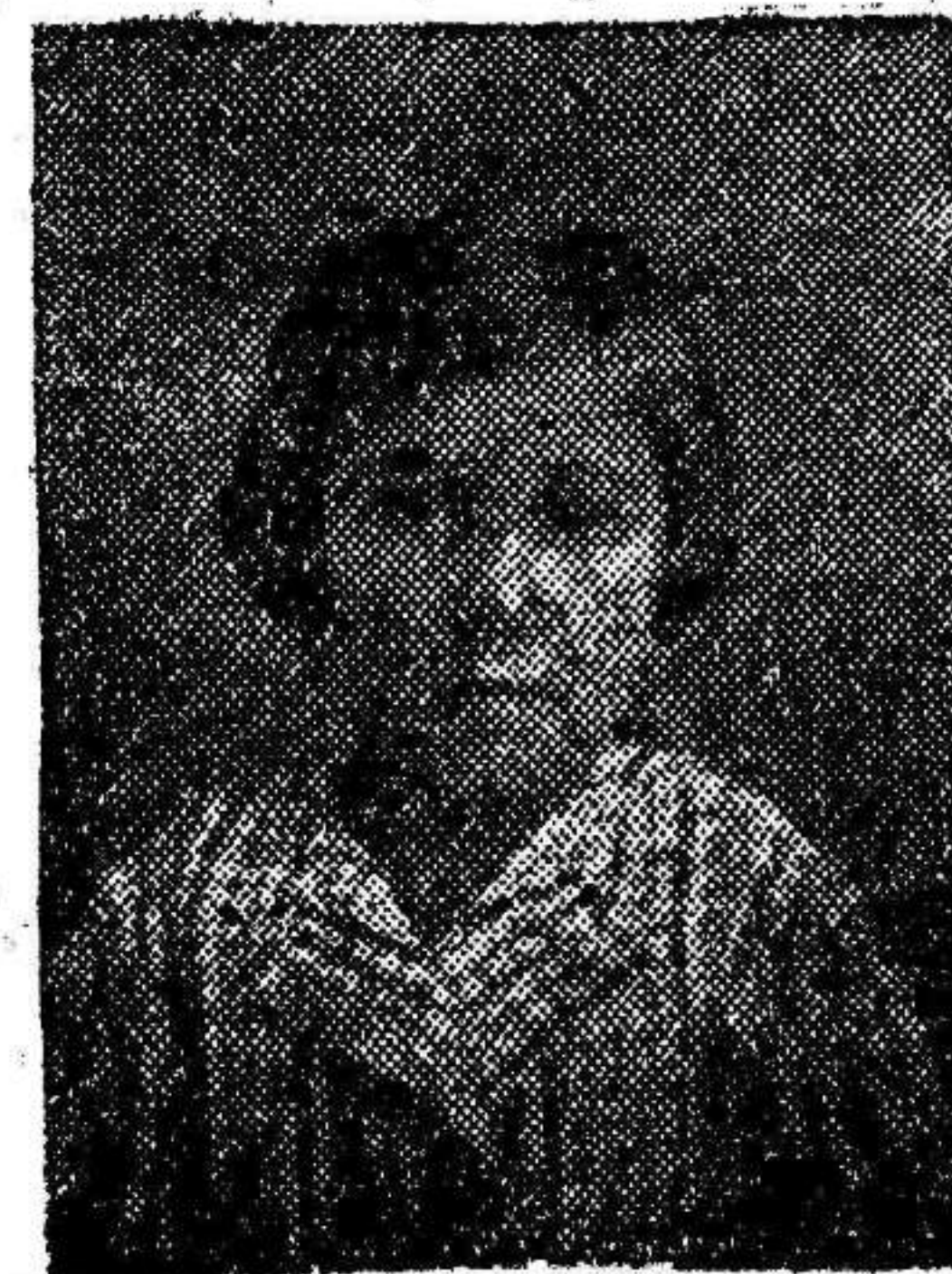
CUQUI 8 años

peña, en el periódico, y muchos amigos que pueden ayudarlos. O esto o más fácil desenvolvemos sin mí.