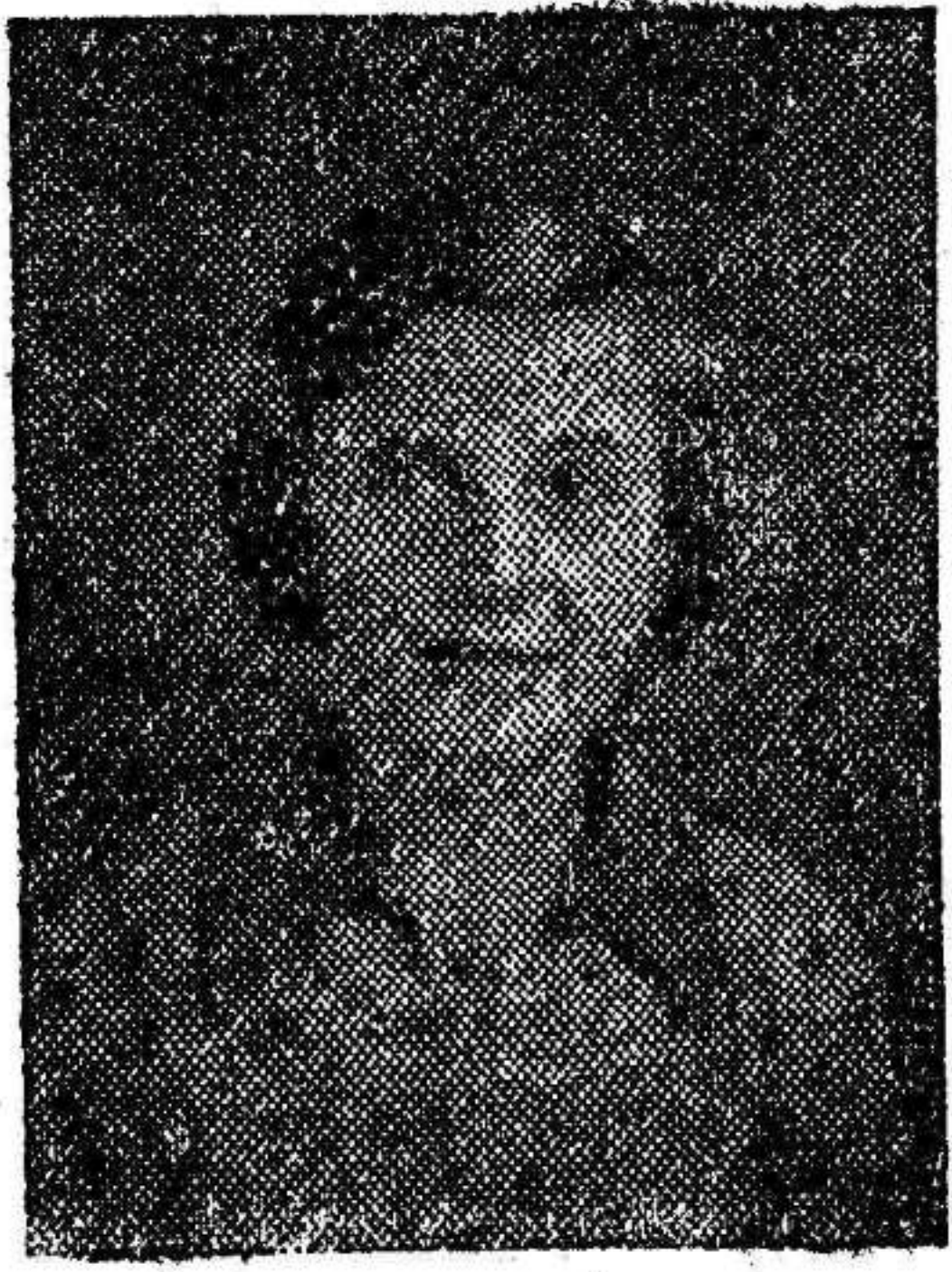
LOLIN 10 años