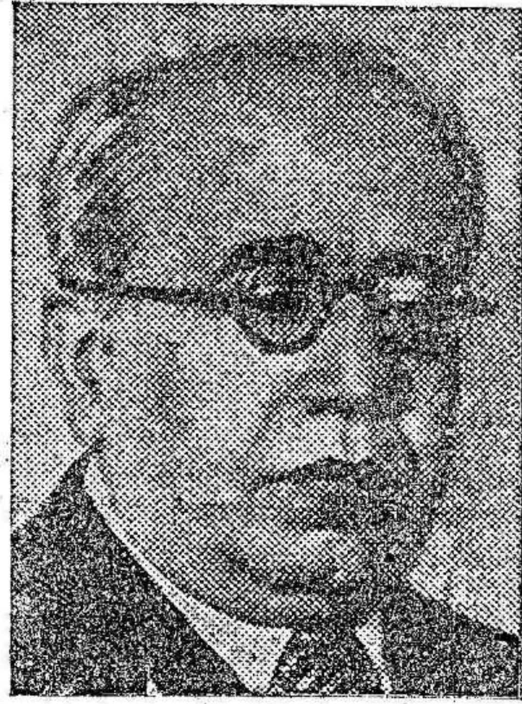
Nuestro ilustre Jefe del Estado, cuya lección registramos hoy