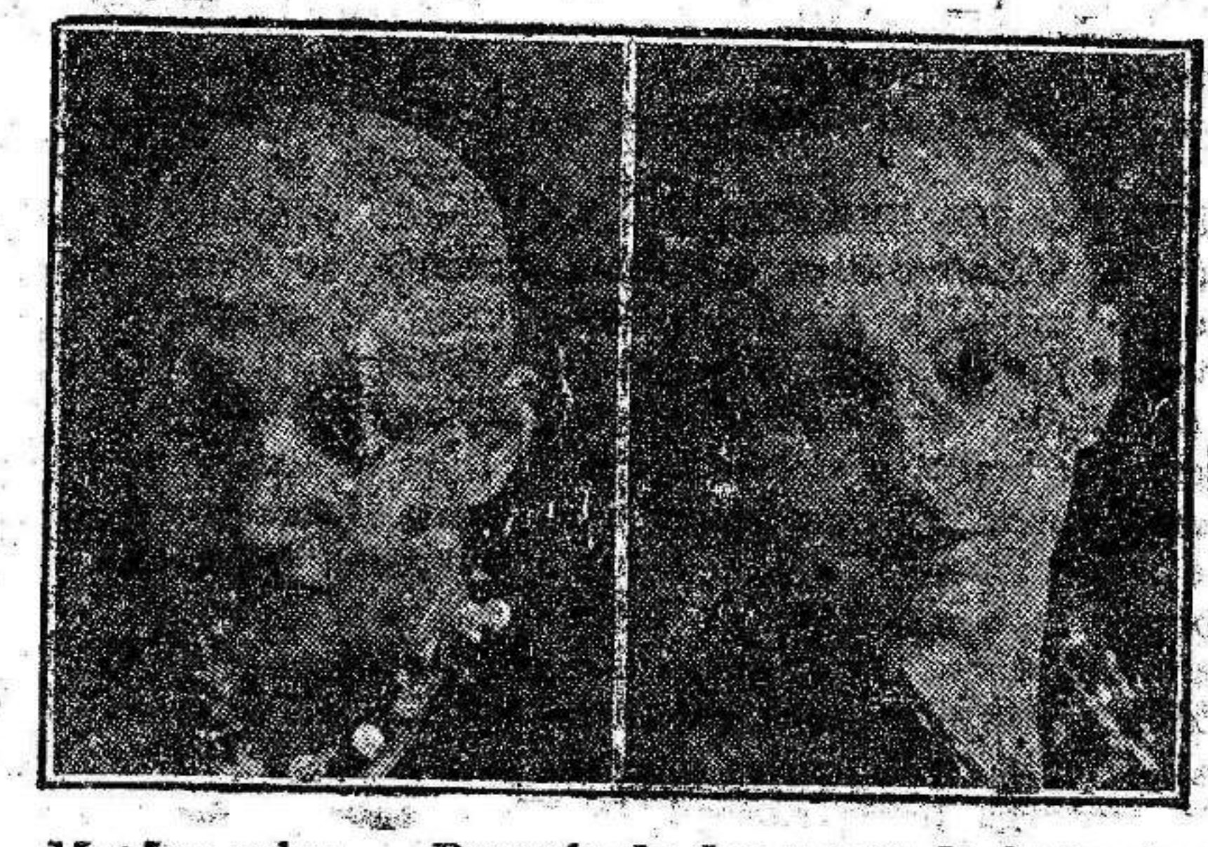
15 años calva. Después de dos meses de tratamiento

EL REJUVENECIMIENTO DE LA FISONOMIA HUMANA. ¡NO MAS CALVOS! HECHOS Y NO PALABRAS. ¡EL INVENTO MAS SENSACIONAL DE LA EPOCA!