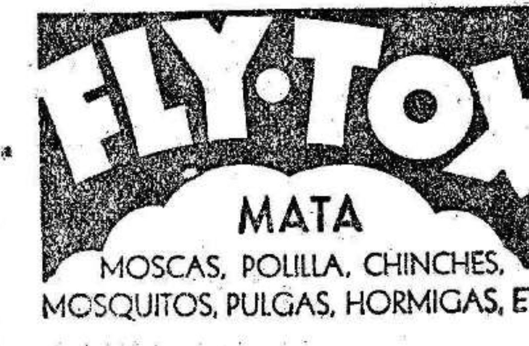
MOSCAS, POLILLA, CHINCHES, MOSQUITOS, PULGAS, HORMIGAS, ETC

Los vecinos de la barriada, al darse cuenta de lo que sucedía, se mostraron en actitud hostil contra los guardias, los cuales tuvieron que