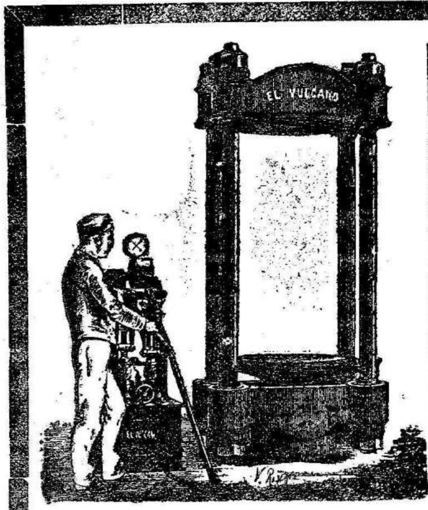
OFICINAS: P. PELOTA, 6. TALLERES: C. ORILLA DEL RIO, 16.