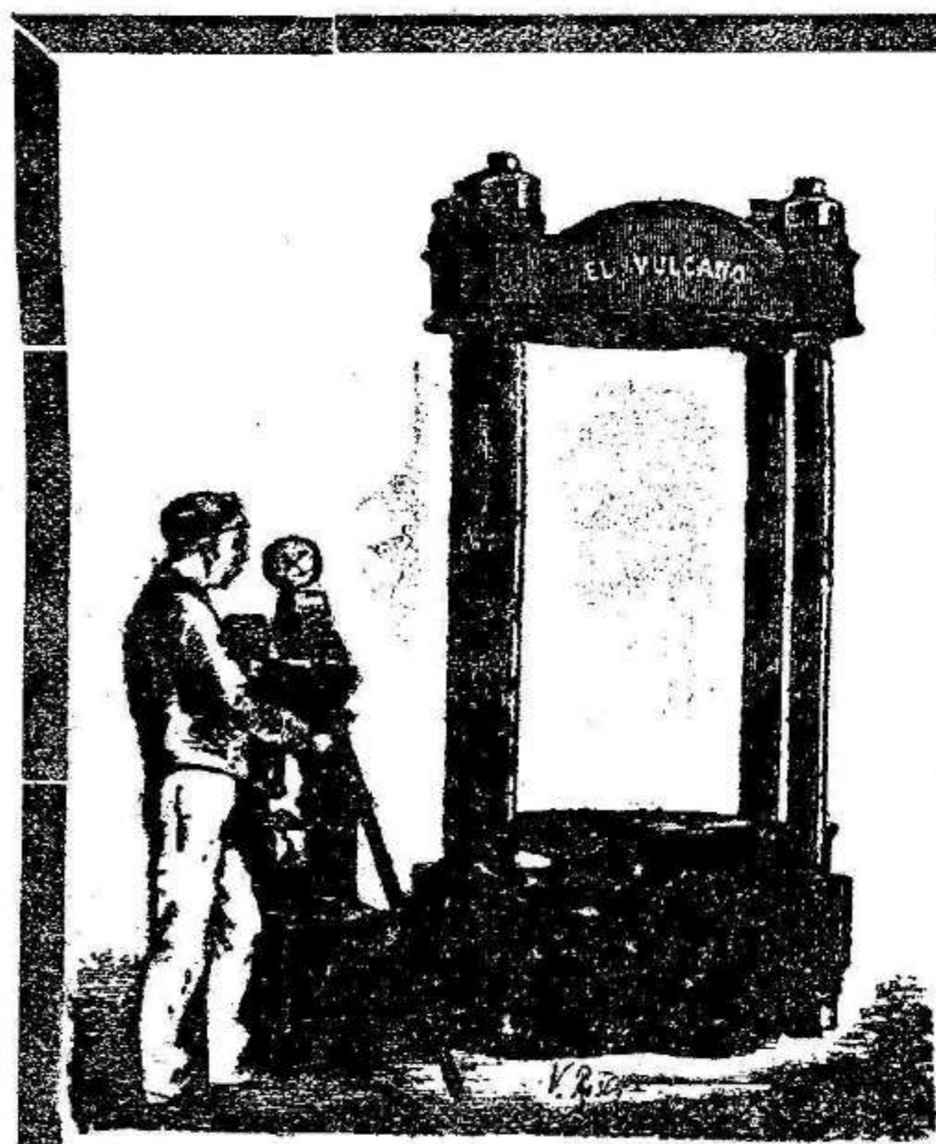
Oficinas: P. Pelota, 6. Talleres: C Orilla del Rio, 16

Horas de clase, de 7 á 8 y de 8 á 9 de la noche. 8—4