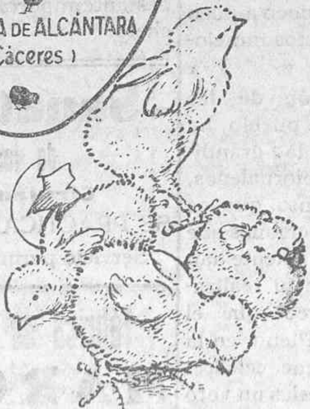
Polluelos recién nacidos