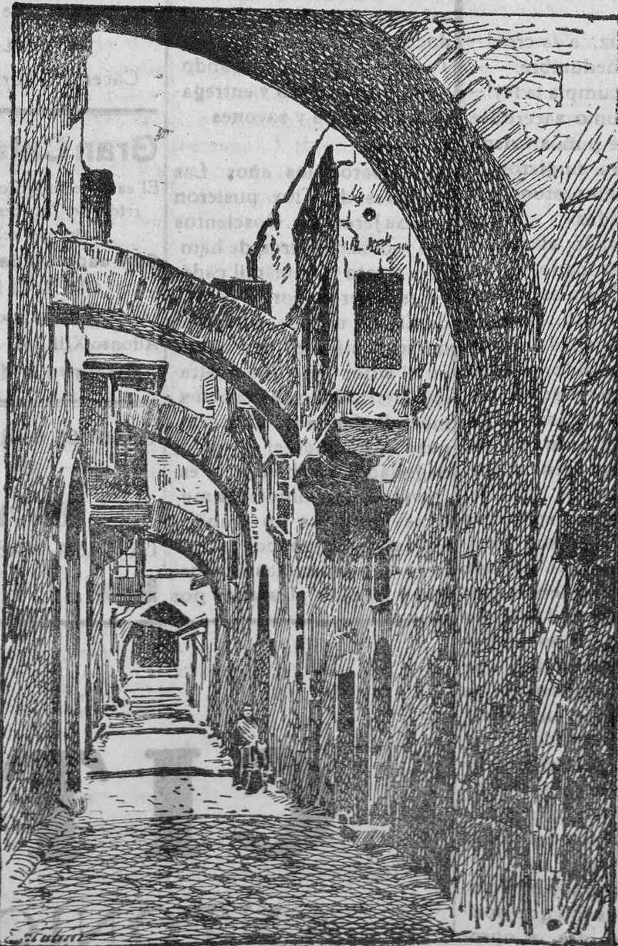
CALLE DE LA AMARGURA

No hay oración más sincera ni sentida, que la que nadie oye.