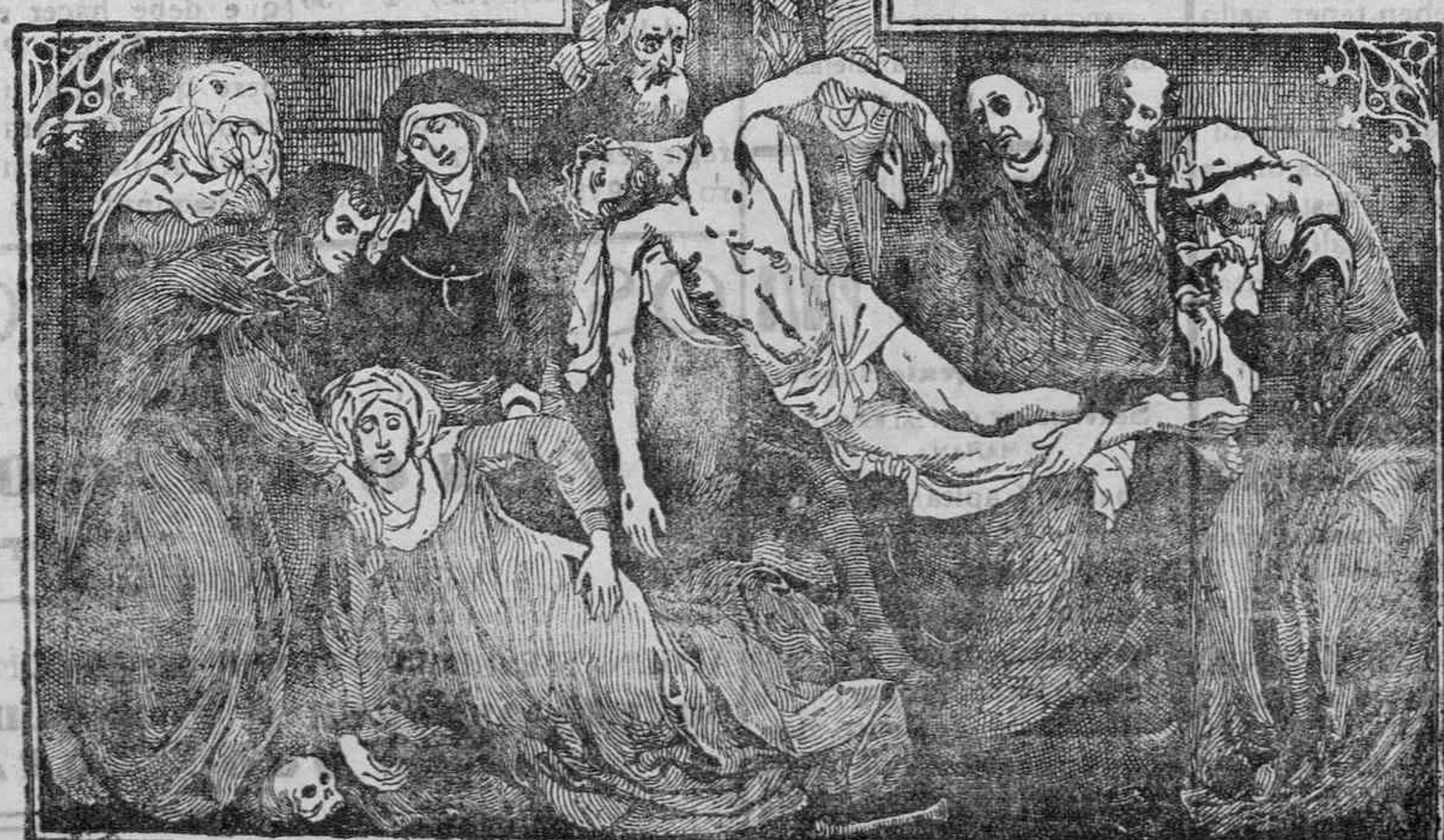
Famoso cuadro del pintor Vander-Weiden, que se conserva en una de las Salas Capitulares del Monasterio de El Escorial