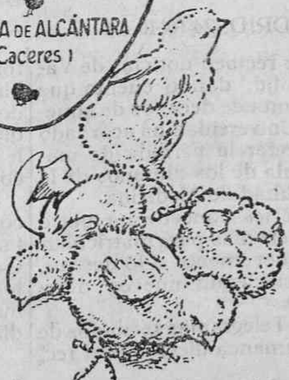
Polluelos recién nacidos