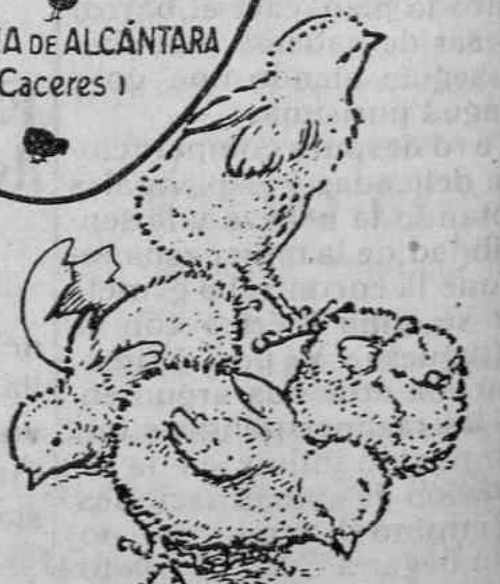
Polluelos recién nacidos.