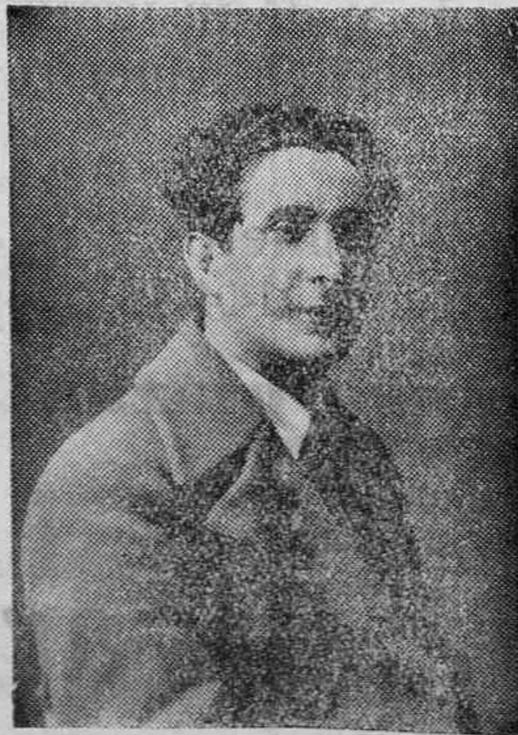
D. ANTONIO NOBRE

Ilustre conferenciante y periodista portugués, que el próximo lunes dará una velada en nuestro Gran Teatro