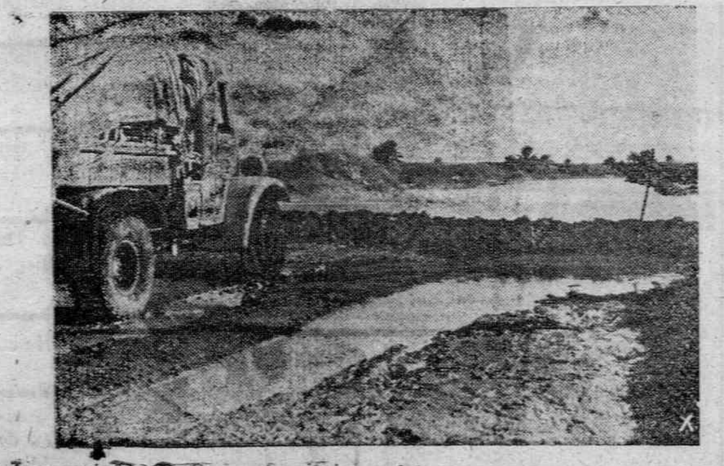
Las grandes nevadas suelen dejar así las carreteras y caminos en la frontera libico-tunecina, siendo durante unos días completamente intrahabiles.