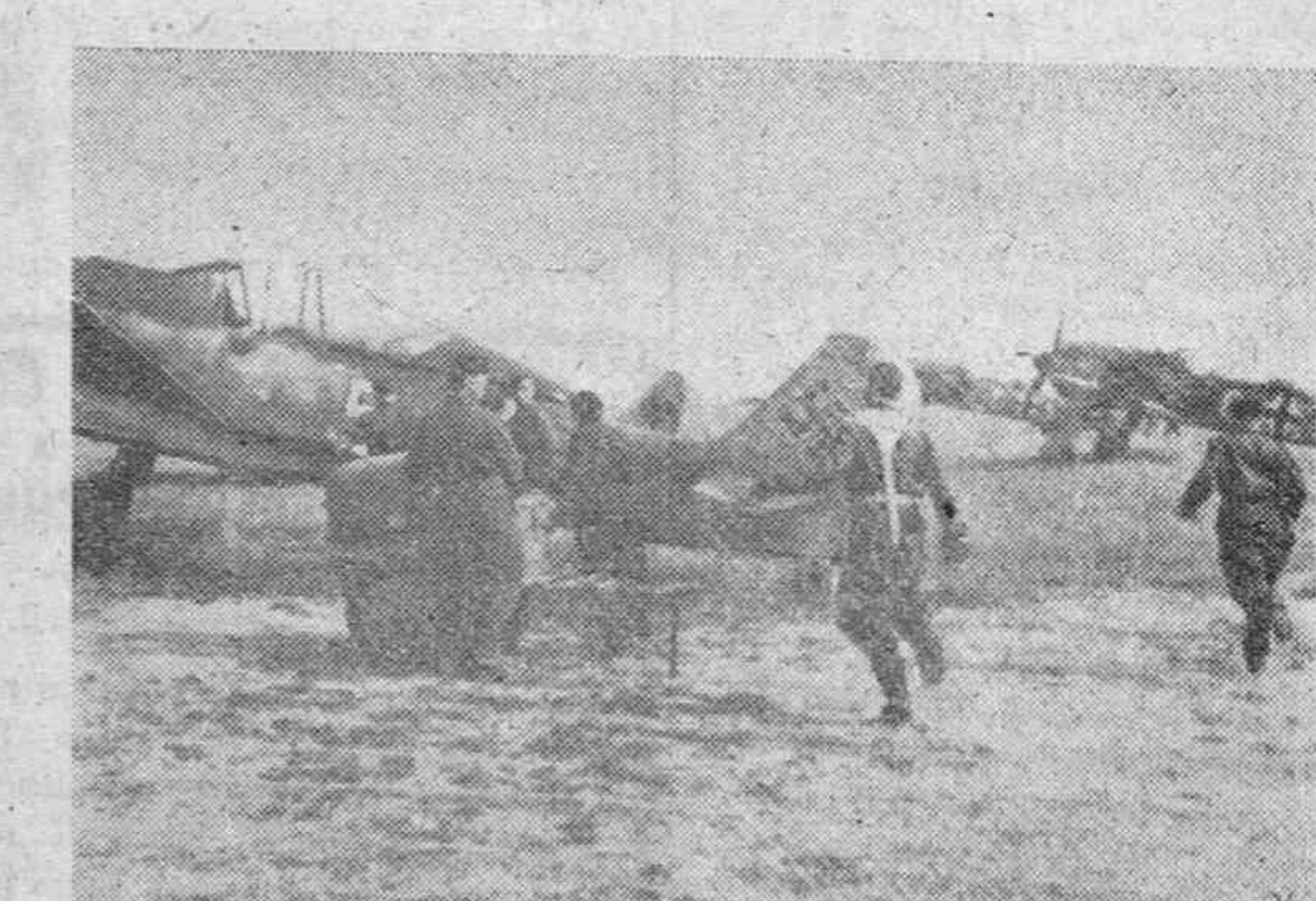
Son avistados aparatos de bombardeo enemigos y entonces, los pilotos de los cazas alemanes corren a sus aparatos y rápidos parten contra el enemigo.