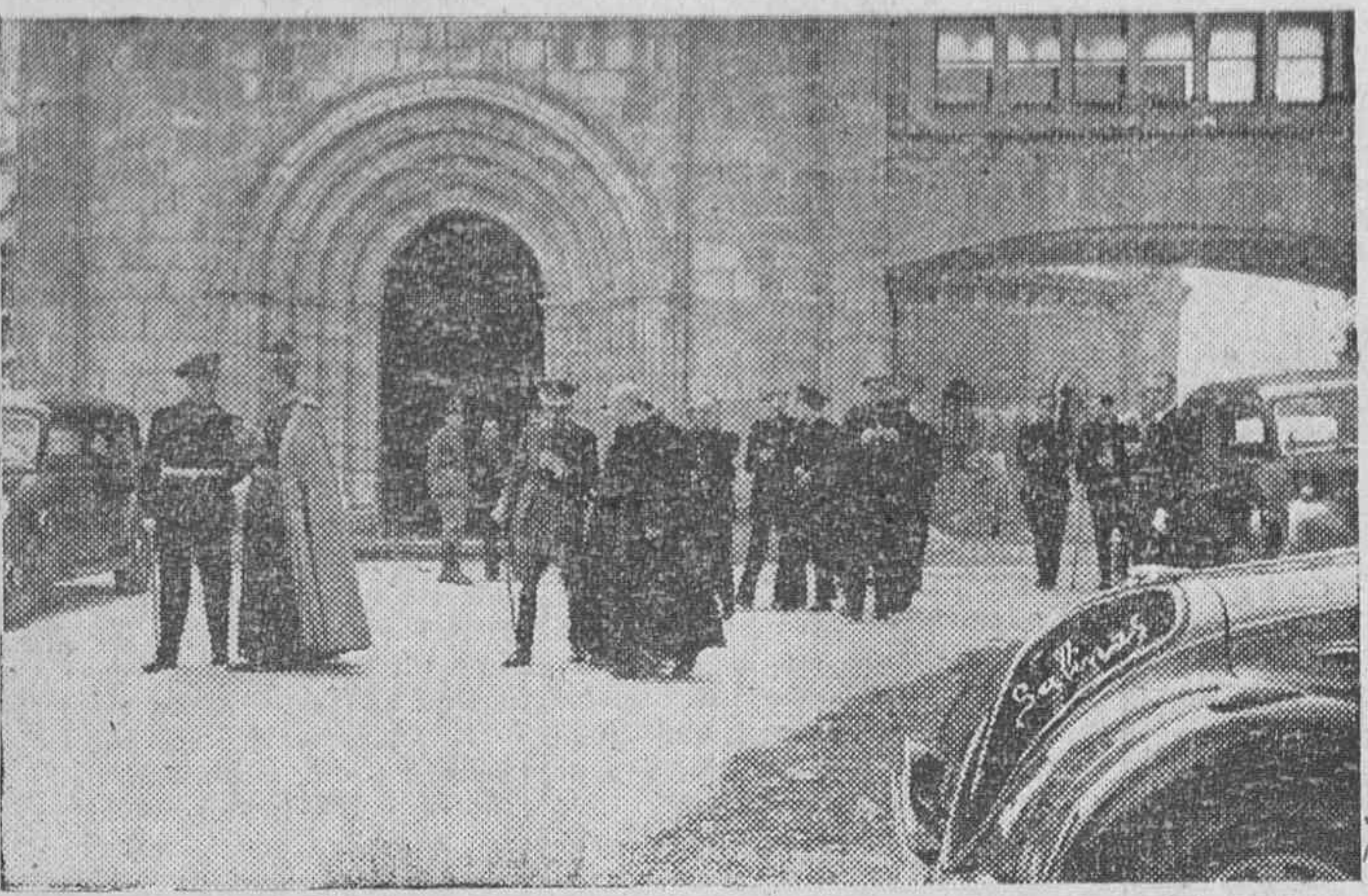
Junto a los arcos románticos de la casi milenaria Basílica, nuestras primeras autoridades cambian impresiones sobre la consolidación y restablecimiento de la misma