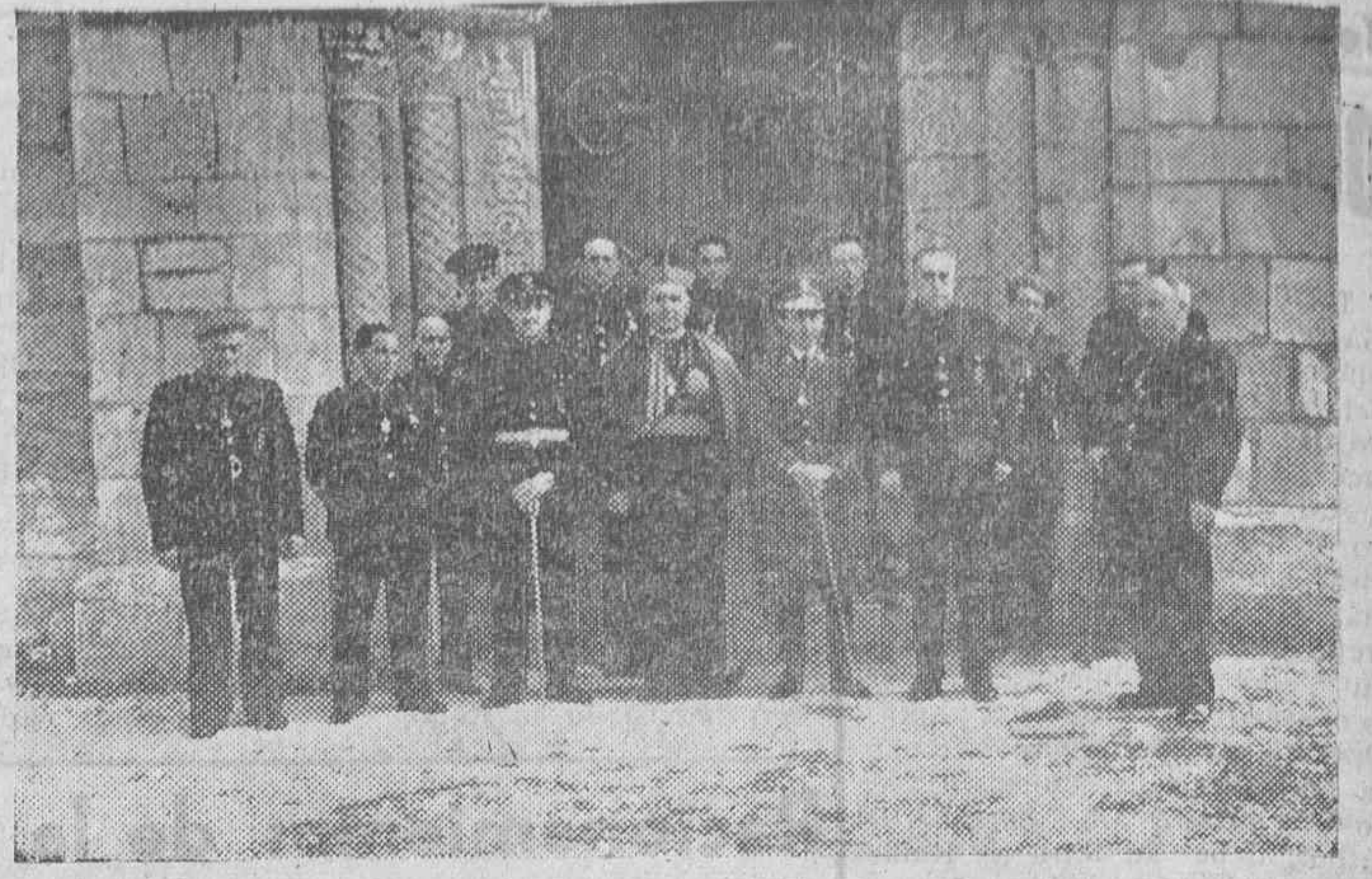
La nueva Diputación Foral y Provincial de Alava con el Prelado de la Diócesis y el Gobernador civil y Jefe Provincial del Movimiento