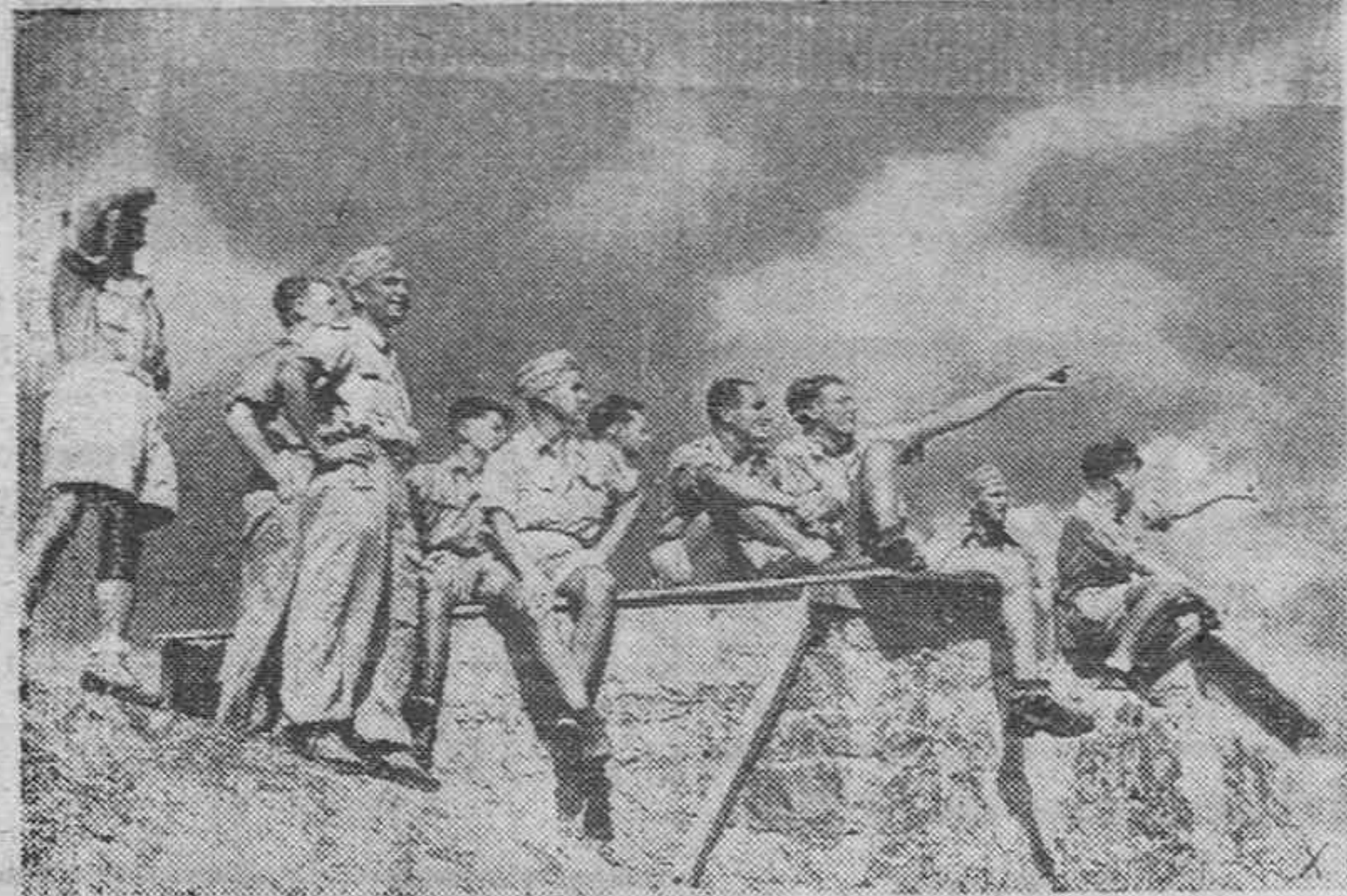
El personal de servicio de un grupo de aviones alemanes de bombardeo en el Sur atiende el regreso de los camaradas en vuelo para atacar la isla de Malta.