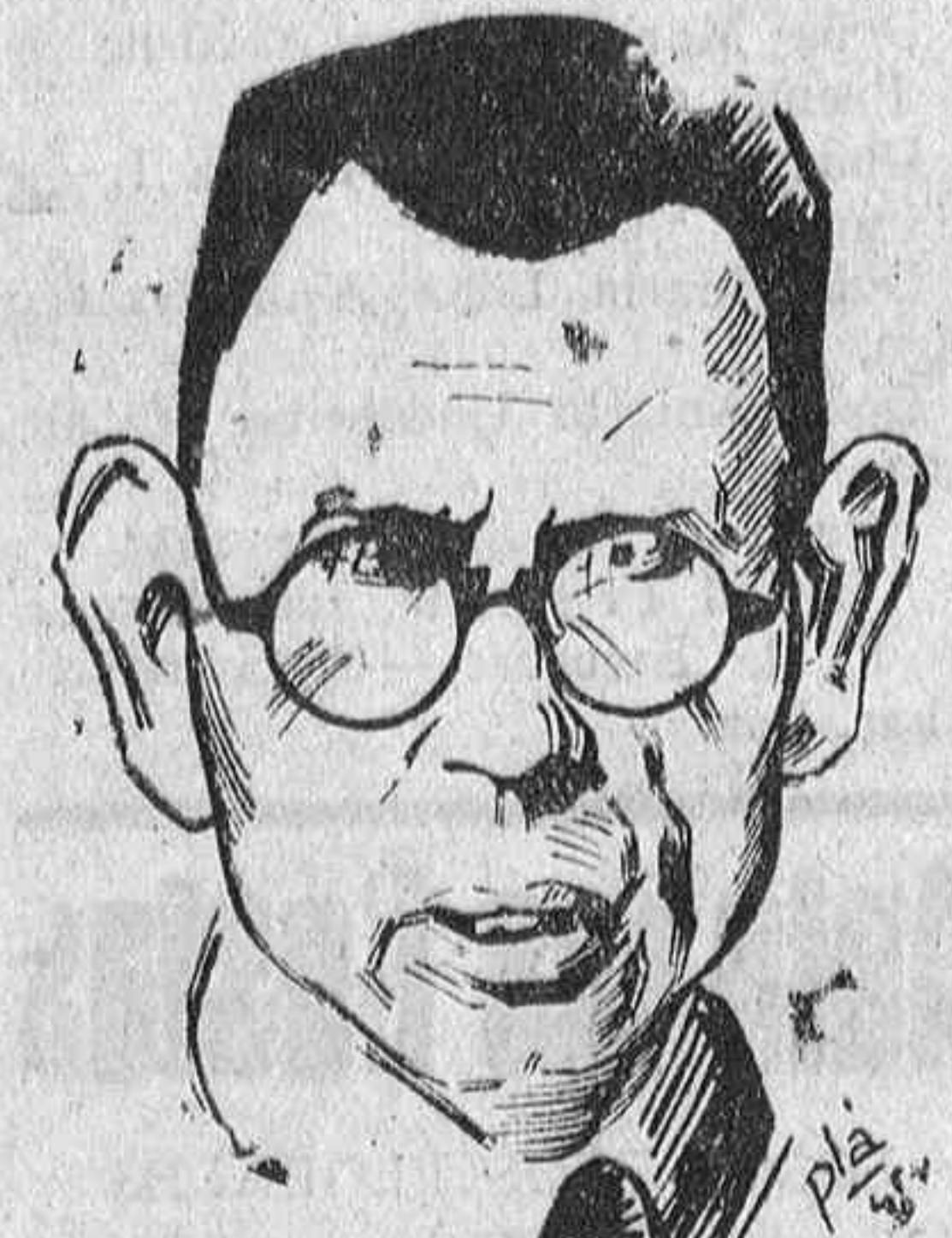
EL GENERAL VLASOV.

Praga.—Durante los cinco días del movimiento de sublevación que precedió a la liberación de Praga, y en el que ocuparon las barricadas hombres, mujeres y niños, resultaron muertos en las calles más de dos mil checos, aparte de los murieron en los hospitales a consecuencia de las heridas recibidas en la lucha, en tanto que los alemanes no tuvieron más que 530 heridos de sus tropas regulares. Un corresponsal de la United Press, Leo S. Disher, ha conseguido informarse del desarrollo de aquellos acontecimientos y hace un relato de ellos cuyo extracto transcribimos a continuación.