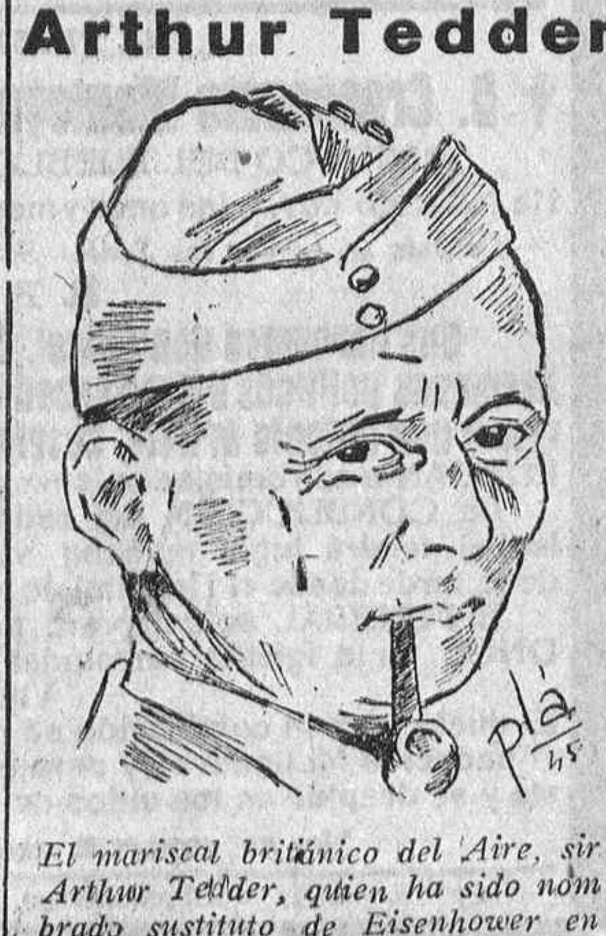
El mariscal británico del Aire, sir Arthur Tedder, quien ha sido nombrado sustituto de Eisenhower en el Mando Supremo aliado en Europa.

Arthur Tedder El espíritu religioso que imprigna toda la vida militar del Campamento, la fortaleza adquirida por la vida sana en contacto con la naturaleza, y la práctica ordenada del deporte, de la educación física; la formación política que impone con entusiasmo la adopción de un sentido de relación y convivencia por encima de toda posible coacción, inspirada en la camaradería Nacional Sindicalista; todas estas prácticas que traspantan en los Campamentos normas de vida extendidas de las instituciones que a lo largo de los tiempos demostraron su inmutable permanencia y que han sido estudiadas y adaptadas para la formación de las actuales juventudes, provoca en nuestros camaradas la aceptación unánime y entusiasta que hace segura y precisa una formación superior que, sin esta adhesión entusiasta, probablemente no pasaría de esteril y agotador esfuerzo. "Al sol y al viento de España se forjan en los Campamentos las Juventudes."—T. A.