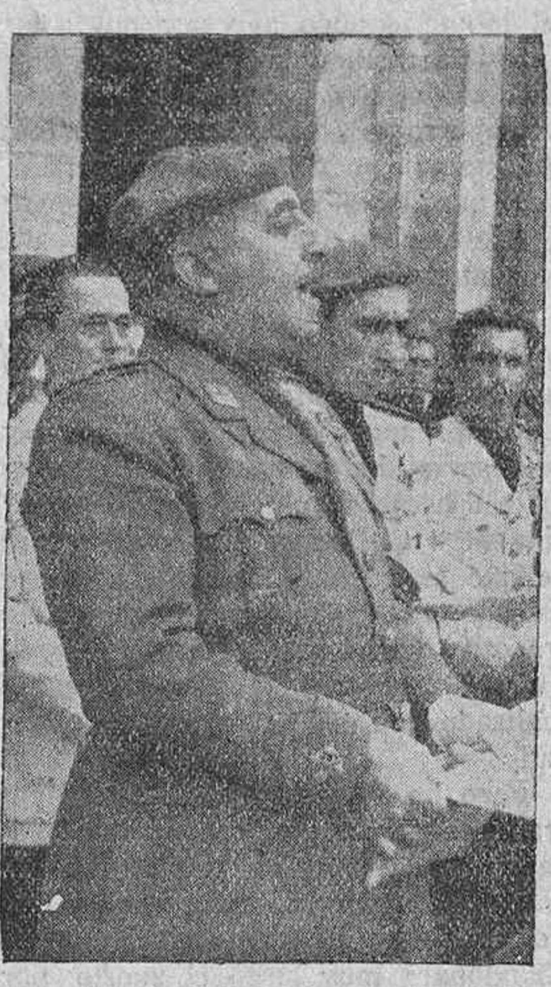
la aportación de siglos y basado en los principios de la propiedad y de la iniciativa privada, en cambio, encontramos bastardo el defender con este noble escudo los abusos del capitalismo, las explotaciones sociales o el mantenimiento de posiciones injustas o arbitrariamente alcanzadas. Así también, considerando puro y plausible el ideal de elevar y dignificar al hombre redimiéndole por la justicia social de sus miserias y necesidades, condenamos de la manera más absoluta la explotación de estos anhelos de las masas para incurrir en la aberración de destruir un orden económico que, desaparecido, sumiría a las naciones en la catástrofe que y forzadamente, con el tiempo, habría que volver a levantar.

Por encima de la victoria se descubre la lucha entre las viejas doctrinas y las formas nuevas, de apariencias halagadoras y de realidades desoladoras y bárbaras. Nosotros, por nuestros sufrimientos pasados, no podemos desconocer la razón que a unos y a otros les asiste. A aquellos, por la parte en que sostienen los principios de un orden económico que constituyen la base indestructible del progreso y del bienestar de todos; a éstos en cuanto propugnan una justicia social incompatible con la libre explotación del hombre por el hombre. Existe, a nuestro juicio, en lo conservador una parte de doctrina pura y verdadera: el orden económico no es un capricho, sino un proceso alcanzado por