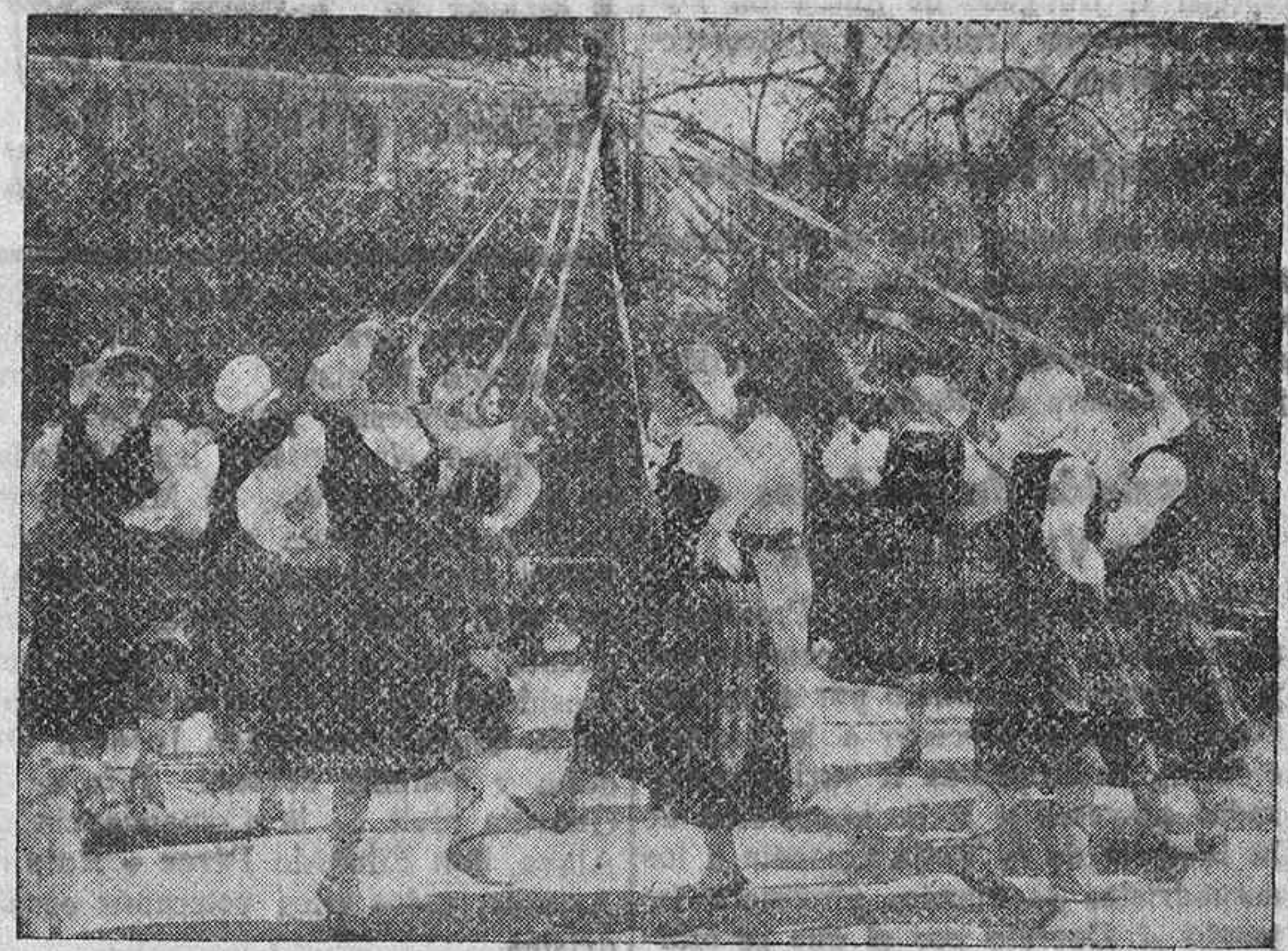
El sábado pasado, en la Plaza de España y ayer en la función de gala del Nuevo Teatro, los grupos de Danzas Folklóricas de la Sección Femenina actuaron ante S. E. el Ministro Secretario General del Movimiento, camarada José Luis de Arrese con gran acierto.