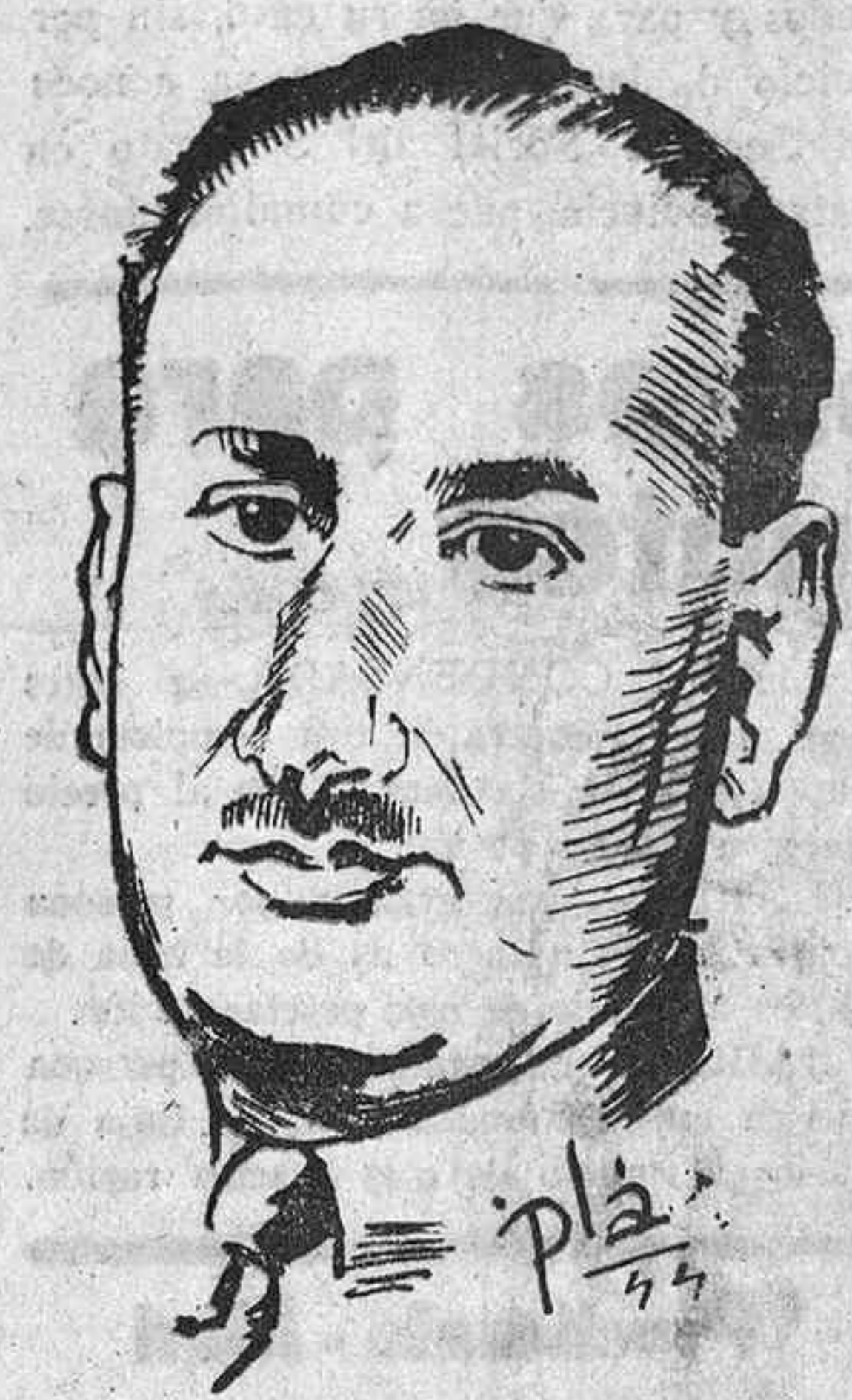
El Ministro Secretario General del Movimiento, camarada José Luis de Arrese, que ayer recibió el homenaje de los vitorianos y alaveses