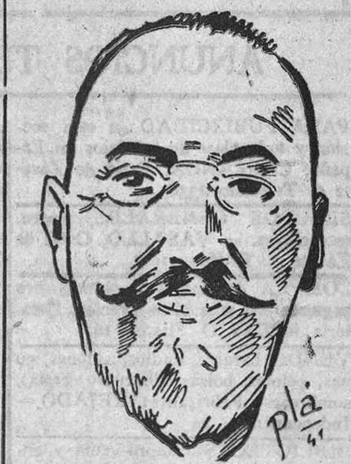
El jefe del Gobierno italiano, Bonomi, cuya dimisión se dice ha sido aplazada.

difícil el poder disponer de medios suficientes de información con los que poder dar oficialidad a las noticias.—(Efe).