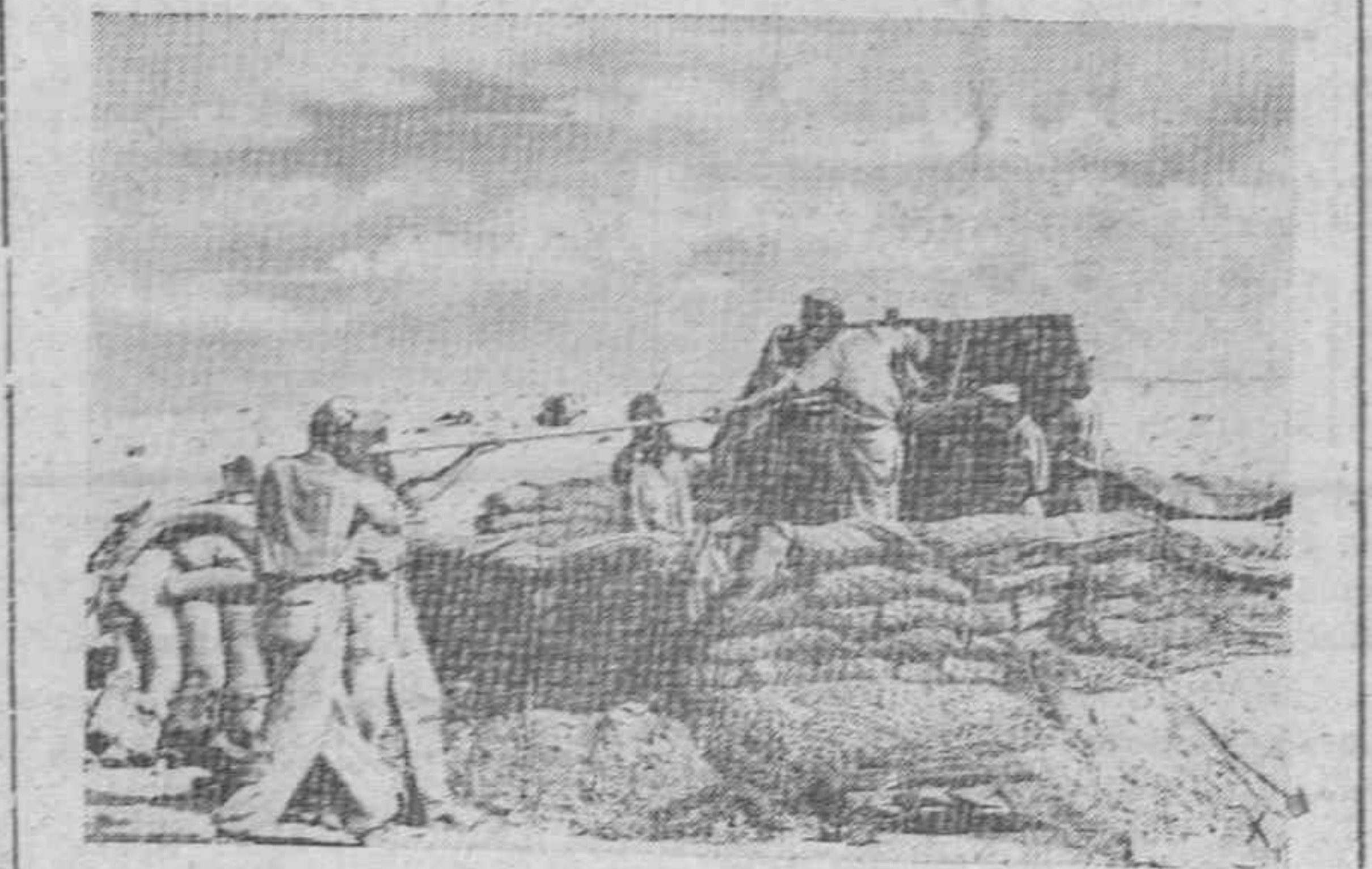
POSICION ALEMANA DE ARTILLERIA EN EL FRENTE DE EL ALAMEIN.—La arena del desierto se filtra por todas partes y por eso los artilleros tienen que limpiar a menudo las piezas.

La Subsecretaría de la Marina Mercante, de acuerdo con la Compañía, ha dispuesto que para recoger a aquéllos se dirija a Fort de France el buque de la misma empresa "Monte Alube", que se encontraba en Demeraza, a unas 480 millas de la Martinica, lo que induce a suponer que podrá llegar a Fort de France en unos dos días y medio de navegación.—Cifra.