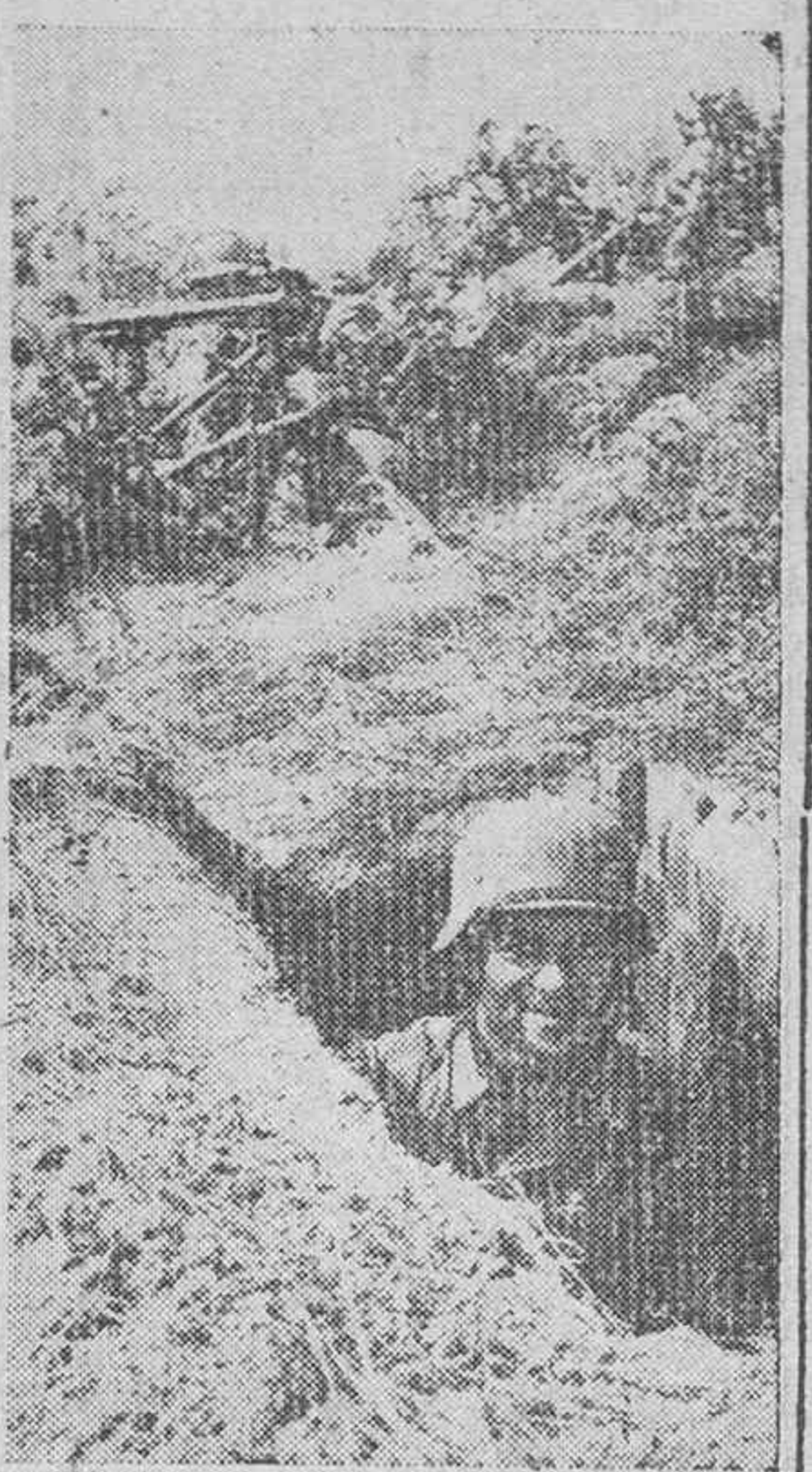
EN EL SECTOR DE KALUGA.—Un puesto avanzado de tirador alemán. Estas posiciones están defendidas por bombas de mano y armas automáticas ligeras.

El Almirantazgo británico al confesar la pérdida de un portaaviones, dos cruceros y un destructor en un ataque a un convoy aliado en el Mediterráneo cuando éste se dirigía a Malta, pone de relieve la gravedad