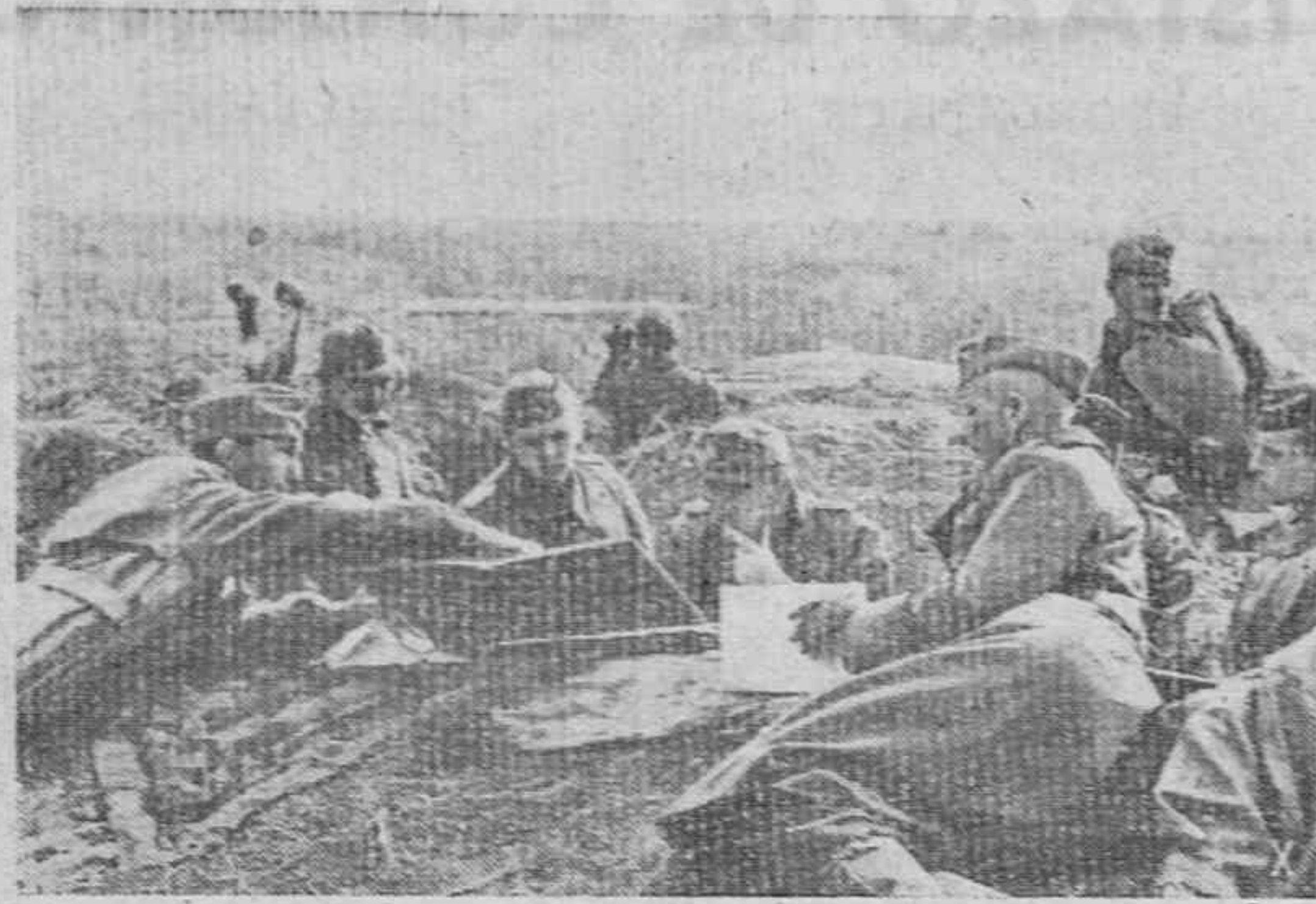
EN CUALQUIER SITIO INSTALAN LOS OFICIALES ALEMANES UN PUESTO DE MANDO.—He aquí uno de ellos en el frente de Stalingrado.