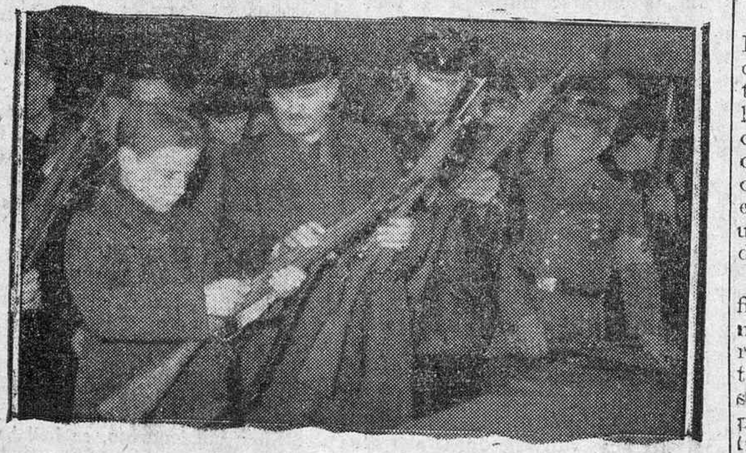
He aquí a la Milicia Popular alemana recibiendo instrucciones para su actividad en los casos que se requiera.