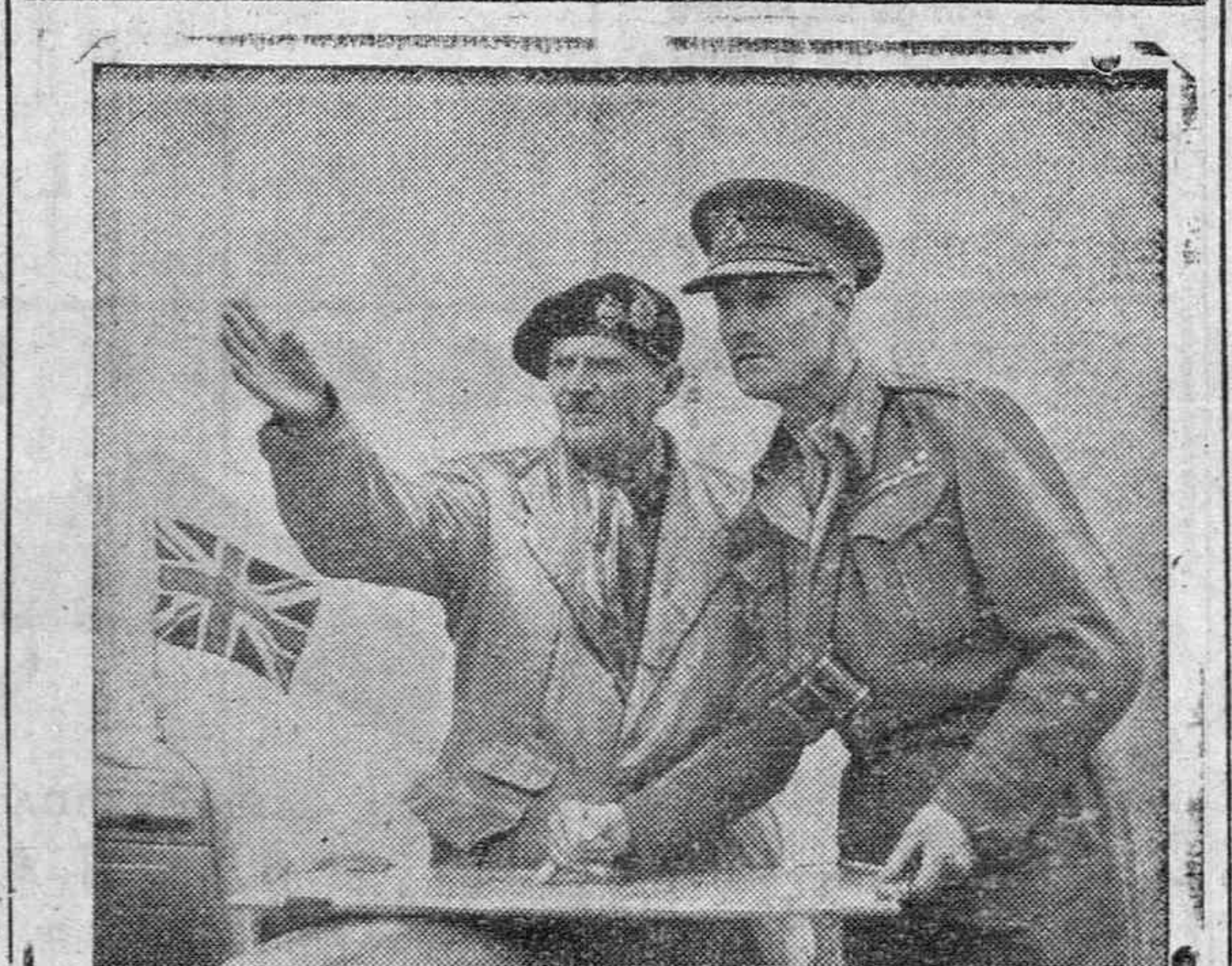
El General Montgomery y el jefe de un Cuerpo de Ejército británico, dirigiendo unos movimientos en el frente francés.

Para ser un buen representante obrero no es preciso ser orador; basta con ser honrado, vivir de su trabajo y tener voluntad de sacrificio por el bienestar de los trabajadores y de tu Patria.