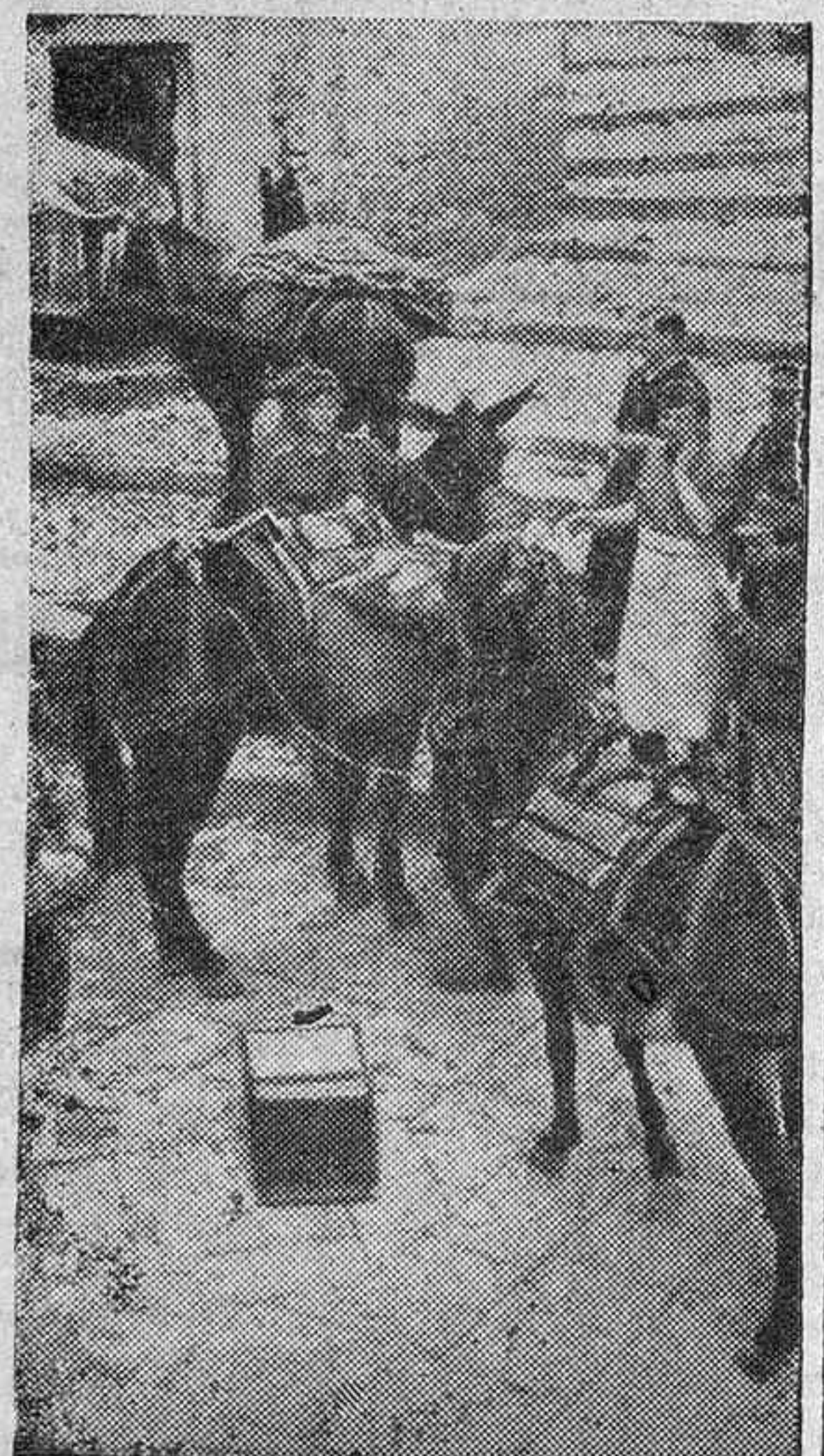
Los soldados cargan sobre los hombros las cajas y avituallamientos con destino al frente.