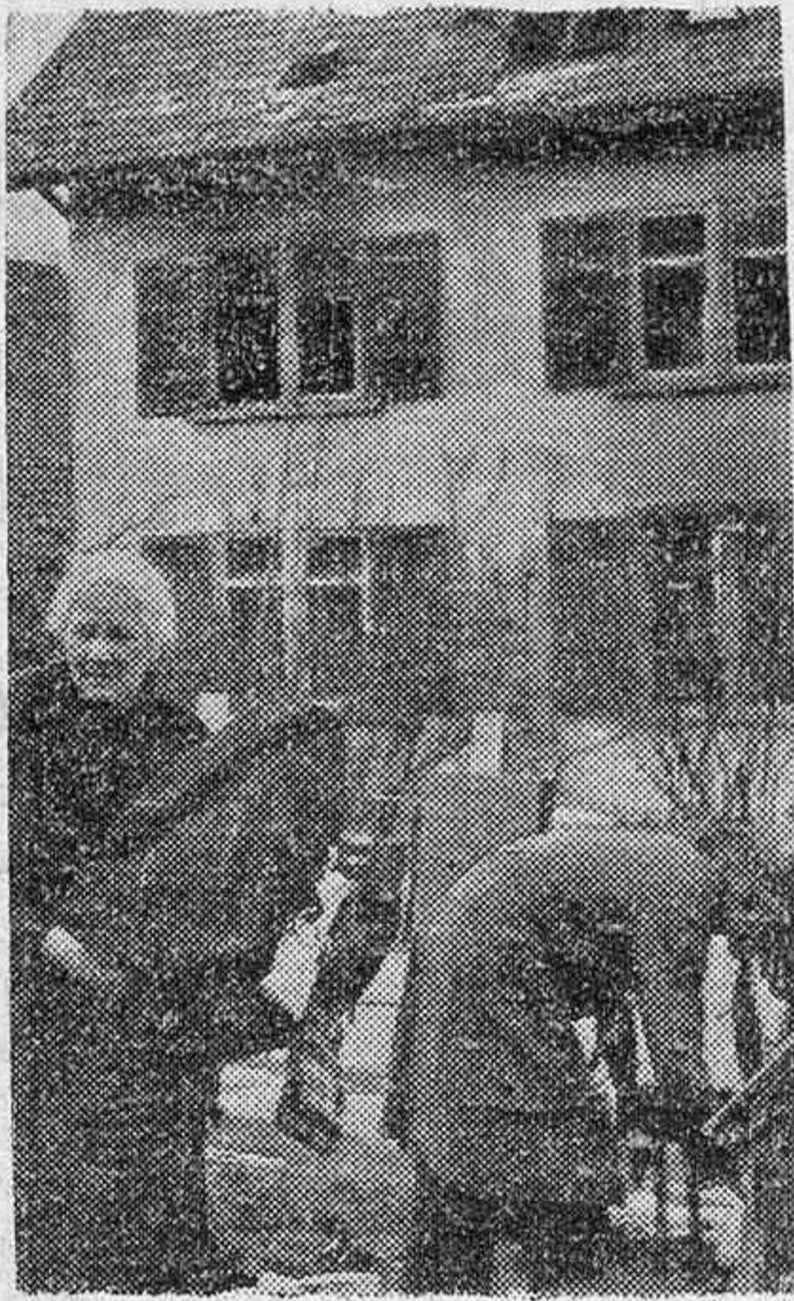
Los hogares deshechos y los humildes recogen lo que queda de sus pobres enseres para unirse a la errante comitiva.

Cuántos cuadros como esos, cuántas impresiones tristes y amargas como las que os ofrecen esos pobres evacuados, a quienes la tragedia bélica, en movimiento constante, les lanza de un lado para otro, siempre inquietos, siempre porque éste lo perdieron hace tiempo y sólo les queda la vida, empleada en el frecuente deambular y expuesta a perderla en cualquier bombardeo que les alcance en su desagradable y forzado peregrinar por este valle, o desolado, que para ellos sí que es de lágrimas. Si vive dentro de unos años, ¿qué podrá hablar de las alegrías y encantos de la niñez aquel pequeño que marcha en cabeza de la caravana, con la manita al hombro, gustando de las amarguras de la guerra y andando medio descalzo por los caminos dolorosos que recorren todos los días los que no tienen hogar, ni paz, ni esperanza?—SAB.