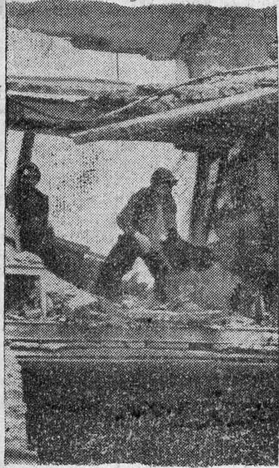
Así quedan las habitaciones después de los bombardeos. Entre sus escombros se busca lo que queda del ajuar.

Es una fotografía que impresiona y que lleva a uno a pensar que lo mismo podíamos haber estado expuestos a esa gran tragedia, y por ello le impulsa a dar gracias por la inmensa dicha de que nos veamos de otro modo más feliz. Porque en esa calle que hemos descrito aparece una errante caravana de personas que muestran en el semblante todas las impresiones del drama que viven. En