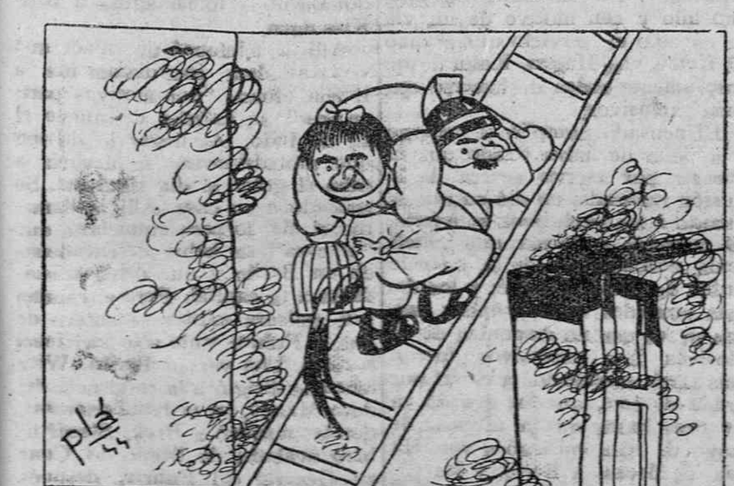
—¡A ver si hay formalidad, señoría!