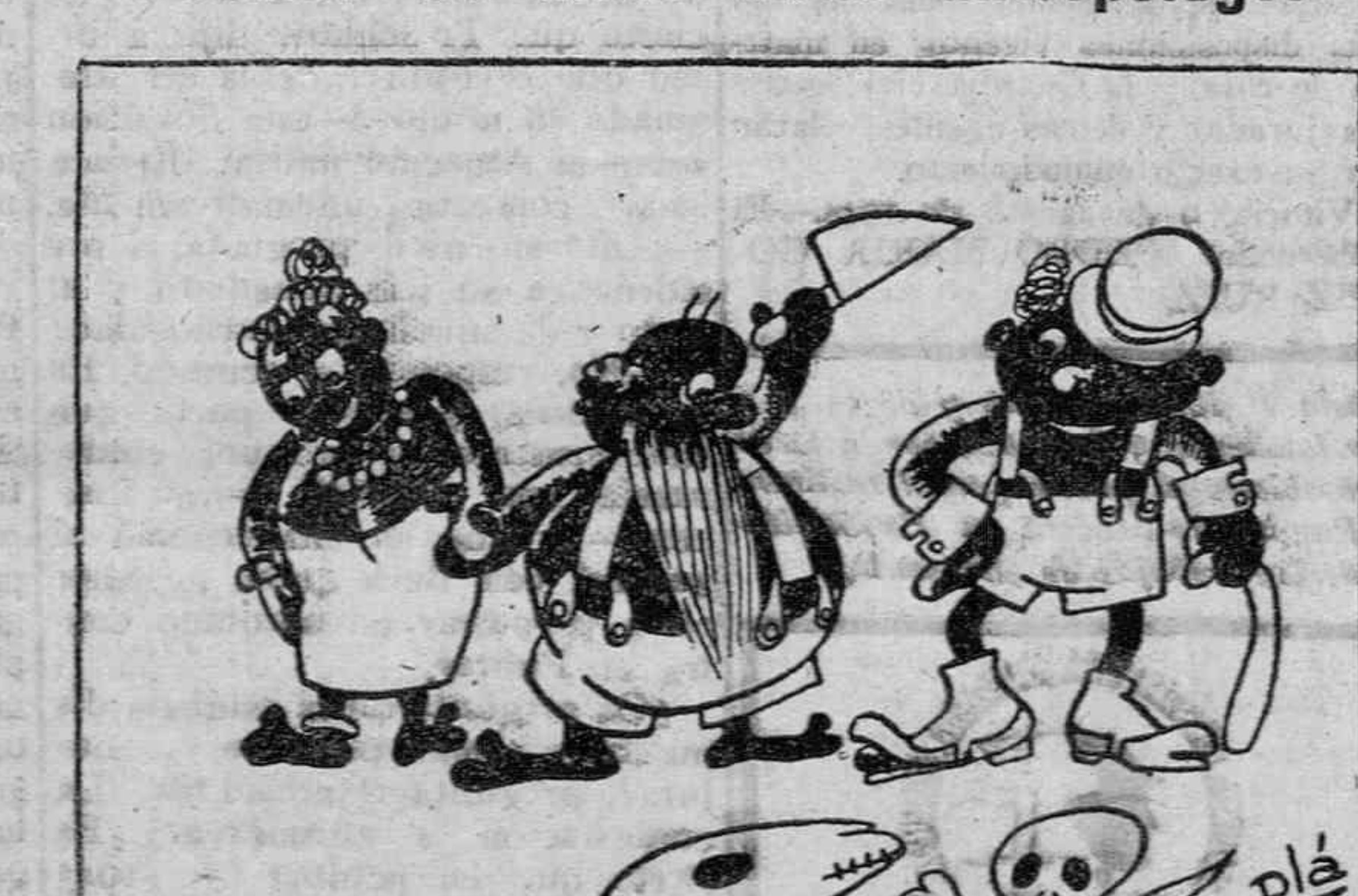
—¿La va a tomar, o se la envuelvo?