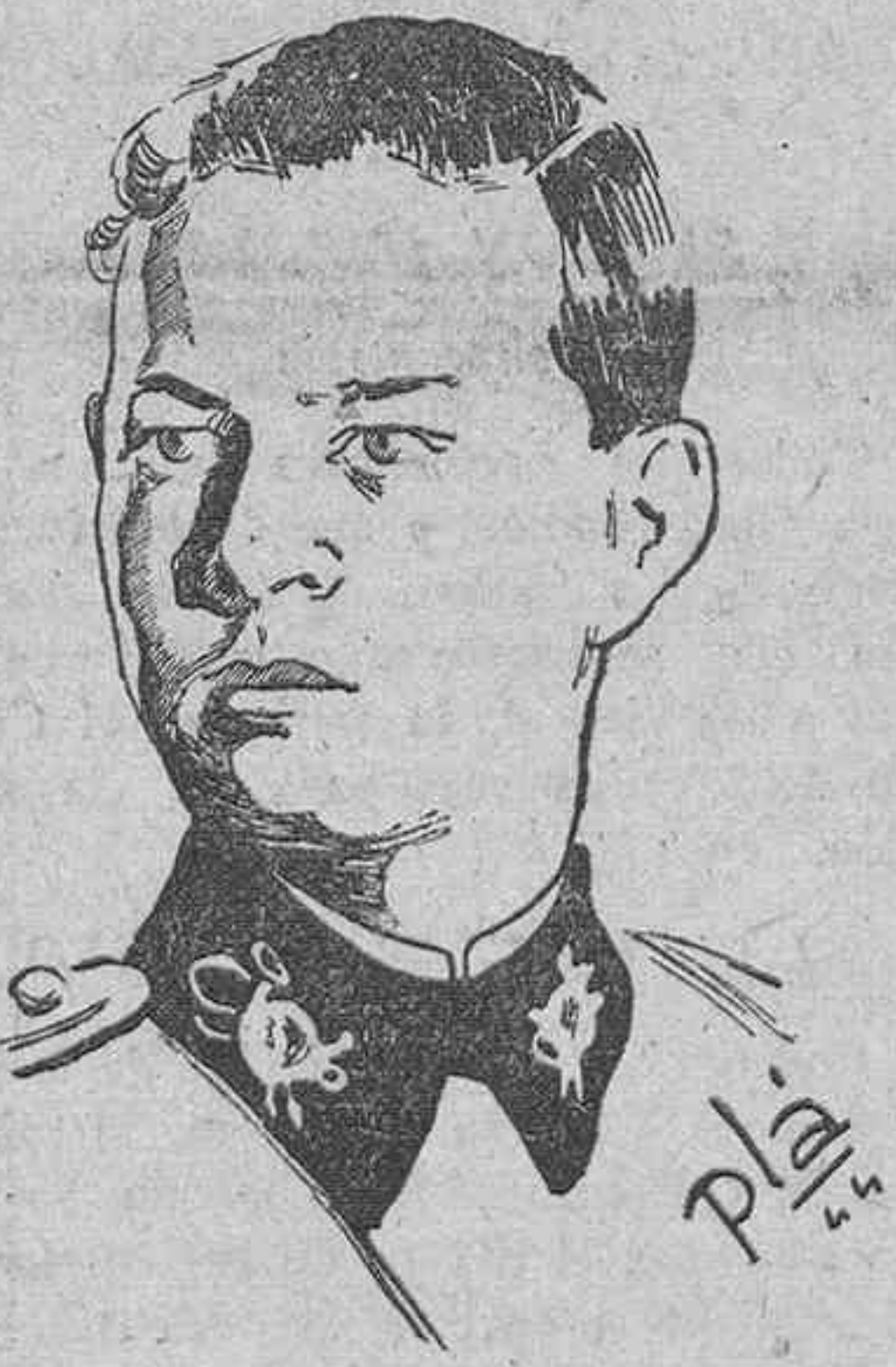
REY MIGUEL DE RUMANIA

Dicho comentarista agregó que la Gran Bretaña aprobó la indicación del secretario de Estado, James F. Byrnes, de que el ministro de Asuntos Exteriores soviético debería estar preparado para discutir el asunto de la reunión de ministros de Asuntos Exteriores que se inaugura el 10 de septiembre. Subrayó que "no hay que pensar en que se produzca cambio alguno de la actitud de Estados Unidos e Inglaterra hacia el actual régimen político de Rumania".