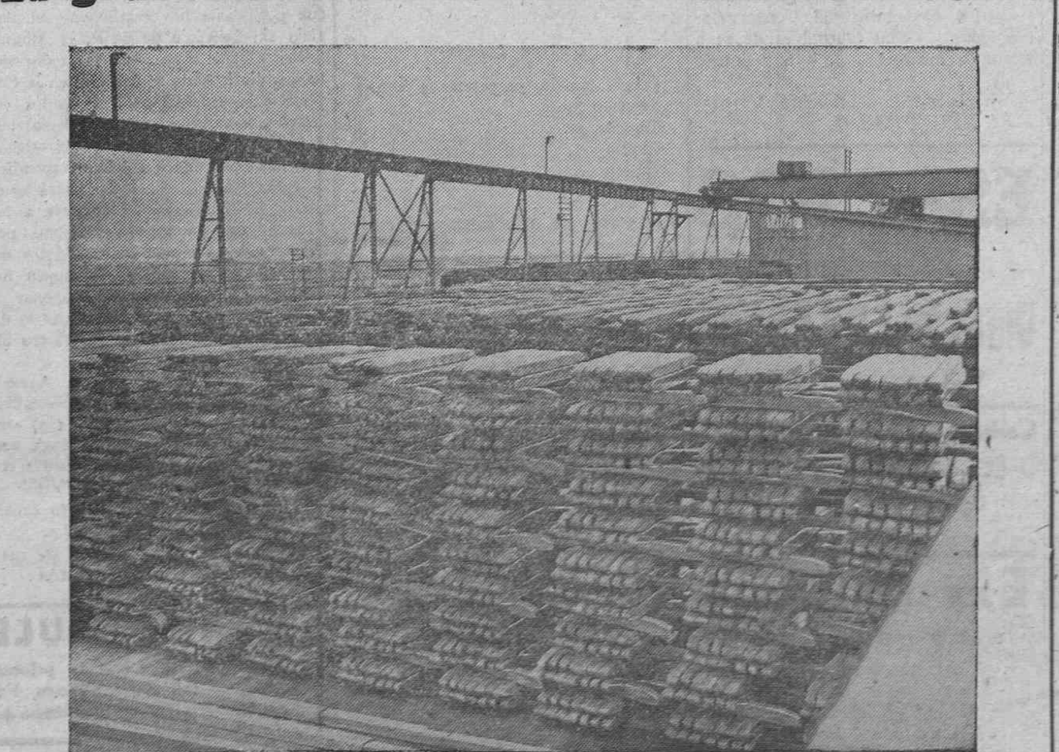
El metal de cobre, una vez salido de los hornos de refinación se vierte en moldes especiales para su mayor y más fácil manejo y envío. Estas lingotes de cobre se hacen de diversas formas para los diferentes usos de aplicación industrial. En la presente fotografía aparecen siete millones de libras en barras de cobre, que en su mayor parte serán destinados para cables y que esperan el turno de ser enviadas desde el muelle de carga de la gran refinación a su punto de destino.