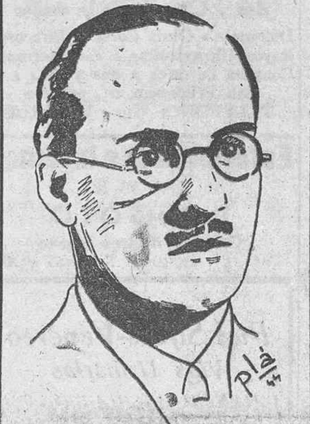
El Ministro de Educación Nacional, señor Ibáñez Martín, que inaugurará mañana el nuevo Museo Etnográfico

Barcelona.— Han salido para los campamentos de verano del Frente de Juventudes mil camaradas que van a engrosar los primeros turnos de estos campamentos. Fueron despedidos en la estación por las autoridades y jerarquías.—Cifra.