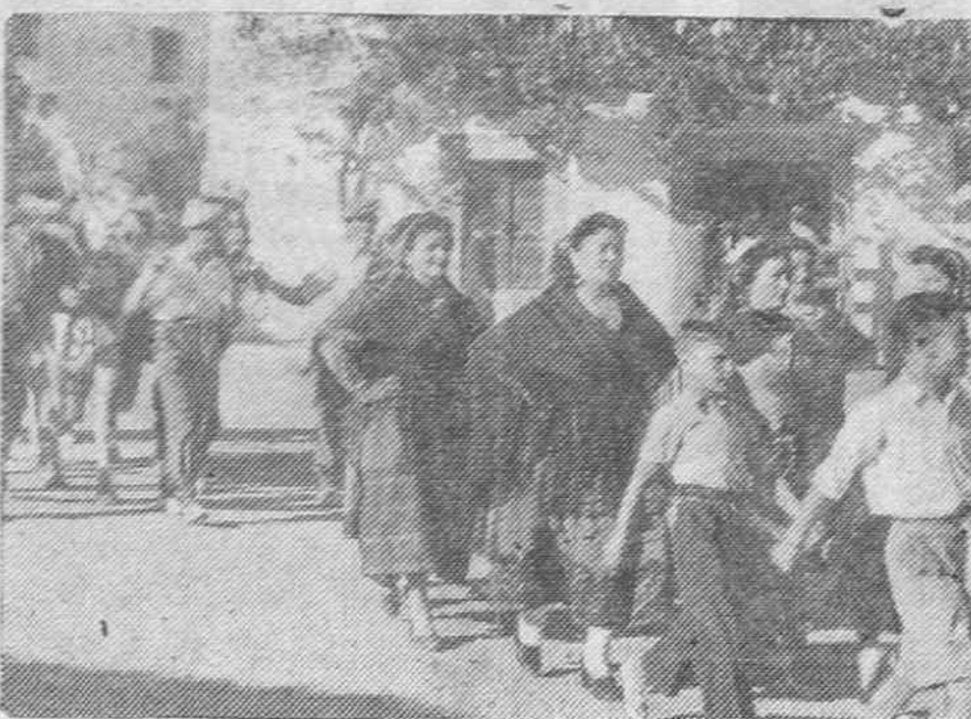
Son los días de julio, alegres y claros, con voces de romería en sus fiestas patronales, a las que se asocia toda el pueblo y sus juventudes.