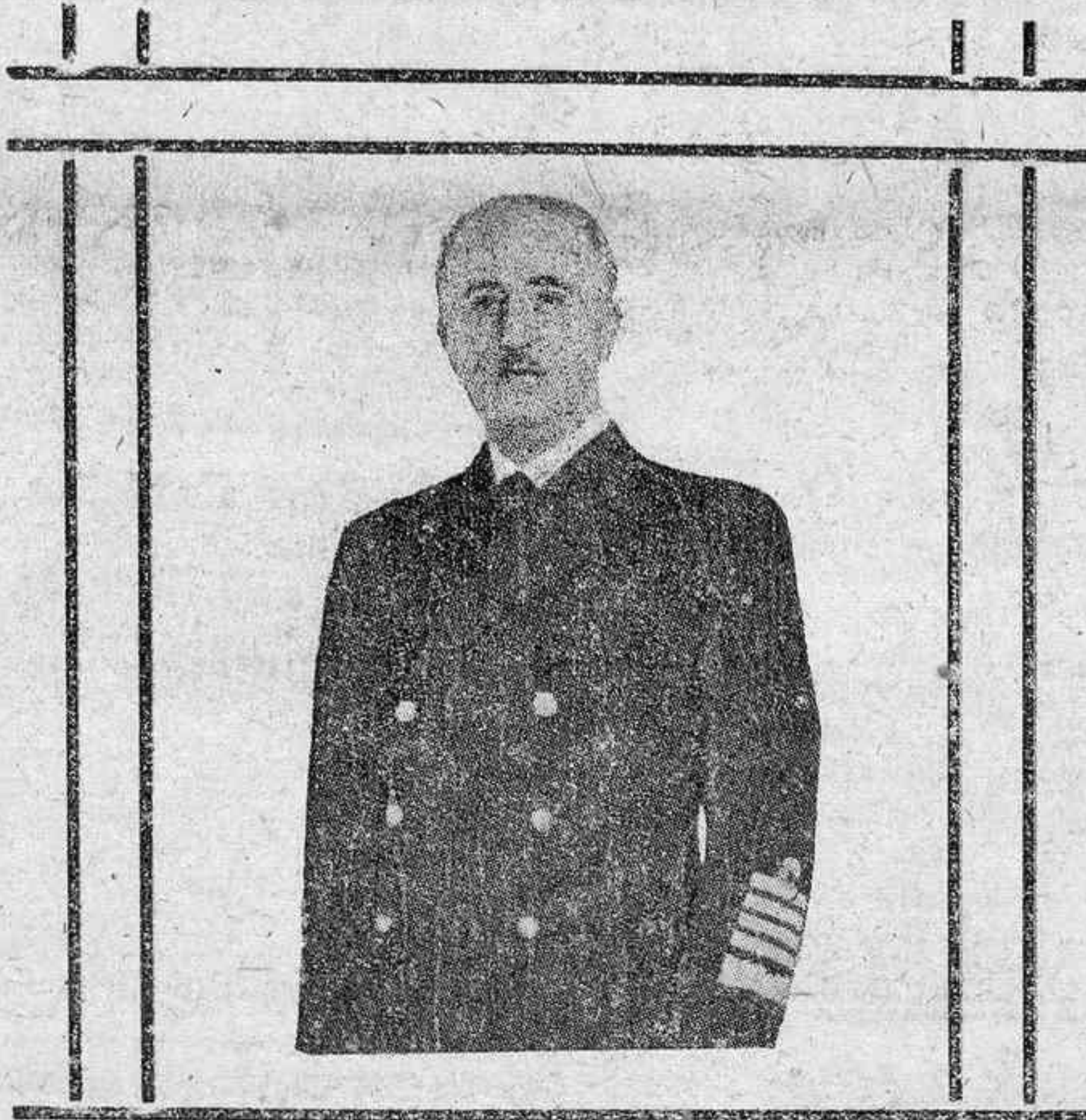
Generalísimo Franco, artífice de la Victoria—que a tanto nos obliga—y conductor en la paz—al margen de las contiendas internacionales—de nuestra Patria.

Aceptémoslas con resignación teniendo muy presente que, como dice el Apóstol,