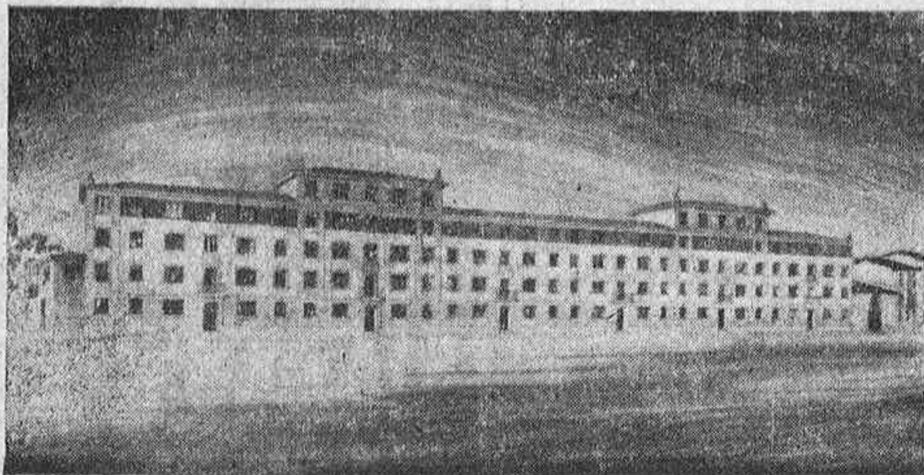
El grupo de casas económicas para obreros y empleados, construido por el Ayuntamiento en las calles del Cubo y Calvo Sotelo.

En lo que a nuestra provincia de Alava se refiere, el problema de la vivienda afecta más principalmente a la capital, aunque haya también algunos pueblos donde se advierta ese problema general de España.