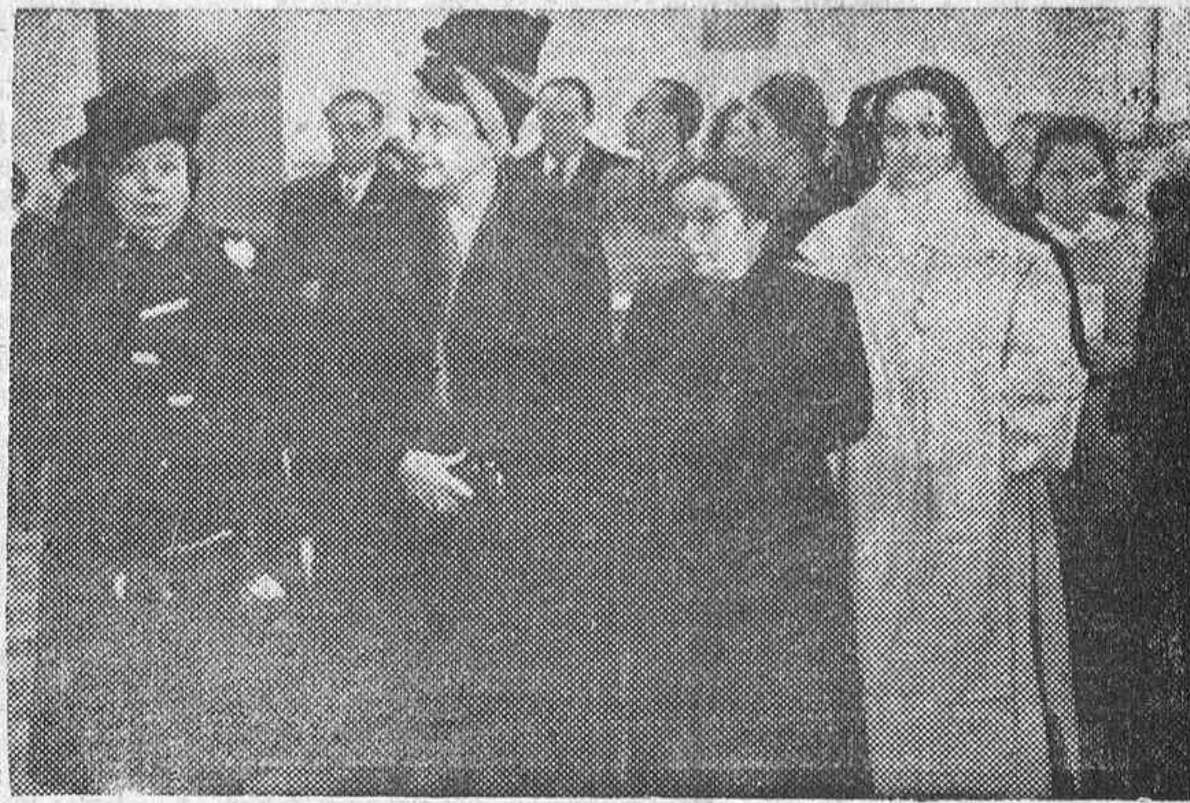
Un momento de la inauguración y bendición de los Talleres Penitenciarios en la Prisión Provincial de Mujeres de Ventas.