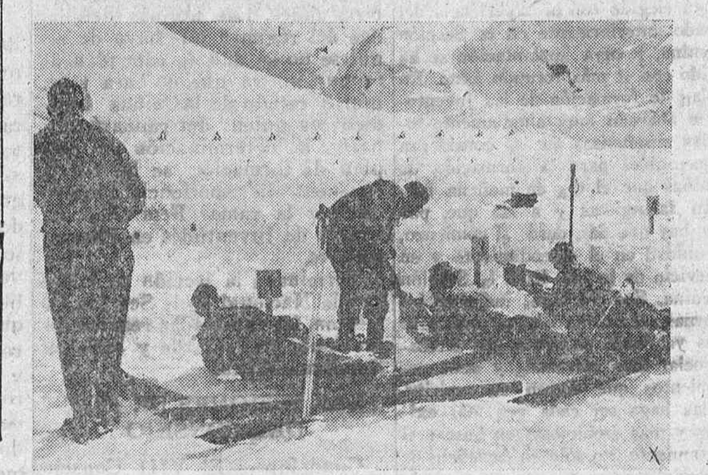
El aprendizaje de esquí, capítulo importante de la preparación pre militar de las juventudes alemanas