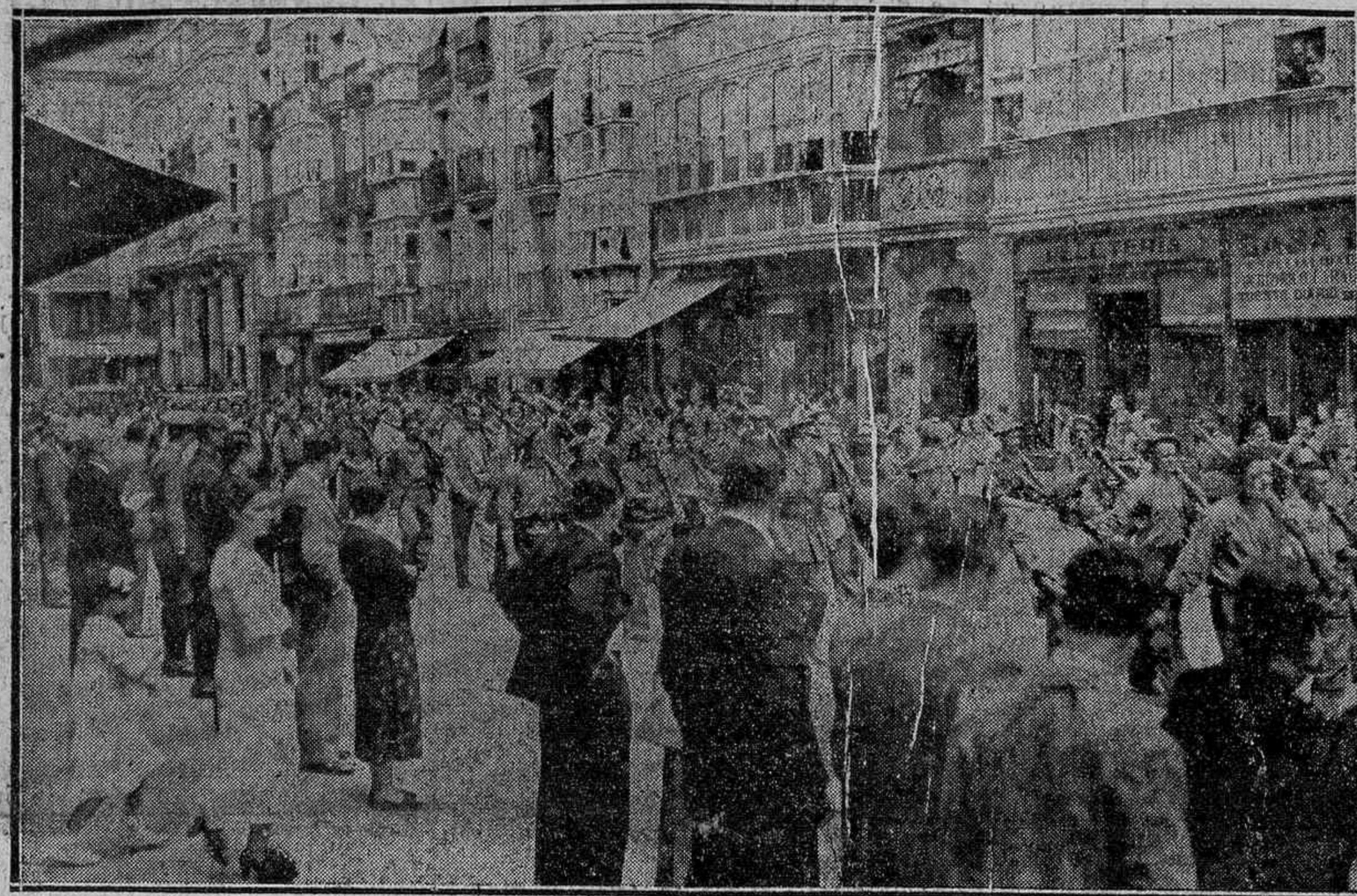
Das interesantes fotografías tomadas por don Alberto S. Koch del desfile realizado el día de Santiago por las calles de Vitoria