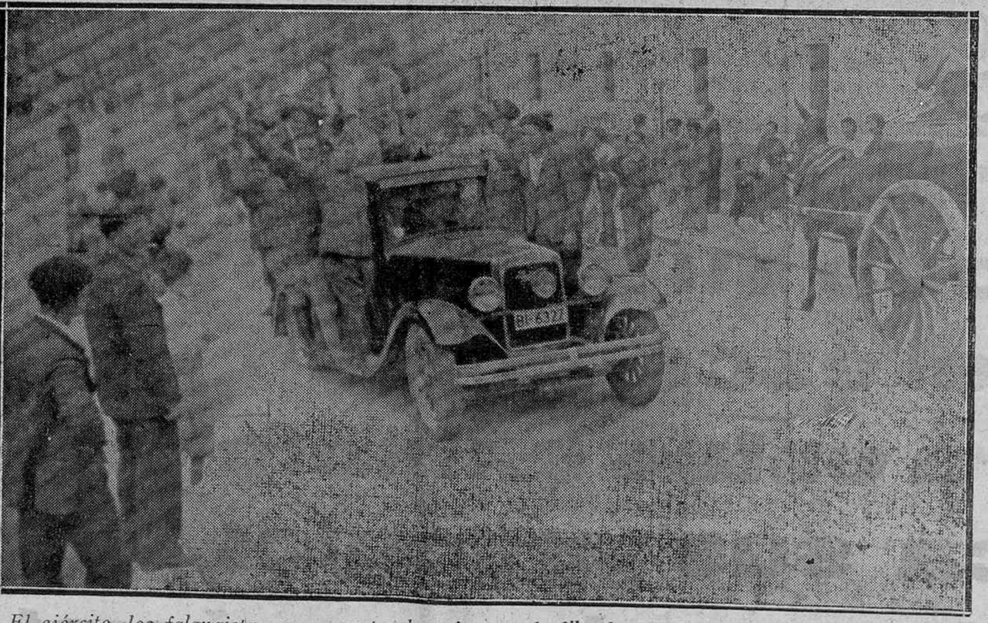
El ejército, los falangistas y un grupo de paisanos, desfilando por las calles de Vitoria al grito de Viva España