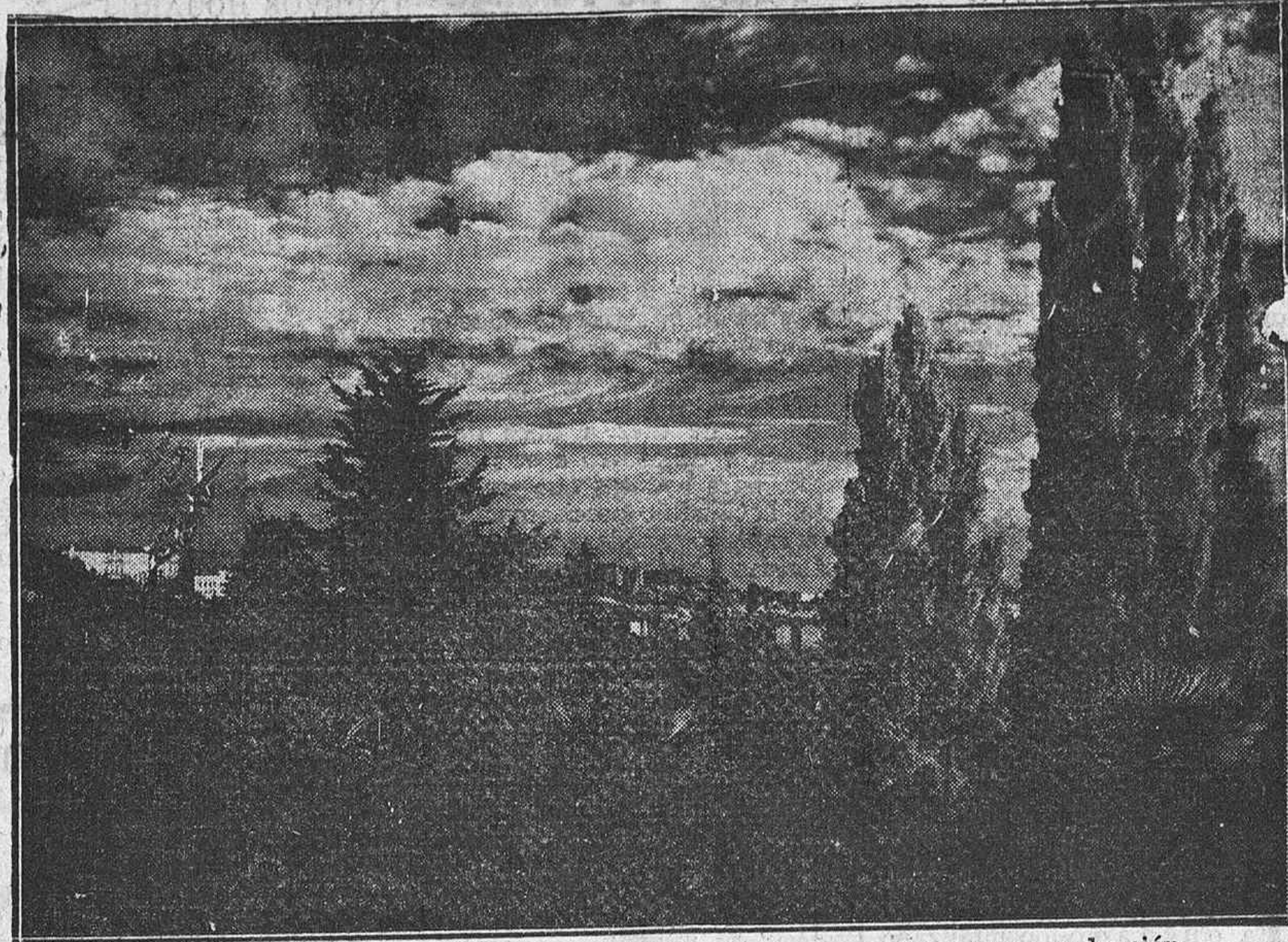
Entre arbolado y jardinería, este Madrid parece una promesa de cercana redención.

Libros nuevos recibidos Obra Nacional Corporativa Plan: Los Intelectuales y la Tragedia Española El Pensamiento Económico de B. Mussolini Dos discursos de Calvo Sotelo. Cuarto avance del informe oficial. Justicia y carácter de la guerra nacional española. Fotografías de Franco. De venta en LIBRERIA CERVANTES (Data. 32)