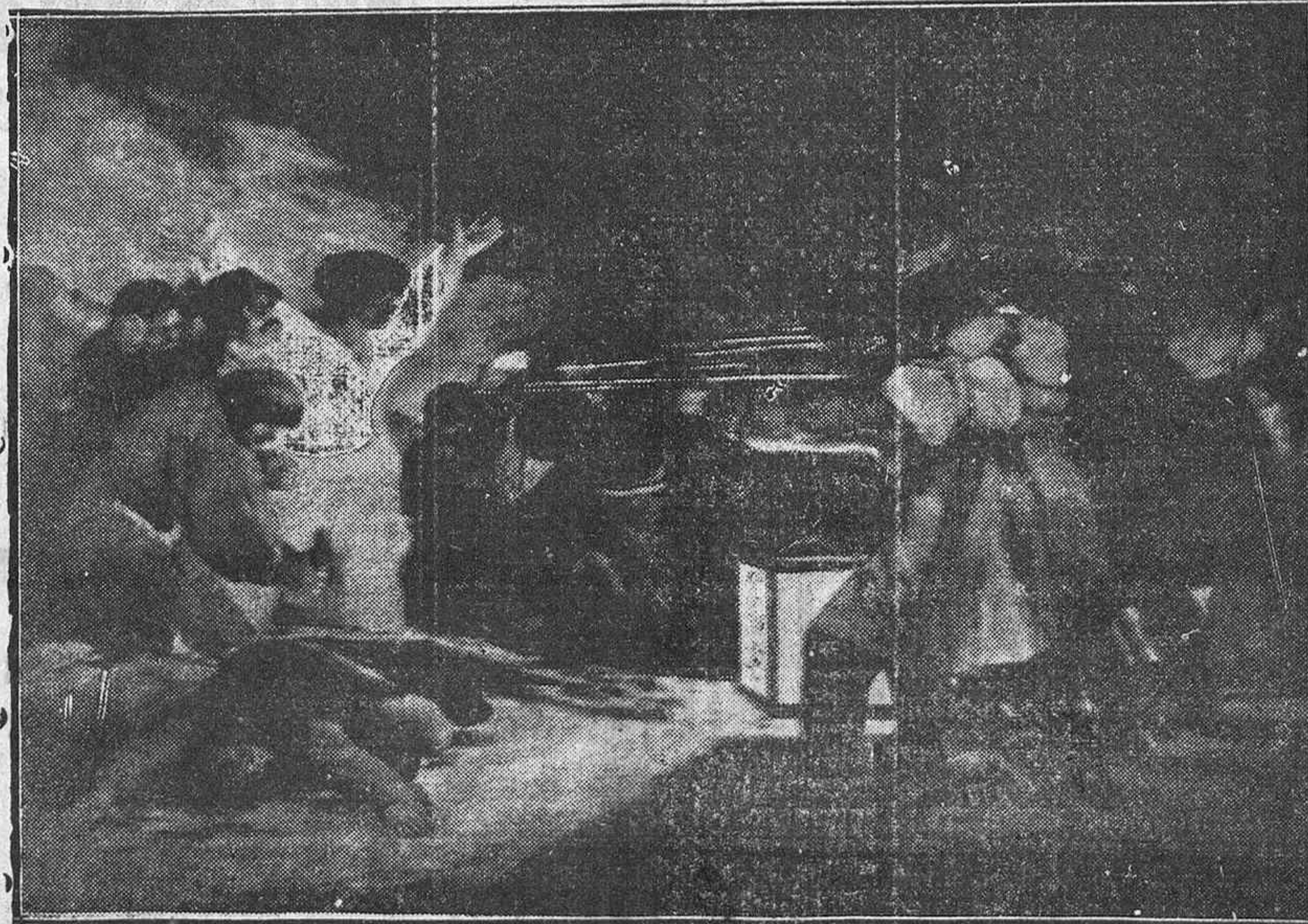
Ayer como hoy. Sangre española, regando la Montaña del Príncipe Pío. La furia francesa, hace disparar en 1808 los fusiles de los "mamelucos" a las órdenes de Murat, de Langrage y de Ruche, sobre la carne heroica y popular de España, como en 1937 las hordas de Miaja vendidas a la Masonería de Francia, habían de acribillar los cuerpos de otros héroes, en los patios del Cuartel de la Montaña, sobre los mismos palmos de tierra, ya simbólicos para la infamia y el martirio. Ayer como hoy, el mismo grito por España y la misma estampa trágica, por la misma gloriosa independencia.

Tercer premio de diez mil pesetas: número 9.178 a Zafra. Premiados con dos mil pesetas: números 1.881, 8.384, 3.806.